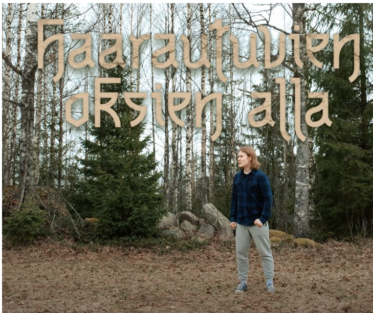
Kuva 4. Lyhytelokuvan nimi.