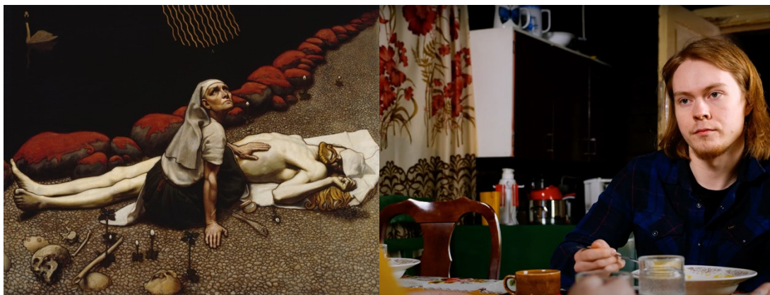
Kuva 2. Gallen-Kallela, A. (1897). Lemminkäisen äiti . Ateneumin taidemuseo, Helsingin taidemuseo.

Lyhytelokuvan kuvatyylin inspiraationa käytettiin Akseli Gallen-Kallelan Kalevala-aiheisia teoksia. Lemminkäisen äiti on tunnettu Kalevala-aiheinen teos, minkä vaikutteita käytettiin lyhytelokuvan kalevala-vaikutelman ylläpidossa. Lainaamalla Gallen-Kallelan Lemminkäisen äiti teoksen valaistusta, väripalettia ja sävyjä voitiin luoda teoksessa esiintyvä värimaailma lyhytelokuvaan käyttämällä Adobe Premieren Lumetri color -ominaisuutta (Kuva 2). Värimäärittely voidaan tallentaa pohjana, mitä voidaan käyttää esimäärittelyksenä muiden kohtauksien värimäärittelyssä – Lut (Look-up table). Lutin avulla värimäärittely säilyy yhtenäisenä lyhytelokuvan kaikissa kohtauksissa (Adobe 2025).