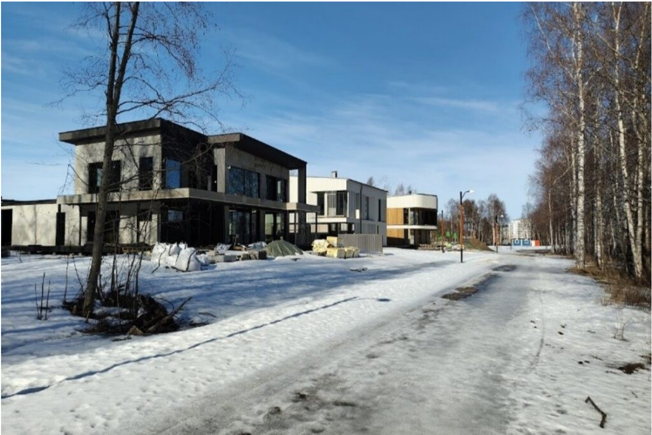
KUVA 2. Oulun asuntomessujen vuoden 2025 rakennuksia rakenteilla.