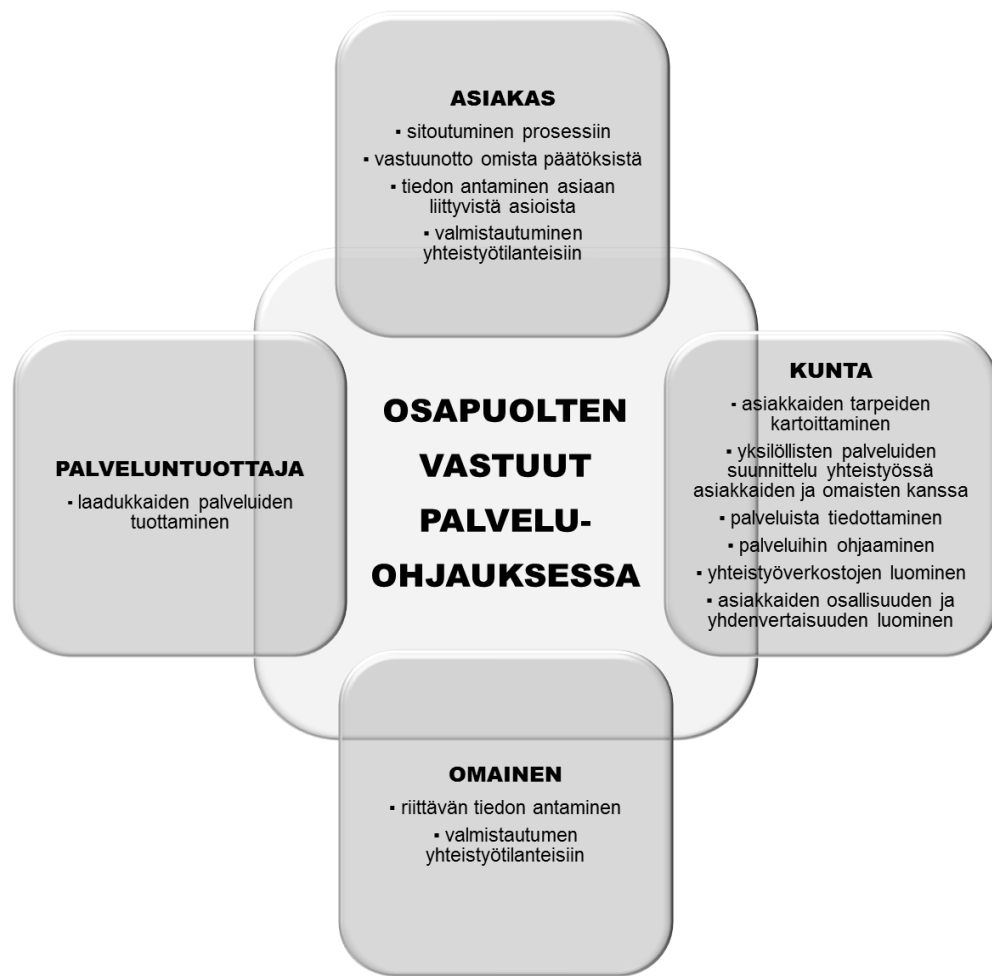
KUVIO 2. Osapuolten vastuut palveluohjauksessa. (Mukaiillen Valtakunnallinen vammaispalveluhanke, palveluohjaustiimi 2012, dia 23.)

Vammaisen henkilön tarvitsemien palvelujen ja tukitoimien selvittämiseksi on ilman aiheetonta viivytystä laadittava palvelusuunnitelma siten kuin sosiaalihuollon asiakkaan asemasta ja oikeuksista annetun lain (812/2000) 7 §:ssä säädetään. Palvelusuunnitelma on tarkistettava, jos vammaisen henkilön palveluntarpeessa tai olosuhteissa tapahtuu muutoksia sekä muutoinkin tarpeen mukaan. Tämän lain mukaisia palveluja ja tukitoimia koskevat päätökset on tehtävä ilman aiheetonta viivytystä ja viimeistään kolmen kuukauden kuluessa siitä, kun vammaisen henkilö tai hänen edustajansa on esittänyt palvelua tai tukitointa koskevan hakemuksen, jollei asian selvittäminen erityisestä syystä vaadi pitempää käsittelyaikaa.