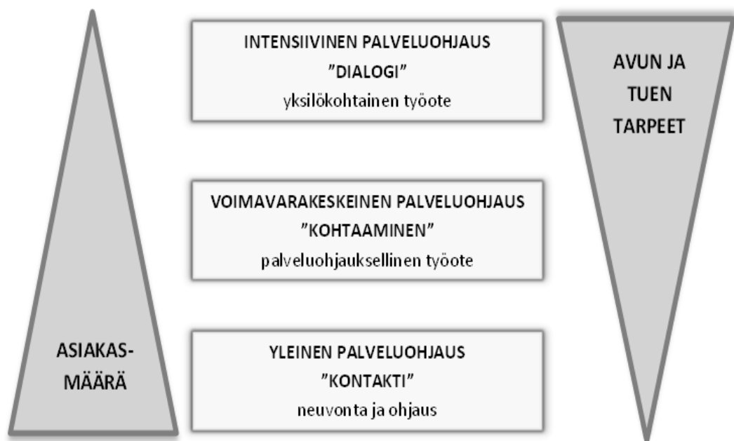
KUVIO 1. Palveluohjauksen mallit ja työotteet. (Mukaillen Hänninen 2007, 17.)

Palveluohjauksen tavoitteena on auttaa asiakasta saamaan omat voimavaransa käyttöönsä niin, että hän selviää jatkossa ilman palveluohjausta. Palveluohjauksen yksi tavoite onkin tehdä itsensä tarpeettomaksi. Myös järjestelmätasolla palveluohjauksen tavoitteena voidaan pitää sitä, että palveluohjaus (KUVIO 1.) erityisenä työmuotona tekee itsensä vähitellen tarpeettomaksi. Sinä päivänä, kun sosiaali- ja terveydenhuollon työntekijät toimivat asiakaslähtöisesti ja sujuvasti verkottuneina yli sektorirajojen, ollaan tässä tavoitteessa jo pitkällä. (Hänninen 2007, 3.)