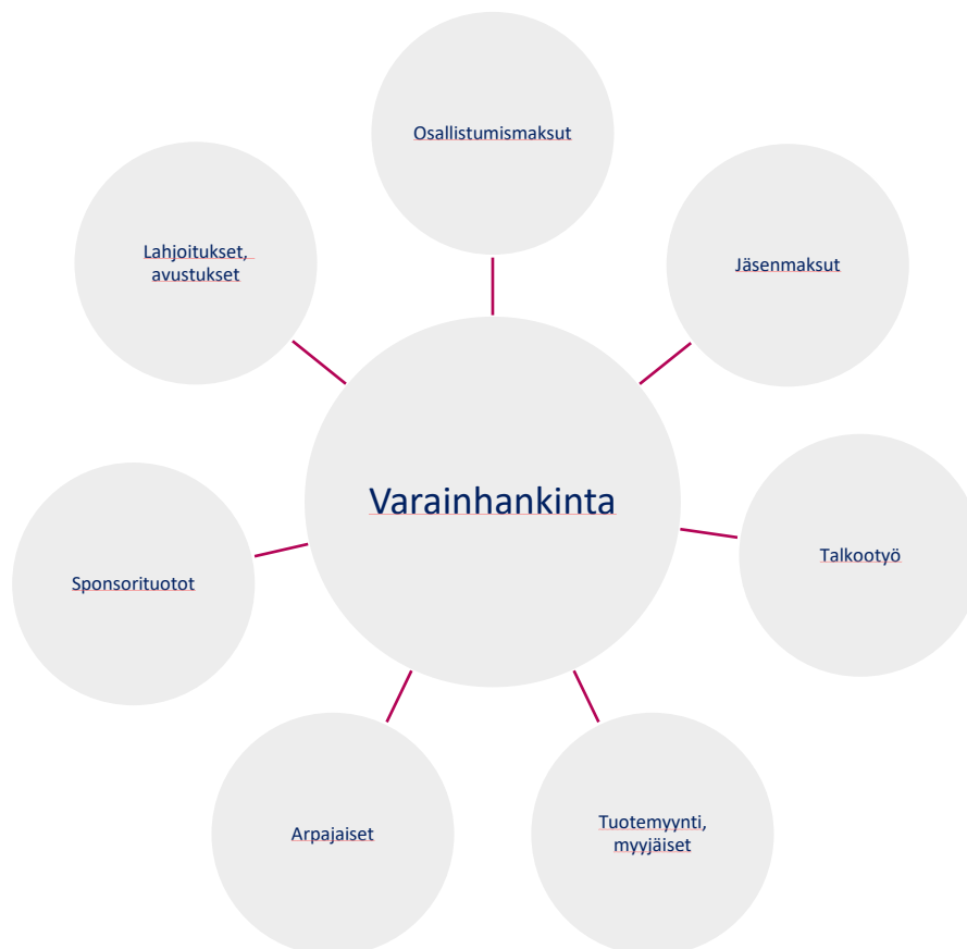
Kuvio 1 Varainhankinnan keinoja urheiluseurassa

(Koski ja Mäenpää 2018, 78.) Kuviossa 1 havainnollistetaan urheiluseuratoiminnan tyypillisiä varainhankinnan muotoja. Tässä opinnäytetyössä perehdytään erityisesti talkootyöhön osana urheiluseuran toiminnan rahoittamista, joten muita keinoja käsitellään seuraavassa vain lyhyesti.