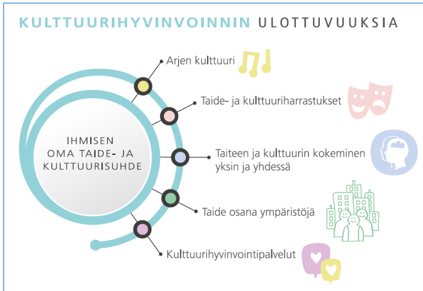
KUVA 1. Kulttuurihyvinvoinnin ulottuvuuksia. (Lilja-Viherlampi & Rosenlöf 2019, 22)

teellisuuden suunnassa. Kulttuurihyvinvoinnin porrasmallissa tämän opinnäytetyön kannalta on keskeistä sen huomioiminen, kuinka juurtunutta kulttuurihyvinvointi on. Kulttuurihyvinvoinnin porrasmallissa toiminta on juurtunutta, kun kulttuurihyvinvoinnin toiminta on pysyvä osa sosiaali- ja terveysalojen toimintaa. (Lilja-Viherlampi 2021, 80–82).