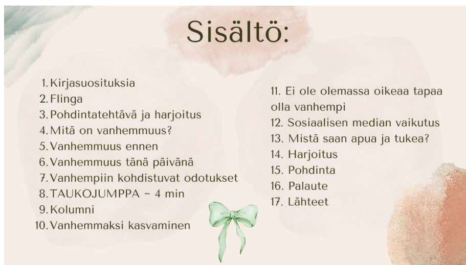
Kuva 1. Etäperhevalmennuksen sisältö

Perhevalmennuksen diaesitykseen tuli lopulta yhteensä 26 diaa, ja valmennuksen kesto oli noin 50 minuuttia. Esityksen tueksi luotu luentomateriaali Word -tiedostossa oli yhteensä 14 sivua. Aiheet, joita valmennuksessa käsitelimme, olivat muun muassa ”mitä on vanhemmuus?”, ”vanhempiin kohdistuvat odotukset” sekä ”vanhemmaksi kasvaminen”. Valmennukseemme sisältyi lisäksi pohdintatehtäviä vanhemmille, kolumni aiheesta ”Riittääkö tavallinen elämä?”, taukojumppa sekä katkelmia Philippa Perryn kirjasta ”Kunpa vanhempasi olisivat lukeneet tämän kirjan”. Halusimme, että kuulija ei olisi täysin passiivinen valmennuksen aikana vaan, että valmennus on myös kuulijoita osallistava. Esityksen lopussa esittelimme myös tahoja, joista vanhempien on mahdollista saada tukea vanhemmuuteen. Etäperhevalmennuksen sisältö on kokonaisuudessaan nähtävillä alla olevassa kuvassa (Kuva 1.).