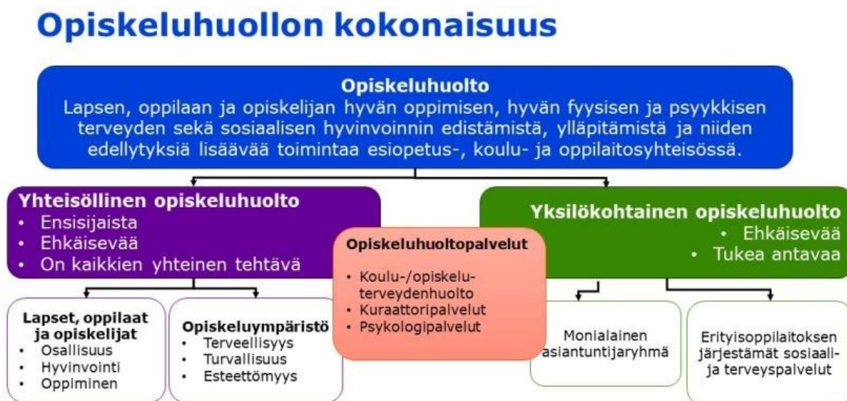
KUVIO1. Opiskeluhoiton kokonaisuus (OPH 2025).

Opiskeluhoito jaetaan yhteisölliseen sekä yksilökohtaiseen opiskeluhoitoon. Yläkäsitteenä toimii opiskeluhoito ja alakäsitteinä yhteisöllinen ja yksilökohtainen opiskeluhoito. Opetushallitus (OPH 2025) on tehnyt opiskeluhoitosta kaavion (KUVIO 1), joka kuvaa opiskeluhoiton kokonaisuutta: