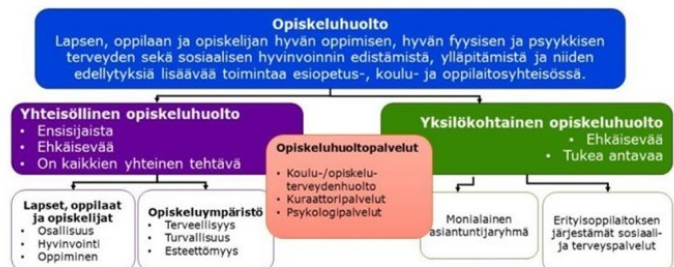
KUVA Opiskeluhoollon kokonaisuus (Opetushallitus 2025).