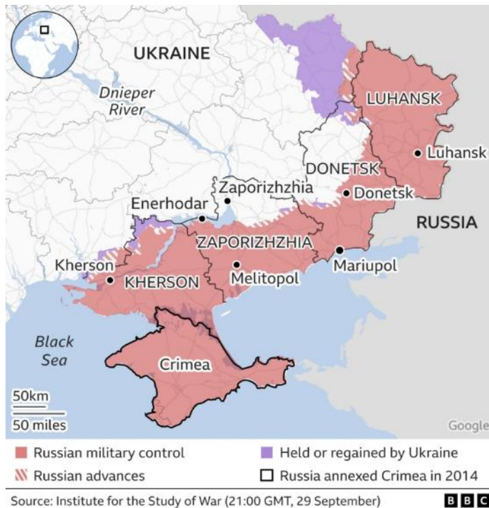
Kuva 1. Invaded parts of Ukraine (BBC 2022. Putin declares four areas of Ukraine as Russian.)

Ukrainan ja Venäjän välisen konfliktin kiihtyessä Euroopan rauhaa, vakautta ja turvallisuutta järkytti lisäksi Malaysian airlinesin lennon MH17 putoaminen taivaalta 17. heinäkuuta 2014. Lento MH17 oli matkalla Amsterdamista Kuala Lumpuriin kunnes sen lento keskeytyi Ukrainassa Donetskin alueella noin 50 kilometrin päässä Ukrainan ja Venäjän rajalta. Kaikki lennolla olleet 283 matkustajaa ja 15 miehistön jäsentä menehtyivät onnettomuudessa. 34 Lento-onnettomuutta tutkimaan perustettiin kansainvälinen tutkintaryhmä Hollannin, Australian, Belgian, Malesian ja Ukrainan toimesta. Tutkintaryhmän mukaan lento MH17 ammuttiin alas Buk-ilmatorjuntajärjestelmällä Venäjän armeijan Kurskin 53. ilmatorjuntaprikaatin toimesta. Venäjä ei ole tutkintaryhmän pyynnöistä huolimatta suostunut avustamaan tutkimusten suorittamisessa eikä luovuttamaan tapauksesta syytettynä olevia Venäjän kansalaisia kansainvälisen oikeuden eteen. 35