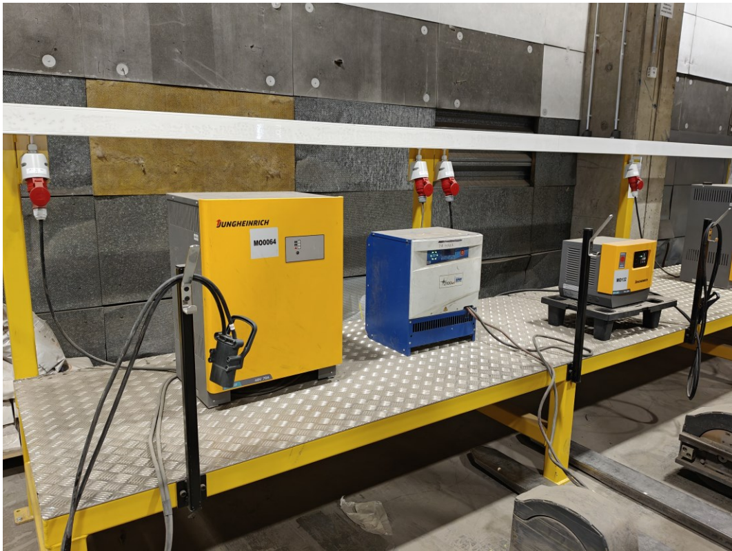
Kuva 4. Esimerkkikuva trukkien latauspisteestä.