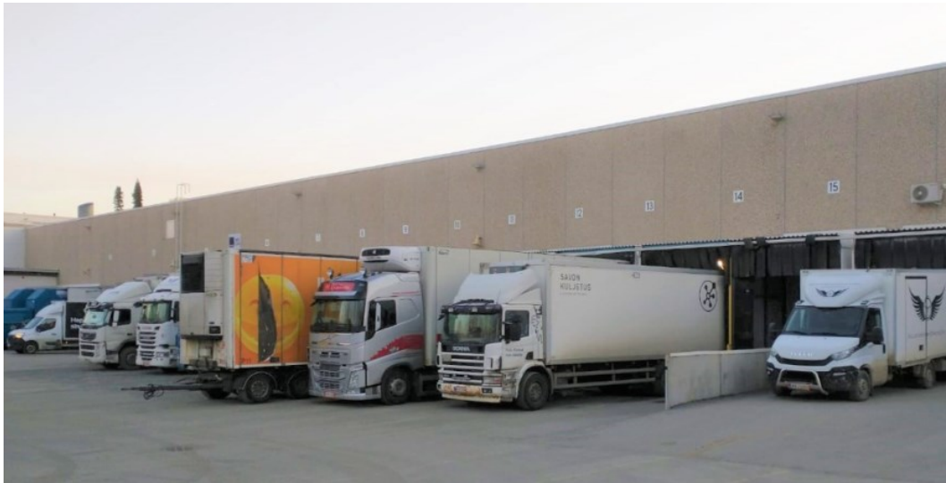
Kuva 1. Maantieliikennekalustoa (Logistiikan maailma, 2024c).

heen kuljetuksissa. Verrattuna muihin kuljetusmuotoihin ne ovat helposti järjestettäviä ja nopeita. Tämän lisäksi ne tarjoavat kätevän ovelta ovelle -kuljetusratkaisun. (Logistiikan maailma, 2024c.)