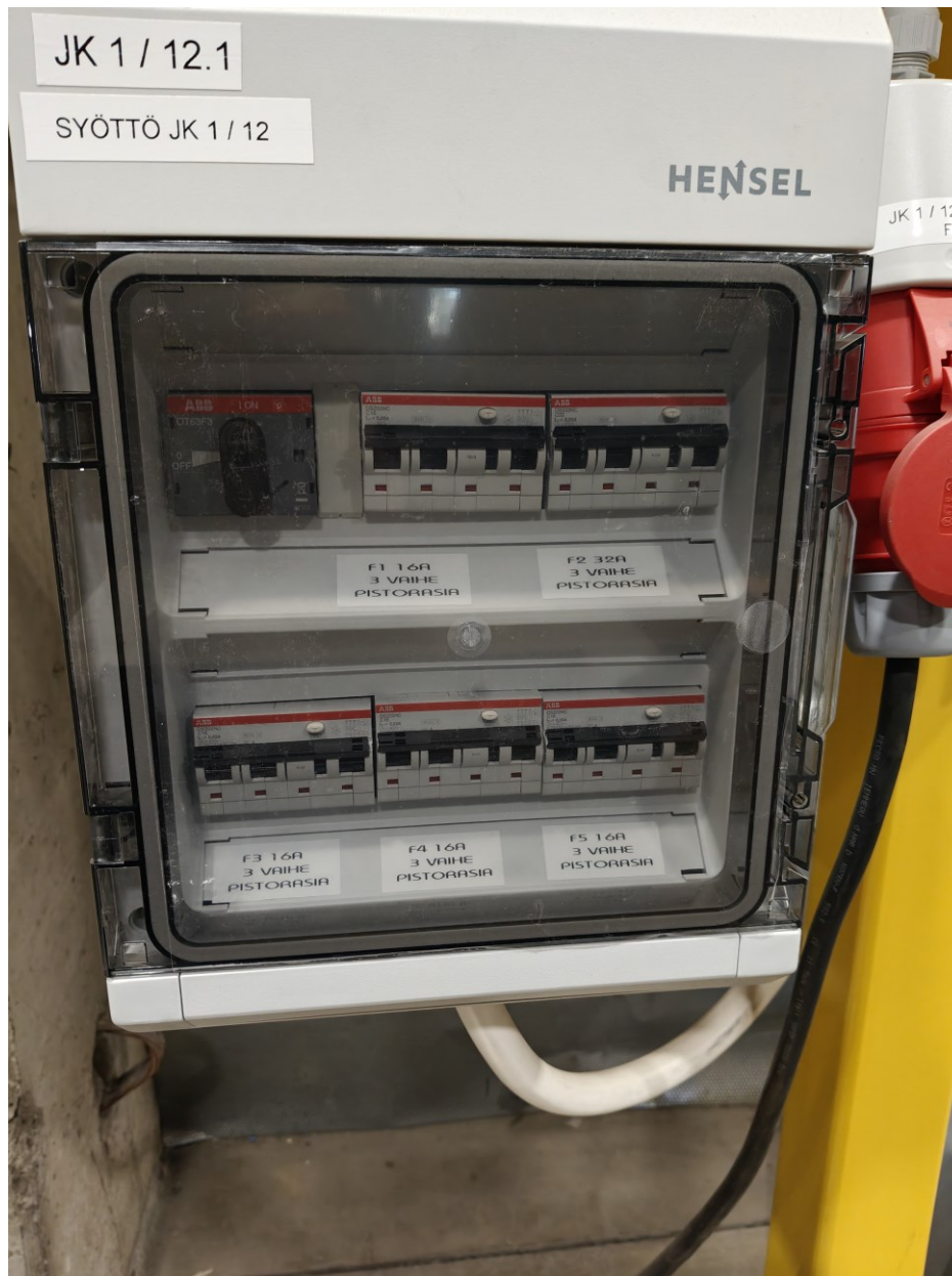
Kuva 6. Esimerkkikuva latauspisteen jakokeskuksesta.

Kuvassa 6 on jakokeskus, joka syöttää varaajien 3-vaihepistorasioita. Keskuksesta löytyy 4 kpl ABB:n 4-napaisia 16A vikavirtajohdonsuojakatkaisijoita sisätrukkien lataamista varten (ABB, n.d.-b.), yksi kpl