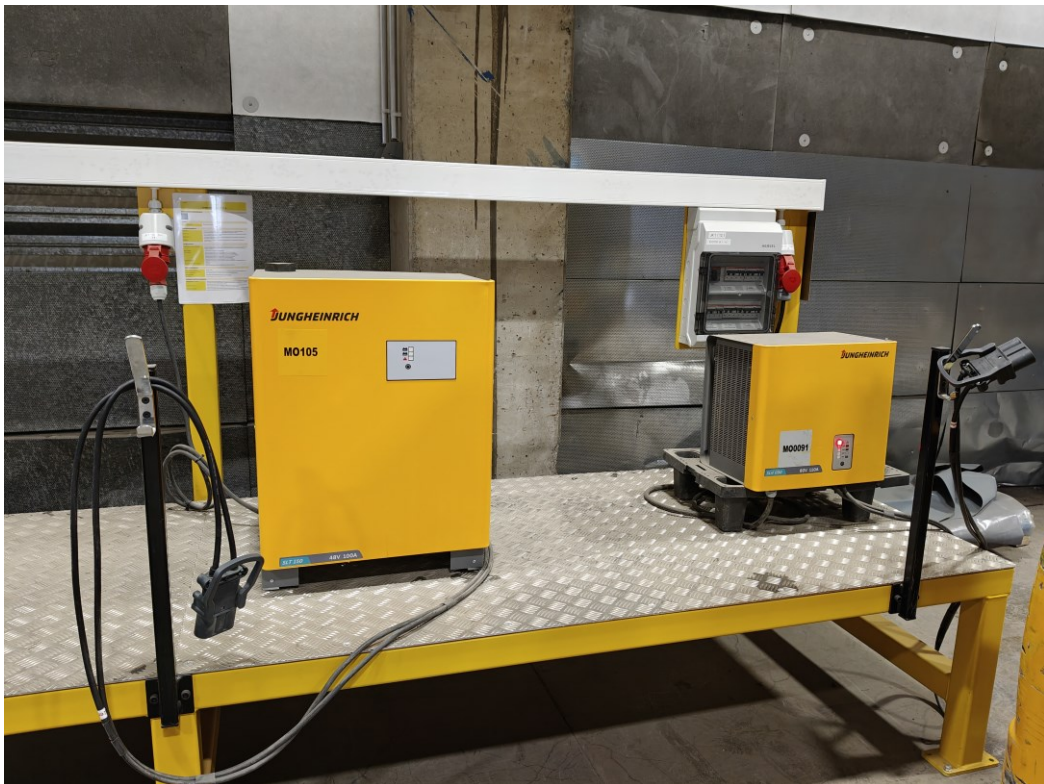
Kuva 5. Esimerkkikuva trukkien latauspisteestä.