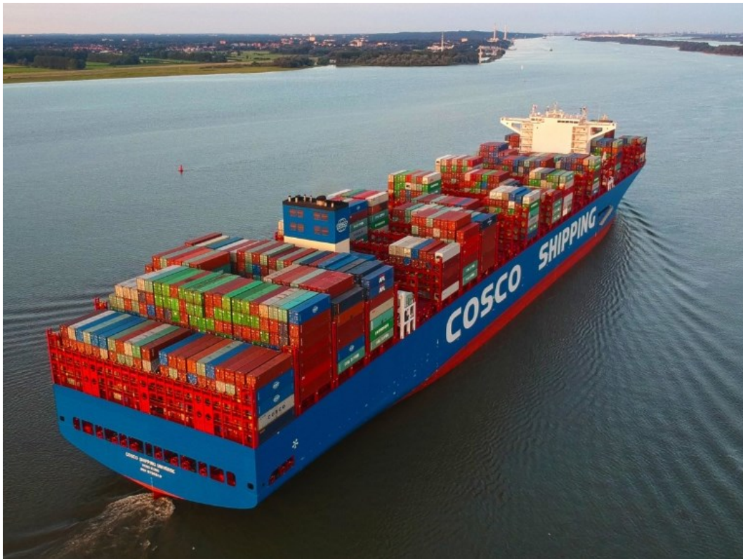
Kuva 2. Merikonttilaiva (konttivuokraus, n.d.).

Lentokuljetuksia hyödynnetään ensisijaisesti silloin, kun halutaan nopeuttaa kuljetusaikaa ja parantaa toiminnan kokonaiskustannustehokkuutta. Tämä kuljetusmuoto on kuitenkin yksikkökustannuksiltaan kallein. (Logistiikan maailma, 2025b.)