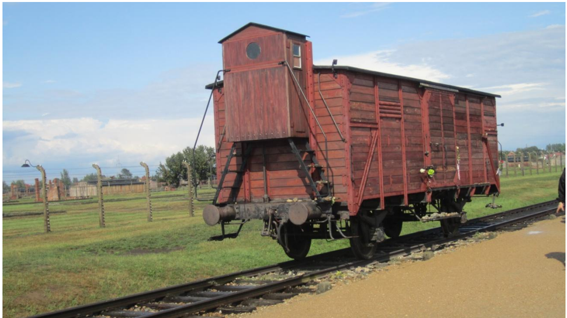
KUVA 7. Karjavaunu, jolla vankeja kuljetettiin leirille

Auschwitz-Birkenausta muodostui varsinainen joukkotuhon keskus vasta vuonna 1943, kun muut keskitys- ja tuhoamisleirit olivat hylätty tai lopetettu. Joukkotuho alkoi Birkenauissa. Vangit kuljetettiin leirille rautateitse ahtaissa karjavaunuissa, joissa matka oli saattanut kestää jopa viikkoja (kuva 7). Työkyyttöömät vangit surmattiin Zyklon B:llä bunkkereissa, jonka jälkeen heidän ruumiinsa hävitettiin krematoriossa, joita Birkenauissa oli lopulta viisi. Birkenauin joukkotuho saavutti huippunsa kesällä 1944. Junalaiturille saapui karsintaan päivittäin lähes 10 000 juutalaisvankia. Muutaman kuukauden aikana leiriin saapui noin 438 000 ihmistä ja heidän murhaamisensa oli yksi suurimmista tuhoamistapaista. (Steinbacher 2004, 101–102, 106, 113–114.)