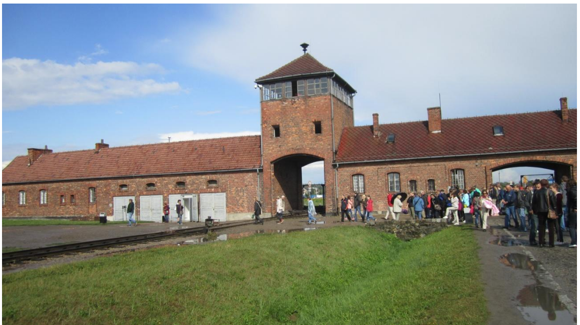
KUVA 6. Birkenauin leirin pääportti

Lokakuussa 1941 Auschwitziin vangittiin noin 10 000 neuvostoliiton sotilasta. Maalis- kuussa jäljellä olevat 945 vankia siirrettiin Birkenauhun. Kyseinen määrä ei kuitenkaan riittänyt leirin työvoimaksi ja kun tämä tajuttiin, Birkenauin leiri muuttui monien proses- sien kautta tuhoamisleiriksi. Vuoden 1943 marraskuussa siitä tuli itsenäinen pääleiri (kuva 6). (Steinbacher 2004, 97, 100.)