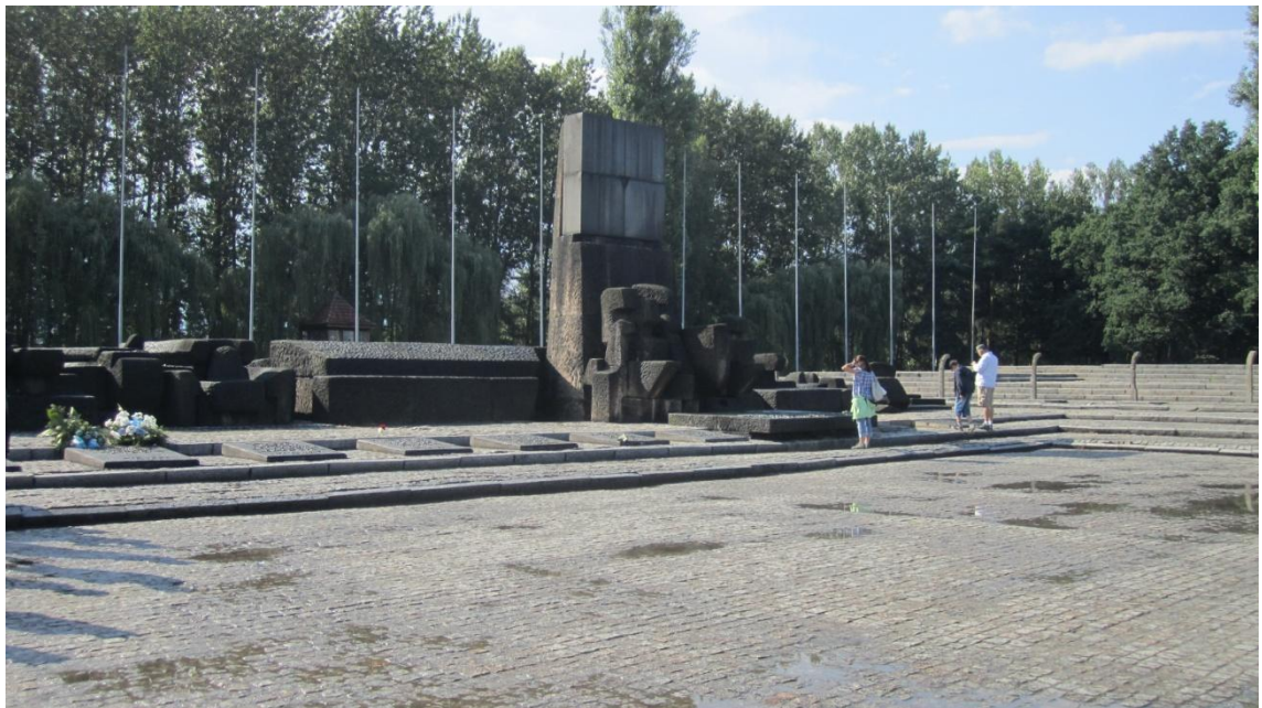
KUVA 1. Auschwitzin joukkotuholeirin muistomerkki Birkenauissa

Toiseen kategoriaan sisältyy vierailut yksittäisten kuolemien tai joukkokuolemien tapahtumapaikoilla. Tämä kattaa useita dark tourismin kohteita, joita ovat esimerkiksi taistelukentät, joukkotuholeirit, kuten Auschwitz, ja kansanmurhien tapahtumapaikat. Samaan kategoriaan sisältyvät myös kuuluisien henkilöiden kuolinpaikat ja muiden kuuluisien murhien tapahtumapaikat. (Stone 2006, 149; Ahola & Tuuha 2012, 12.) Esimerkiksi Englannin prinsessa Dianan kuolinpaikka Pariisissa on monien ihmisten vierailukohde.