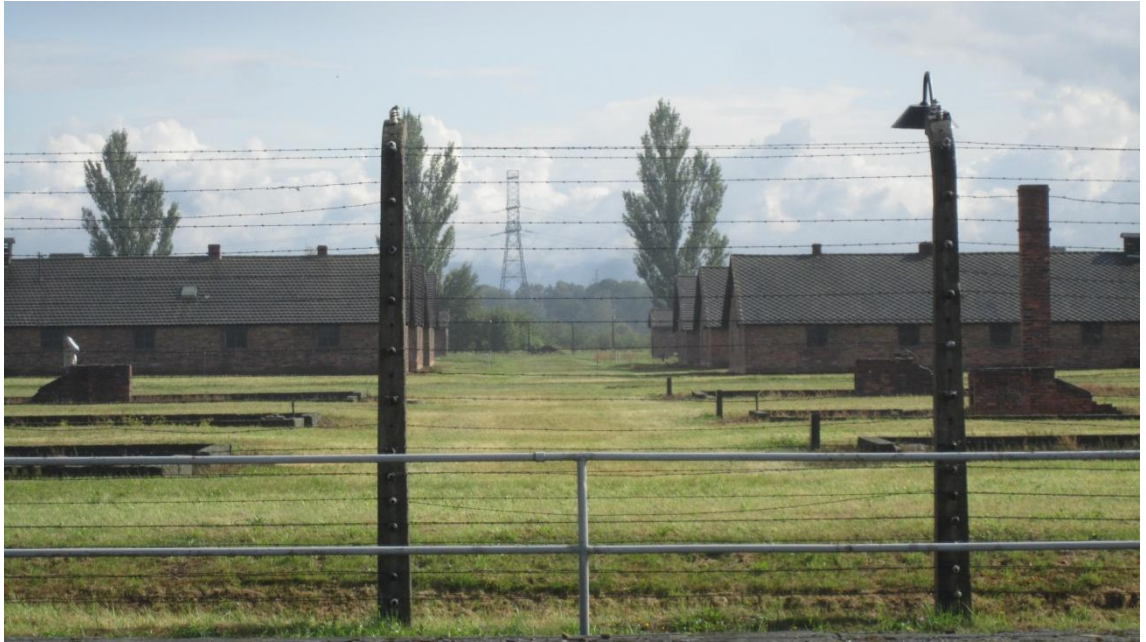
KUVA 5. Birkenauin leirin tiiliparakkeja

tuun parakkeihin sijoitettiin jopa yli 700 vankia. Osa vangeista laitettiin puisiin hevos- talleihin. (Steinbacher 2004, 95–96.)