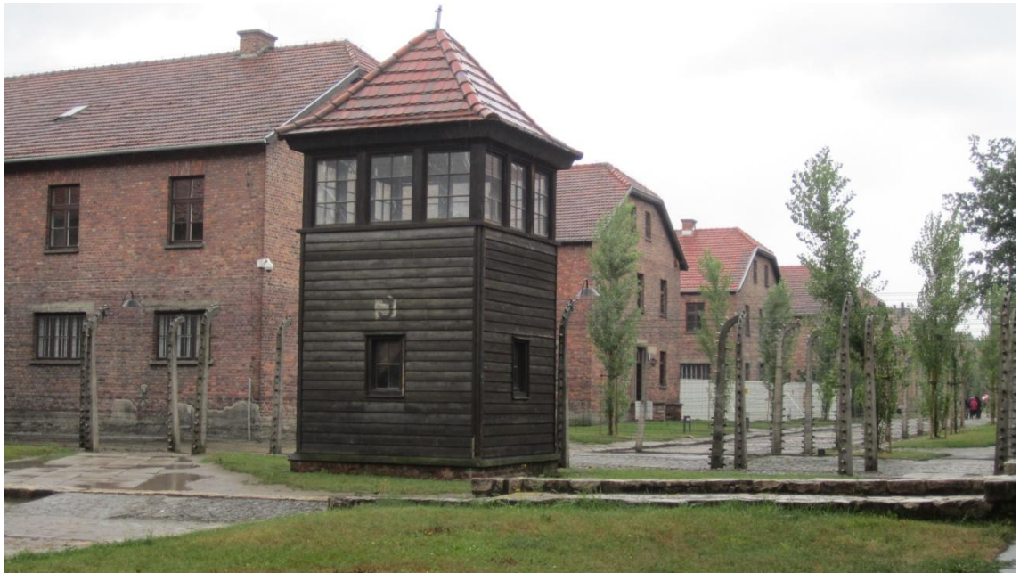
KUVA 4. Yksi leirin vartiotorneista ja kaksirivistä piikkilanka-aitaa (Kuva: Karita Kuusimäki 2012)

Jo rakennusvaiheessa alue ympäröitiin varoituskylteillä, betonimuureilla, vartiotorneilla ja kaksirivisillä, sähköistetyillä piikkilanka-aidoilla (kuva 4), jotka oli valaistu öisin (Steinbacher 2004, 34).