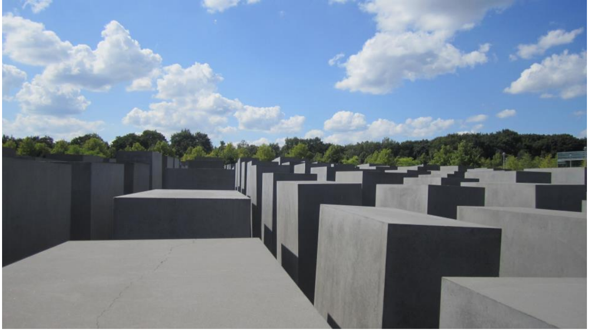
KUVA 2. Holokaustin muistomerkki Berliinissä (Kuva: Karita Kuusimäki 2012)

Kolmanteen dark tourismin lajikategoriaan kuuluu vierailut hautapaikoilla ja muistomerkeillä. Tähän kategoriaan lasketaan hautausmaat, kryptat eli hautaholvit, hautamuistomerkit ja sotamuistomerkit. (Stone 2006, 149; Ahola & Tuuha 2012, 12.) Esimerkkejä muistomerkeistä ovat Auschwitzin joukkotuholeirin muistomerkki Birkenauissa (kuva 1) ja Holokaustin muistomerkki Berliinissä (kuva 2).