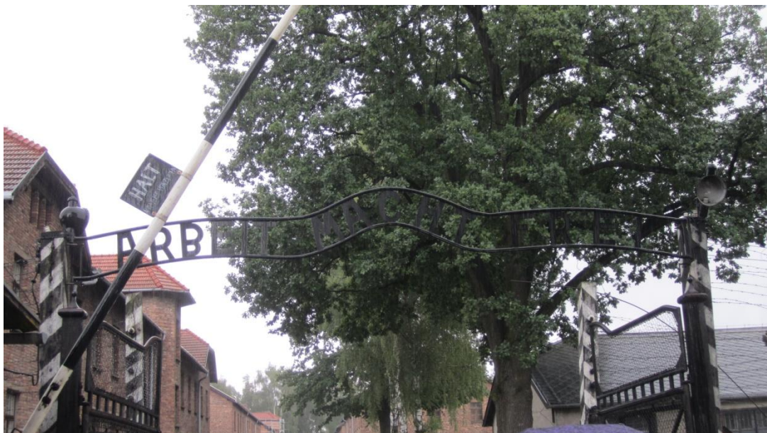
KUVA 3. Auschwitzin ”arbeit macht frei”-kyltti