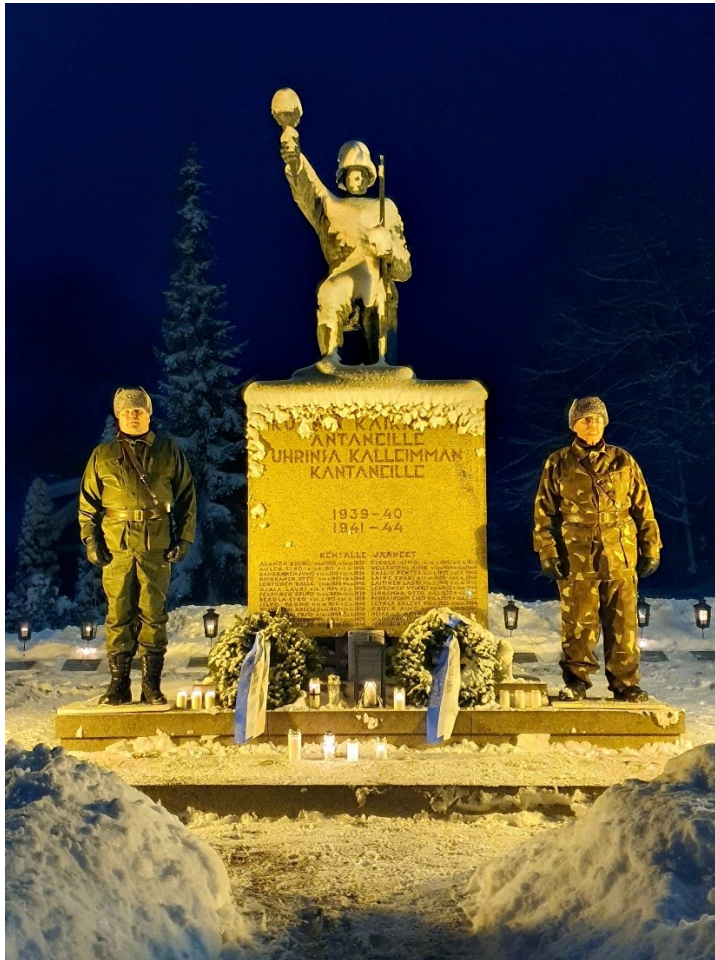
Kuva 2. Sankaripatsas Vesilahden hautausmaalla.