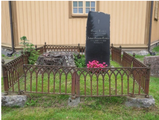
Kuva 7. Seurakunnan istuttama ja hoitama hauta.

Kaikki omaiset eivät hoida hautoja itse tai tekemällä hoitosopimuksia. Nurmikko leikataan kuitenkin kaikilta haudoilta, ja muistomerkkien taustat siistitään siimaleikkurilla. Näin hautausmaan yleisilme ei kärsi liikaa. Hautausmaan yleisiä alueita ylläpidetään verovaroin, joiden pienentyminen aiheuttaa riittämättömyyttä työntekijöiden palkkauksessa.