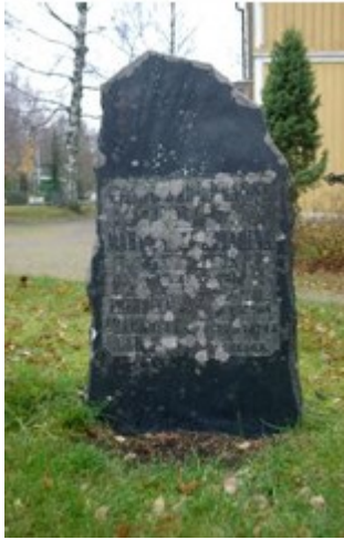
Kuva 1. Hautamuistomerkki Vesilahden hautausmaalla vuodelta 1822.

1800-luvulta löytyy mainintoja puiden istuttamisesta hautausmaille. Myös hautoja alettiin koristaa kukkaistutuksin esim. kehäkukilla, päivänkakkaroilla ja daalioilla. 1900-luvun alussa hautakummuille alettiin kylvää nurmea tai mätästäviä monivuotisia kasveja. Helppohoitoisuutta kaipaavia ohjeistettiin kehystämään hauta kivillä ja täyttämään kehys hiekalla. Haudoille istutettiin myös pensaita. Yksivuotisten kasvien käyttö hautaistutuksissa vakiintui vasta 1900-luvun loppupuolella. Begonia, verenpisara, pelargoni ja ruusu pitävät pintansa edelleen hautaistutuksissa. (Hautausmaiden ryhmäkasvien mahdolliset korvaajat)