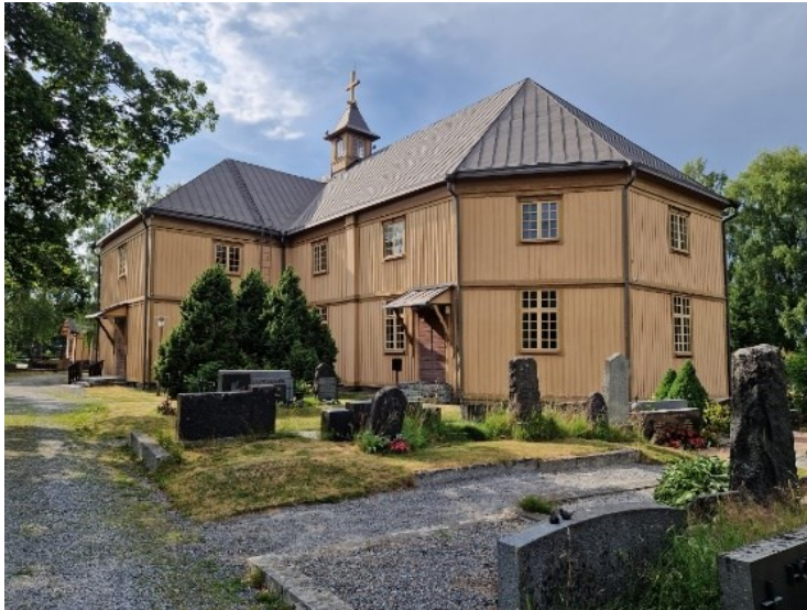
Kuva 4. Vesilahden sankarihaudat ja sankaripatsas.