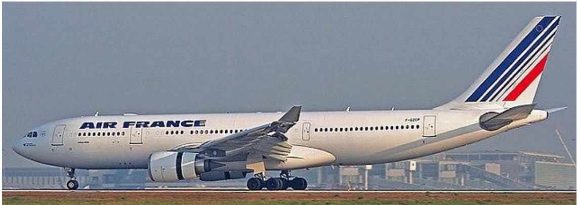
Kuva 1. Turmakone Airbus A330-203, rekisteritunnus F-GZCP (Kierzkowski 2007)

Sunnuntaina 31.5. 2009 ilta kahdeksalta paikallista Brasilian aikaa (22:00 UTC) Air France 447 aloitti matkansa Rio de Janeirosta kohti Ranskan Pariisia. Lentokone on tyypiltään A330-203 (kuva 1) kyydissään kolme lentäjää, yhdeksän matkustajahenkilökuntaa, sekä 216 matkustajaa. (BEA 2012, 21.)