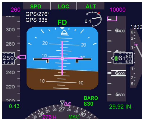
Kuva 4 Lennohjausjärjestelmän korkeutta ja kallistusta ohjeistavat palkit näkyvissä keskellä PFD-näyttöä. (Wikimedia Commons 2018)

Lennohjausjärjestelmä katoaa näkyvistä automaattisesti, jos taustadataa ei ole riittävästi tai se on ristiriitaista. Se voi kadota tai vaihtaa tilaa, jos nopeus, korkeus tai kulmat ylittävät määritetyt rajat. Jos se palaa näkyviin, se jatkaa toimintaansa ohjastaen pitämään nykyistä pystynopeutta ja suuntaa. Air France 447-tapauksessa lennohjausjärjestelmä katosi nopeusmittaustietojen ristiriidan ja autopilotin poiskytketymisen vuoksi. Se palasi hetkellisesti, mutta ei antanut luotettavaa ohjausta, eikä ole selvää, yrittivätkö pilotit seurata sitä. (Palmer 2013, 103.)