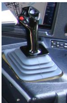
Kuva 3 Airbus sidestick-ohjassauva

Airbus käyttää ohjauksessa sidestick-tyyppistä ohjassauvaa (kuva 3) perinteisen ohjauspyörän sijaan. Nämä ohjaamon sivuilla sijaitsevat ohjassauvat eivät ole mekaanisesti toisiinsa kytketyt, eivätkä liiku toisen mukana. Tämä aiheuttaa haasteita, koska lentäjät eivät näe tai tunne toistensa ohjausliikkeitä lennon aikana. Jos molemmat tekevät samanaikaisia liikkeitä, ohjaukset summataan, mikä voi johtaa ristiriitaisiin komentoihin ilman näkyvää vaikutusta koneen käyttäytymiseen. (Palmer, 86–87.)