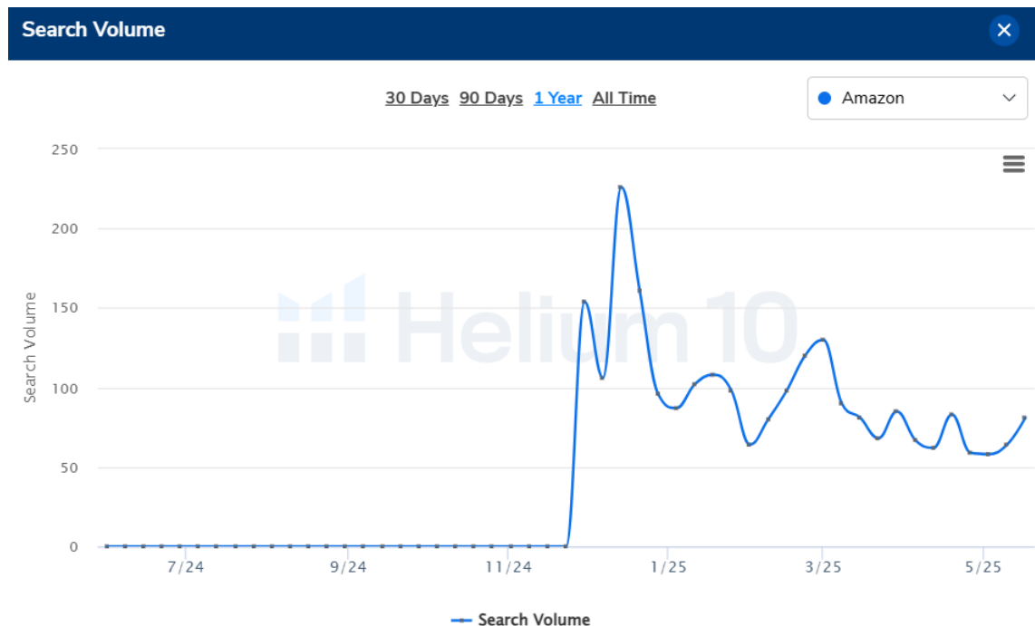
Kuva 4. Hakutermin vegane handcreme kuukausittaiset hakuvolyymit Amazon.de-alustalla (5/2024–5/2025).

Kuvassa 4 havainnollistetaan hakutermin "vegane handcreme" kuukausittainen kehitys tarkastelujaksolla.