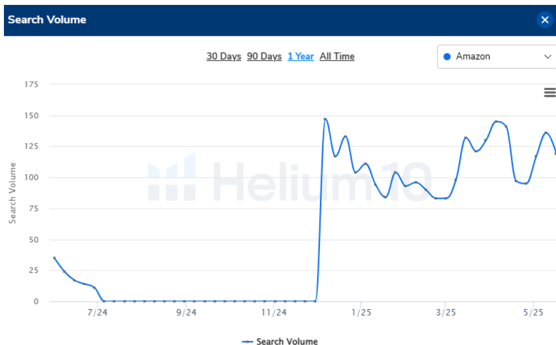
Kuva 5. Hakutermin naturkosmetik handcreme kuukausittaiset hakuvolyymit Amazon.de-alustalla (5/2024–5/2025). Lähde: Helium 10, 2025.

Kuva 5 näyttää hakutermin "naturkosmetik handcreme" hakuvolyymien kehityksen vuoden ajalta.