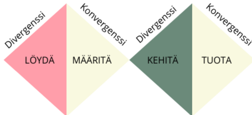
Kuva 1. Tuplatimanttiprosessimalli, British Design Council.

Saadakseni perspektiiviä omalle osaamiselle ja ammattilaisuudelleni sekä hahmottaakseni miten asemoidun kulttuuri- ja hyvinvointikentällä, päätin käyttää benchmarkkausta yhtenä tutkimusmenetelmänä. Benchmarkkaamalla tutkin ja analysoin alan toimijoita, miten he tuovat esiin omaa osaamistaan ja toimintaansa sekä millaisia hyviä käytänteitä he ovat luoneet.