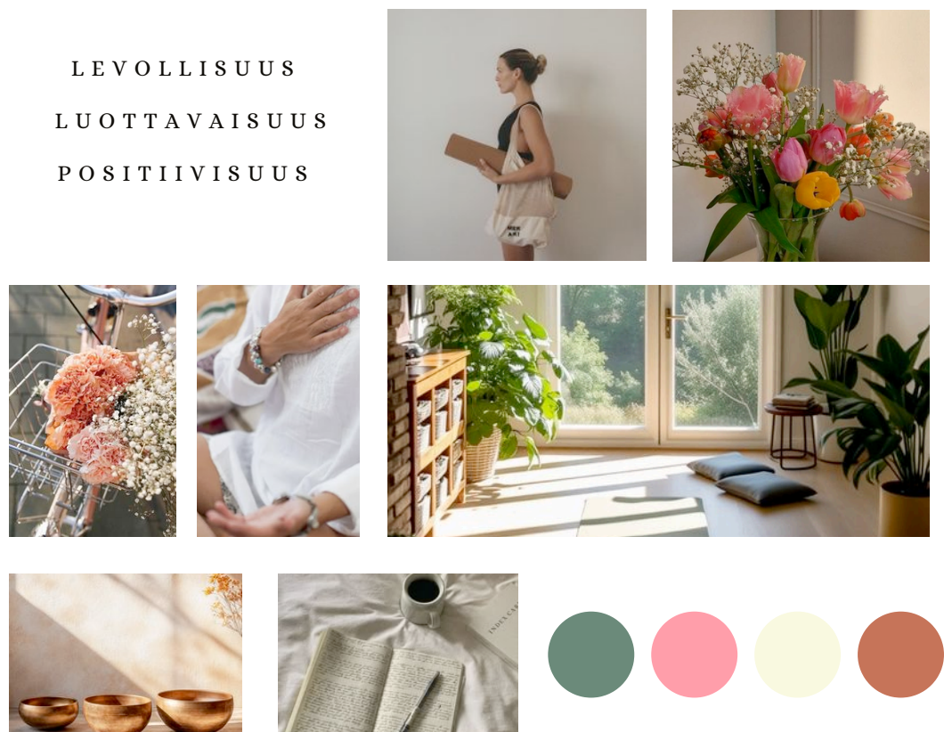
Kuva 2. Visuaalisen ilmeen moodboard.

Näiden sanojen pohjalta valitsin ydinviestiini mielestäni sopivia kuvia, sekä brändivärit, joita tulen käyttämään visuaalisessa viestinnässä. Rakensin visuaalisesta ilmeestä alla olevan Moodboardin.