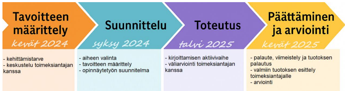
Kuva 1. Opinnäytetyön lineaarinen malli