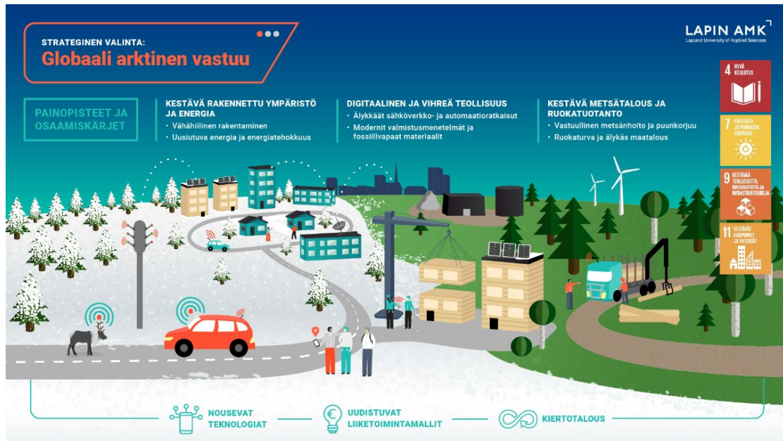
Kuva 1. Lapin AMKin strategisissa valinnoissa näkyy osana poikkileikkaavat vahvuudet: nousevat teknologiat, uudistuvat liiketoimintamallit ja kiertotalous (Lapin AMK 2025).

Strategiatyö poikkileikkaavien vahvuuksien osalta tarkoittaa käytännössä niiden integroimista osaksi koulutusta, TKI-toimintaa ja kumppanuuksia, niin paikallisesti, kansallisesti kuin kansainvälisestikin. Se ei kuitenkaan rajoitu vain näihin, vaan ulottuu myös korkeakouluyhteisön arkeen kuten turvallisiin, hyvinvoiviin ja kestäviin oppimis- ja työympäristöihin sekä yhteisöön, joissa opiskelu ja työnteko ovat merkityksellisiä ja mielekkäitä. Tämän kaiken saavuttaminen edellyttää, että saadaan määriteltyä selkeitä toimenpiteitä, asetettua tavoitteita sekä tarkasteltua vahvuuksia suhteessa korkeakoulun osaamiskärkeen sekä alueellisiin ja kansallisiin ohjelmiin.