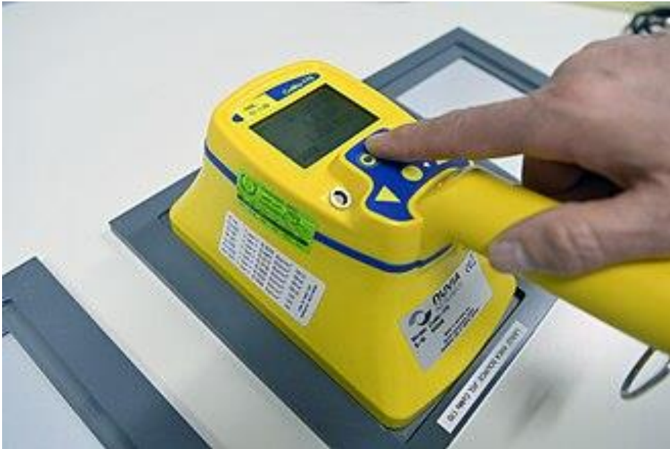
KUVA 2. Pintakontaminaatiomittarin kalibrointia (Calma 2023)

varmistamiseksi. Tällöin kalibrointivaatimus on usein määritelty laadunhallintajärjestelmän dokumentaatioissa tai sovellettavassa standardissa. (33.)