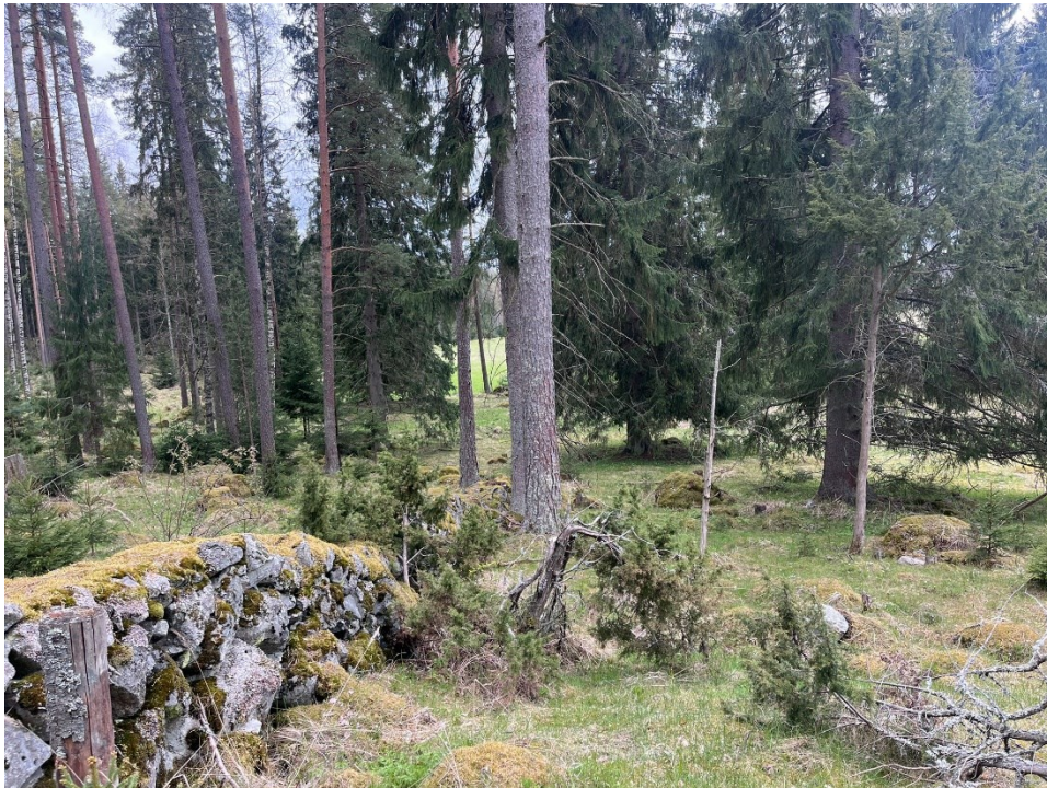
Kuva 4, perinnebiotooppi kotilaidun

Laidunnus itsessään edistää luonnon monimuotoisuutta, kuten myös nurmiviljely. Laiduntavat eläimet estävät mm. alueiden umpeenkasvua ja niiden lanta houkuttelee paikalle eri hyönteisiä, jotka taas toimivat ravintona linnuille. Nurmi taas sitoo hiiltä ja esimerkiksi puna-apila typpeä. Mäkelässä käytetäänkin runsaasti apilan siementä. Tilan laitumet ovat monimuotoisia, lähes joka laitumella on metsää ja hyvin monilla laitumilla on vesistöä, kuten vaikkapa lähde, puro tai joki. Myös vanhoja perinnebiotooppeja löytyy, joita karja laiduntaa edelleen. Yksi näistä löytyy kotilaitumelta, jossa on edelleen näkyvissä vanhaa kiviaitaa. Myös vanhoja rakennuksia on säilytetty, niistä hyötyvät erityisesti hyönteiset ja sammaleet. Tilalla on myös panostettu eri lintulajien pesimisen edistämiseen, pesäputkia ja linnunpönttöjä löytyy tilalta sekä jokaiselta laitumelta useita, ja ne ovat lintujen aktiivisessa käytössä.