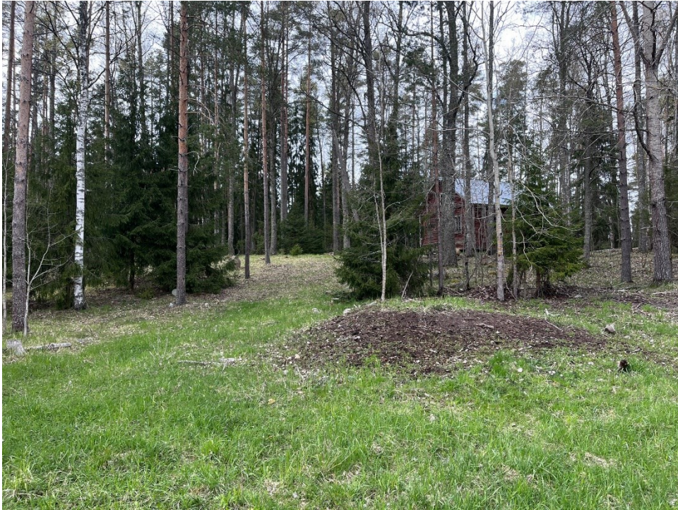
Kuva 6, lähde etälaitumella