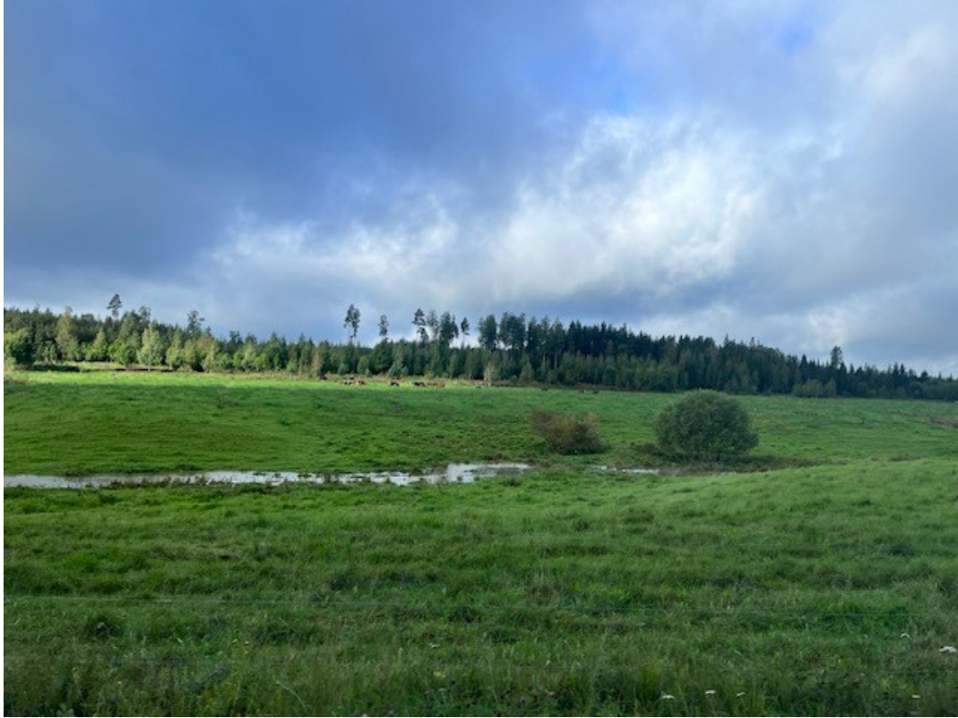
Kuva 1, Kalsun maisemakuva

valmiiksi monimuotoinen ja laaksomainen laiduntavine lehmineen. (Jaakko Mäkelä, henkilökohtainen tiedonanto, 11.4.2025)