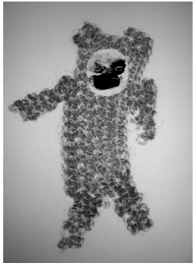
Pupu ja Villamies Monotypia Koot n. 17 x 25 cm 2007