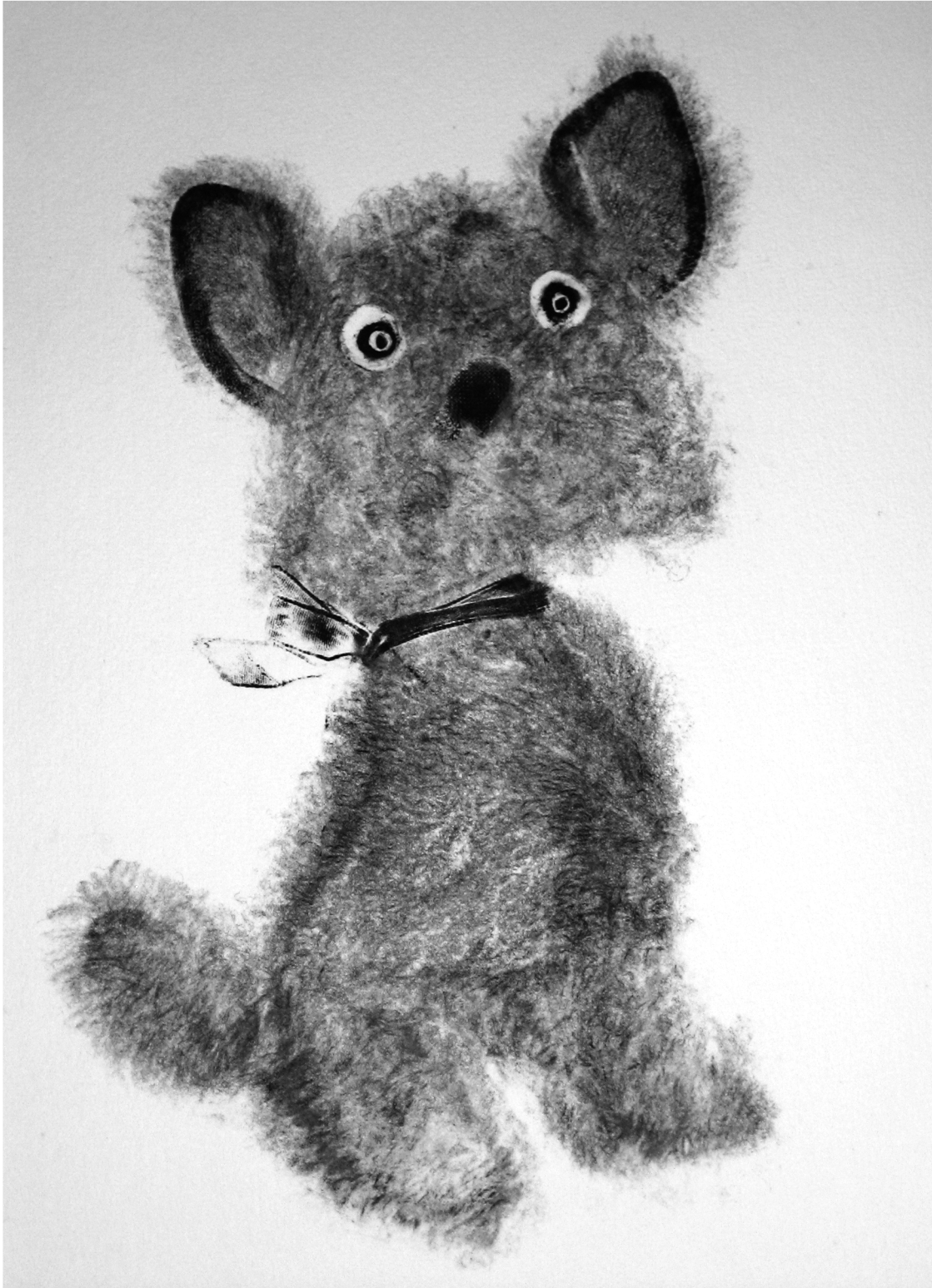
Koira. Monotypia Koko: n. 15 x 20 cm 2007