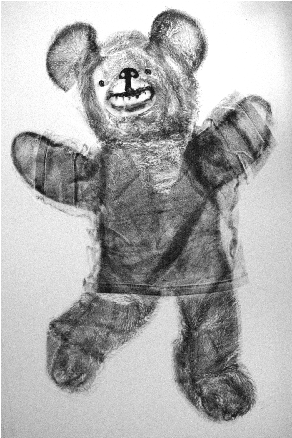
Nalle Monotypia Koko: n 50 x 75 cm 2007