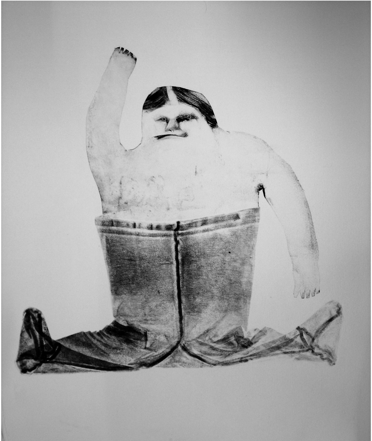
Jumppa Monotypia Koko: n 50 x 75 cm 2007