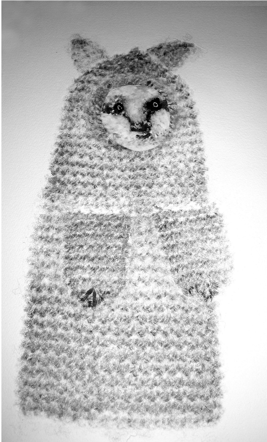
Lammas Monotypia Koko n. 15 x 20 cm 2007