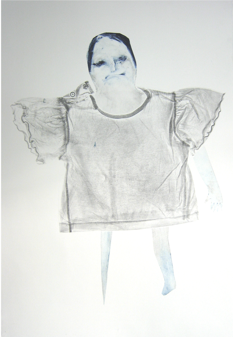
Tyttö Monotypia Koko: n 50 x 75 cm 2007