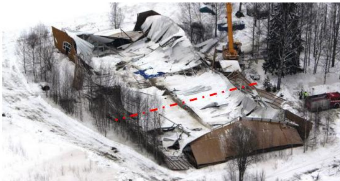
Kuva 3 Laukaan sortunut maneesi [18.]

mutta onnettomuustutkintakeskuksen laatimat tutkimukset osoittavat, että samat ongelmat toistuvat samankaltaisissa hankkeissa.