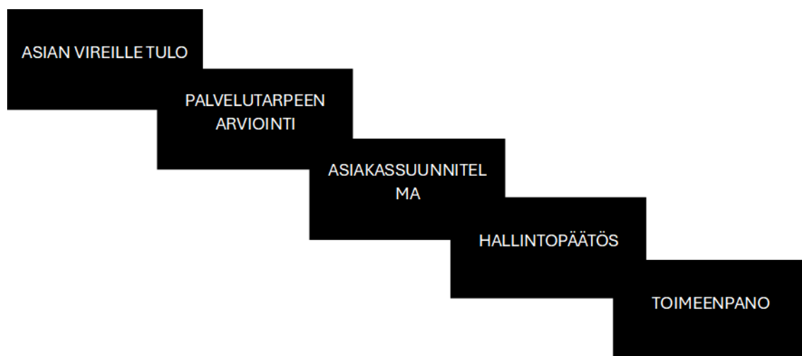
KUVIO 2. Yhteisöllisen asumisen järjestämisen portaikko, mukailten Karppanen n.d.

Valtioneuvoston (2023) tekemän tutkimuksen kuntien ja hyvinvointialueiden toiminnasta ikääntyneiden asumisessa ja asumispalveluissa suositellaan asumisen neuvonnan järjestämistä osana palveluneuvontaa, joka voidaan toteuttaa palvelutarpeen arvioinnin yhteydessä.