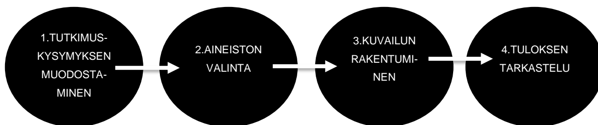
KUVIO 4. Kuvailevan kirjallisuuskatsauksen neljä eri vaihetta (Kangasniemi ym. 2013, 294).

Kuvailevan kirjallisuuskatsauksen ei ajatella tarvittavan sisältää kuvioita tai taulukoita. Kuvioden tai taulukoiden avulla voidaan kuitenkin tiivistää havaintoja, esimerkiksi tiedonhaun suhteen. (Byrne 2016.)