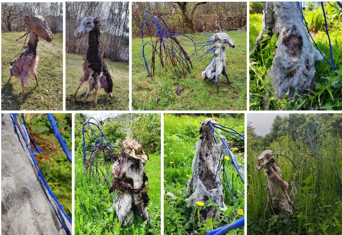
Kuva 9. Kiipijä-teoksen muutokset huhti-kesäkuun 2025 välisenä aikana.

Radikaalein muutos teoksessa oli se, kun yhtenä aamuna havahtuin siihen, että sen kasvot oli raadeltu kauttaaltaan ja sisällä ollut kallo oli paljastettu. Muutoksen tekijä tai tekijät ei ole paljastunut mutta pian tämän jälkeen teoksen selkäpuoli koki myös kovaa kohtelua ja se on raadeltu auki niin, että nurmikon siemenet ovat paljastuneet.