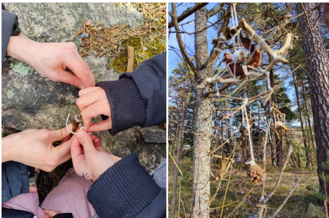
Kuva 16. Metsän silmä -teosten valmistamista.

Mikään ei ole pysyvää – paitsi maailma. (Työpäiväkirja 18.3.2025)