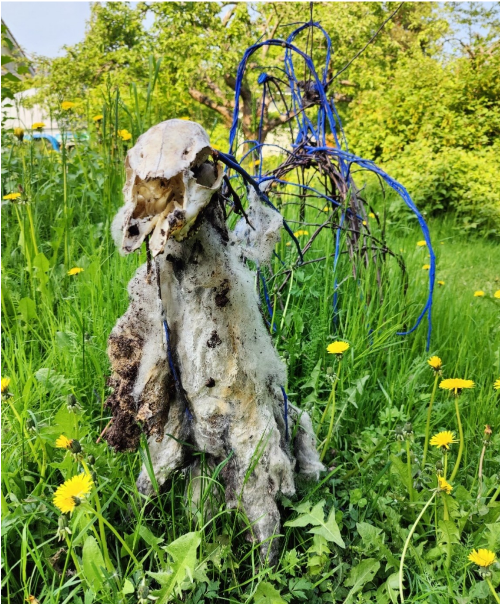
Kuva 10. Kiipijä-teos 4. kesäkuuta 2025

Maatuva taide on syntymän, kuoleman ja elämän kietoutunut juhla. Näkymätön rituaali, jonka väijäämätön läsnäolo on kauhistuttavan kaunis. Voima tulee juurista. (Työpäiväkirja 7.5.2025)