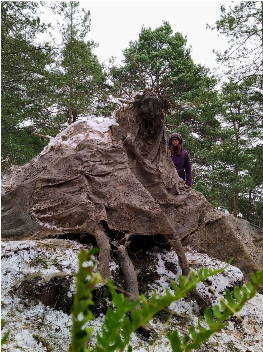
Kuva 13. Valmis Metsän olento -teos.

syksyn aikana yllätin teoksen ääreltä metsässä asuvia oravia, erilaisia lintuja ja hyönteisiä.