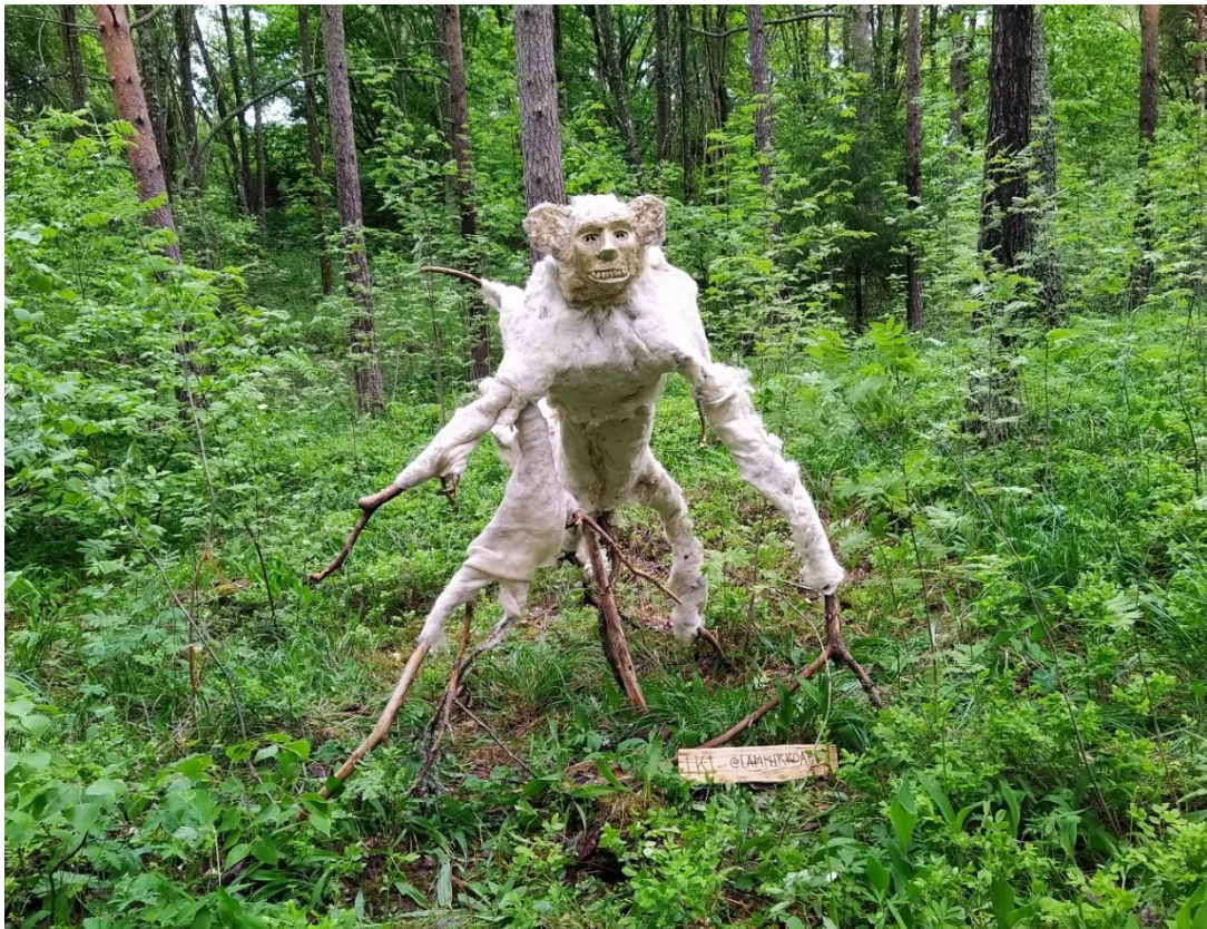
Kuva 4. Yksi IKI-teossarjan teoksista.

Saimme teoksista suoraa palautetta niin kasvatusten kuin sosiaalisen median kautta. Osa palautteesta oli myönteistä ja innostunutta, mutta teokset saivat myös osakseen vandalismia, ja kävimme korjaamassa niitä muutama päivä teosten valmistuttua. Sen jälkeen ne olivat olosuhteiden armoilla siihen asti, kunnes tuntemattomaksi jäänyt taho oli käynyt siivoamassa teokset pois. Tämä herätti ajatuksen siitä, miten paikalliset ihmiset olisi voinut saada enemmän osaksi teoksia, eli olisivatko teokset voineet olla paikkasidonnaisia luonteenlaadultaan? Jos olisimme integroineet alueella asuvia ihmisiä suunnitteluun ja rakentamiseen, niin miten se olisi vaikuttanut niiden vastaanottoon?