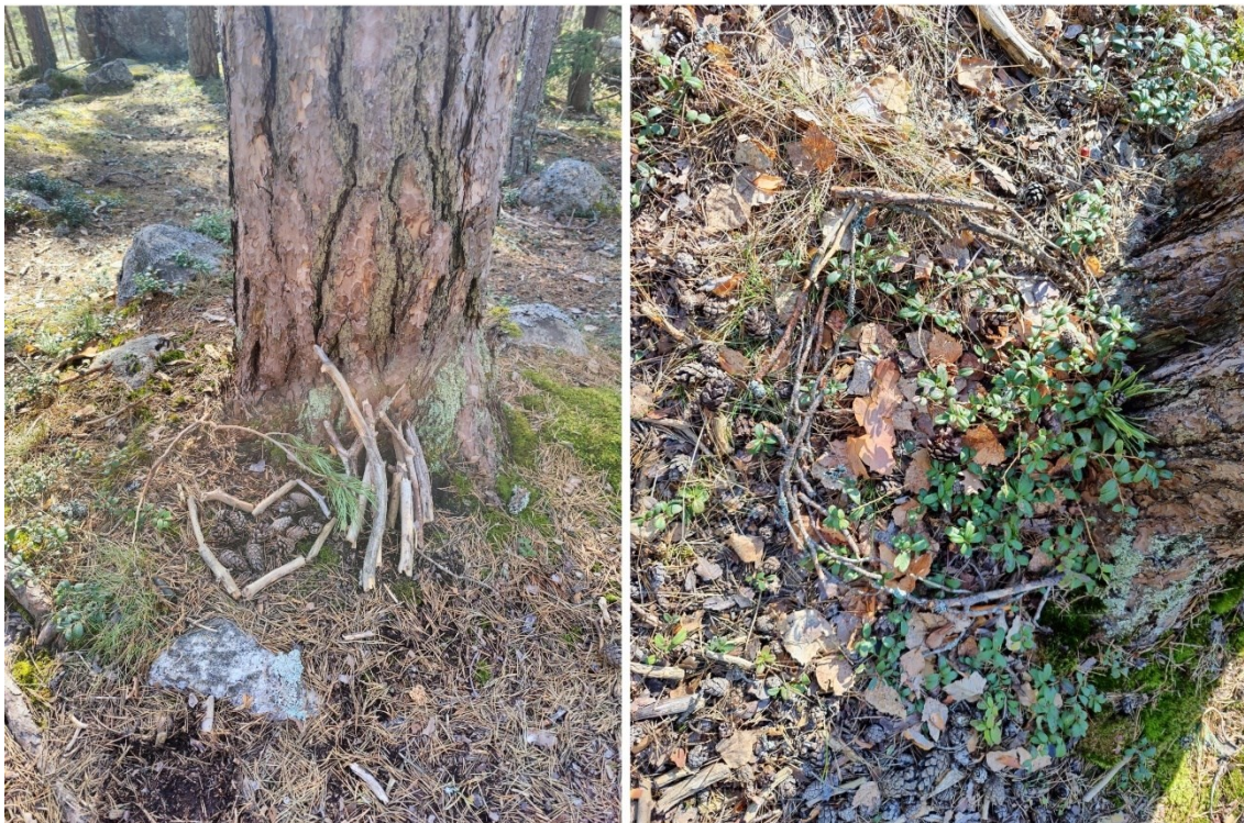
Kuva 18. Osallistujien viestejä Ystäväpuilleen.

sai vuorollaan esitellä teoksen haluamallaan tavalla. Jokaisella osallistujalla oli omalaatuinen tulkinta harjoituksesta mutta pohjimmainen merkitys, eli toisenlaisen yksilön kanssa vietetty yhteinen hetki ja luontosuhteen tutkailu tuntui löytyneen tekemisen kautta ja se oli antoisaa kuulla.