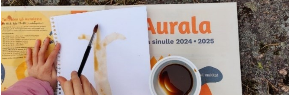
Kuva 17. Kasvivärejä astioissa ja osallistujia maalaamassa metsässä.