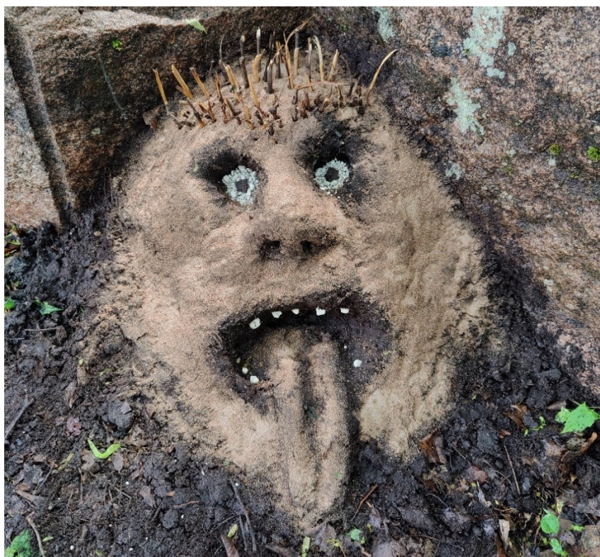
Kuva 15. MinULTA-työpajan teos.

Teokset sijoiteltiin näköetäisyydelle toisistaan, jolloin alueesta muodostui pieni väliaikainen veistospuisto (kuva 16). Teokset koristeltiin paikalta löytyvillä luonnonmateriaaleilla, kuten tippuneilla oksilla, kävyillä ja kivillä. Työpajan toiminta on itsenäistä mutta samalla yhteisöllistä. Työpajan aikana syntyi spontaanisti yhteinen teos osallistujien kesken. MinULTA-työpaja yhdistää erilaiset ja erilaisista lähtökohdista tulevat ihmiset ja antaa heille tilan luoda käsillään jotain yksilöllistä mutta yhteistä. Teokset syntyvät nopeasti, ja osallistujat näkevät oman toimintansa jäljen välittömästi. Teokset jäävät puistoon maatumaan, eli osallistuja voi tarkkailla teoksensa vaikutusta ja sulautumista ympäristöönsä kesän aikana.