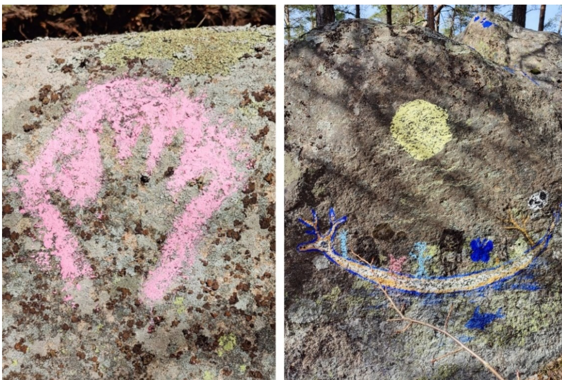
Kuva 19. Yksilömaalauksia ja ryhmän yhteinen maalaus.

Kiipesimme viereiselle kalliolle, etsimme sopivan paikan kalliomaalauksille ja pyysin jokaista miettimään jonkin eläimen tai jotain mitä halusi paikalle toivottaa. Jokainen osallistuja, niin lapsi kuin ohjaaja, osallistuivat tekemiseen maalaten kuvia kallion pinnalle (kuva 21). Aika kului nopeasti kallioiden pinnan peittyessä erilaisin värein ja kuvioin. Kuvia syntyi erilaisista linnuista, kukista ja hyönteisistä. Teimme yhteisen teoksen, jossa olimme kaikki samassa hirvenpäisessä veneessä. Maalasin veneen muodon pystysuoraan kallioon ja jokainen paikalla ollut osallistuja maalasi itsensä sen kyytiin sellaisella symbolilla tai kuvalla kuin halusi.