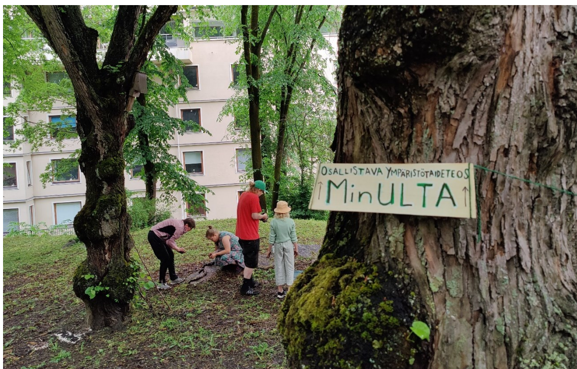
Kuva 14. MinULTA-työpaja Turussa vuonna 2024.

Järjestin suunnittelemani MinULTA-työpajan kesäkuun 2024 alussa. Toiminnaltaan se oli yhteisöllinen ympäristöteos, jossa rakennettiin mullasta ja kasviliisteristä pieniä veistoksia puiston maaperään. MinULTA-työpaja järjestettiin Turun kaupungin keskustassa sijaitsevassa puistossa ja Turun kaupungin kulttuurin kärkihanke rahoitti työpajan toimintaa (kuva 15). Suunnittelin työpajan tarkan lokaation ja vesipisteen käytön yhteistyössä kaupungin viheralueista vastaavien henkilöiden ja lähistöllä olevan kesäteatterin kanssa. Yhteistyöllä pyrin turvaamaan teoksille paikan, jossa ne eivät häiritse puiston hoitoa ja saisivat olla mahdollisimman pitkään niillä sijoillaan. Vesipisteen käytön mahdollisuus lokaation läheisyydessä vähensi huomattavasti paikalle tuotavien materiaalien painolastia. Painolastin minimoiminen oli tarpeellista, sillä kulkuvälineenäni oli polkupyörä ja siihen kiinnitettävä peräkärri. Teosten materiaaleina oli multaa, kasviperäistä liisteriä, savea, kasvikuituja sekä puistosta löytyneitä materiaaleja, esimerkiksi pudonneita oksia ja käpyjä.