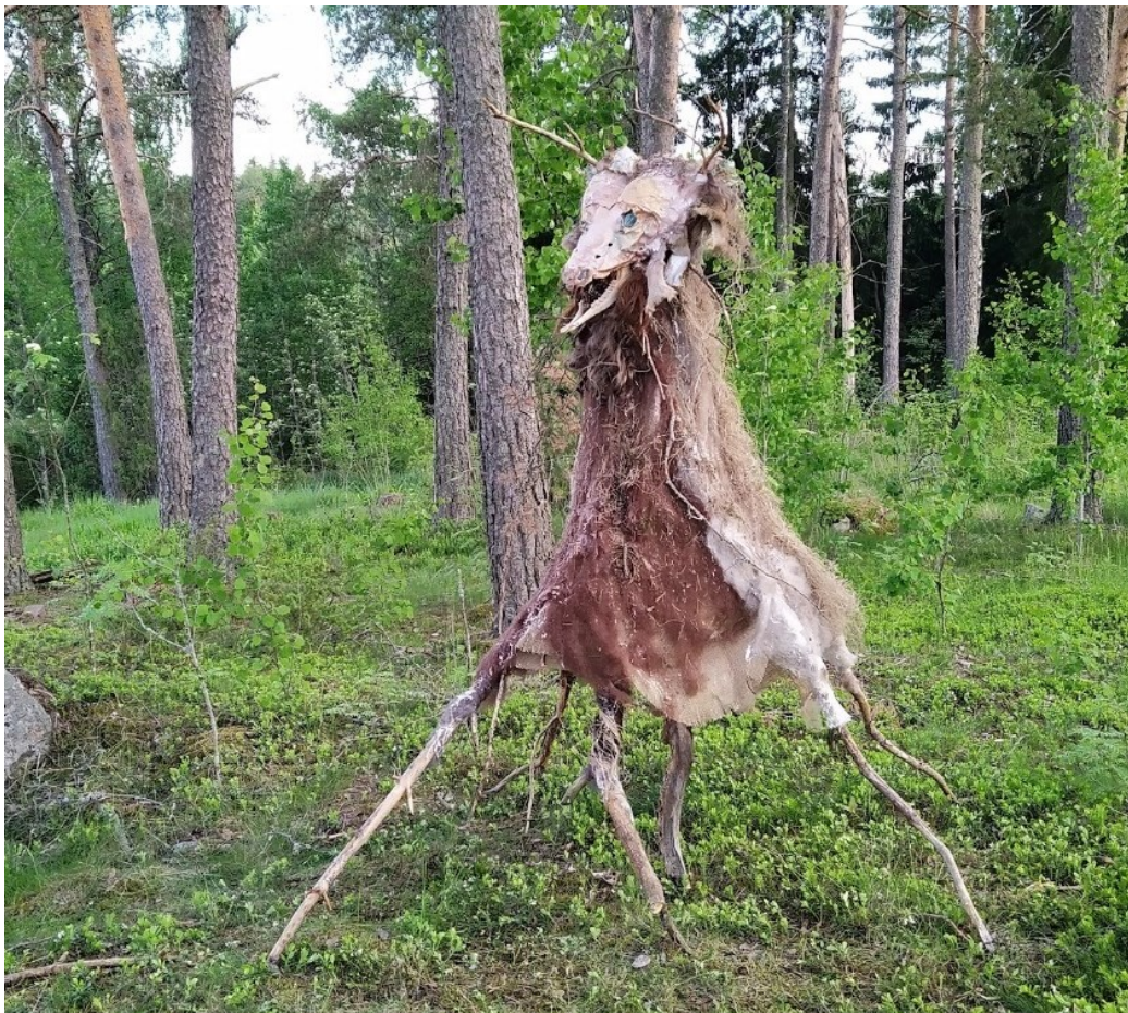
Kuva 2. Ensimmäinen metsäteokseni vuodelta 2020.

pimeämmäksi, ja valoa on löydettävä pienistä asioista. Maatuva taide käsittelee globaaleja, viheliäitä ongelmia, joihin ei ole yksinkertaisia vastauksia. Jokainen voi vaikuttaa ympäristöme hyvinvointiin omalla toiminnallaan, ja se, että osaa käsitellä omaa käyttäytymistään ja omia valintojaan, on äärimmäisen tärkeää.