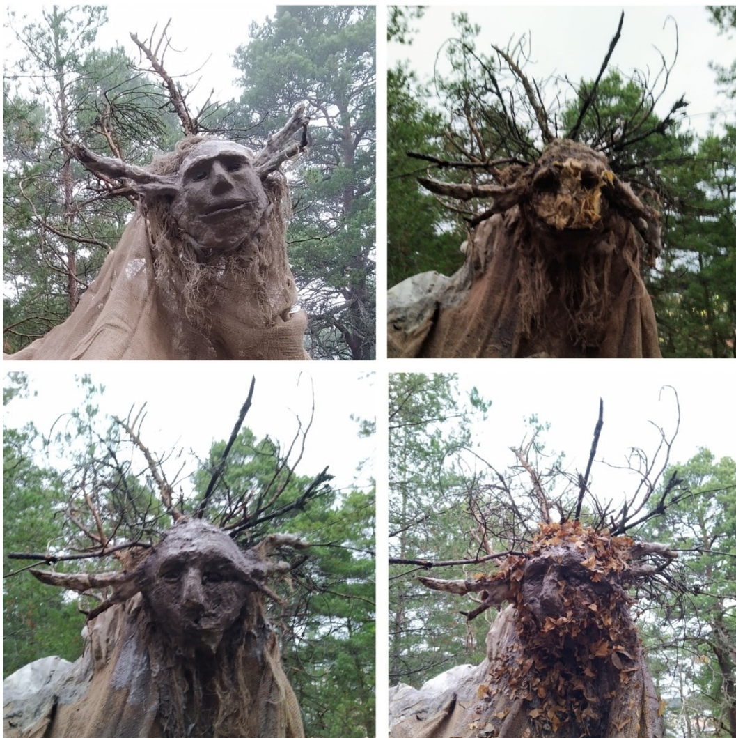
Kuva 12. Metsän olento -teoksen kasvot.

Metsän olento -työpaja oli alkupisteeni, idean siemen, maatuvan taiteen yhteisölliselle työpajakonseptille. Ensimmäistä kertaa vein maatuvan taiteen työpajamallisenä työskentelynä oman taiteellisen työni ulkopuolelle ja jaoin omaa osaamistani muille. Tämän työpajan aikana henkilökohtainen ajatukseni maatuvasta taiteesta ja sen hetkellisestä olomuodosta terävöityi. Työpajaan osallistujat saivat uuden kokemuksen metsäteosten valmistamisesta, ja oma työskentelyni sai korvaamatonta kokemusta praktiikkani johdattamisesta kohti yhteisöllistä konseptia. Työpajan lopuksi sillä hetkellä valmis Metsän olento -teos jäi lumiseen metsään odottamaan talvea (kuva 15) ja ympäristön jatkokäsittelyä. Koko teos valmistui maatuviksi luokitelluista materiaaleista, ja