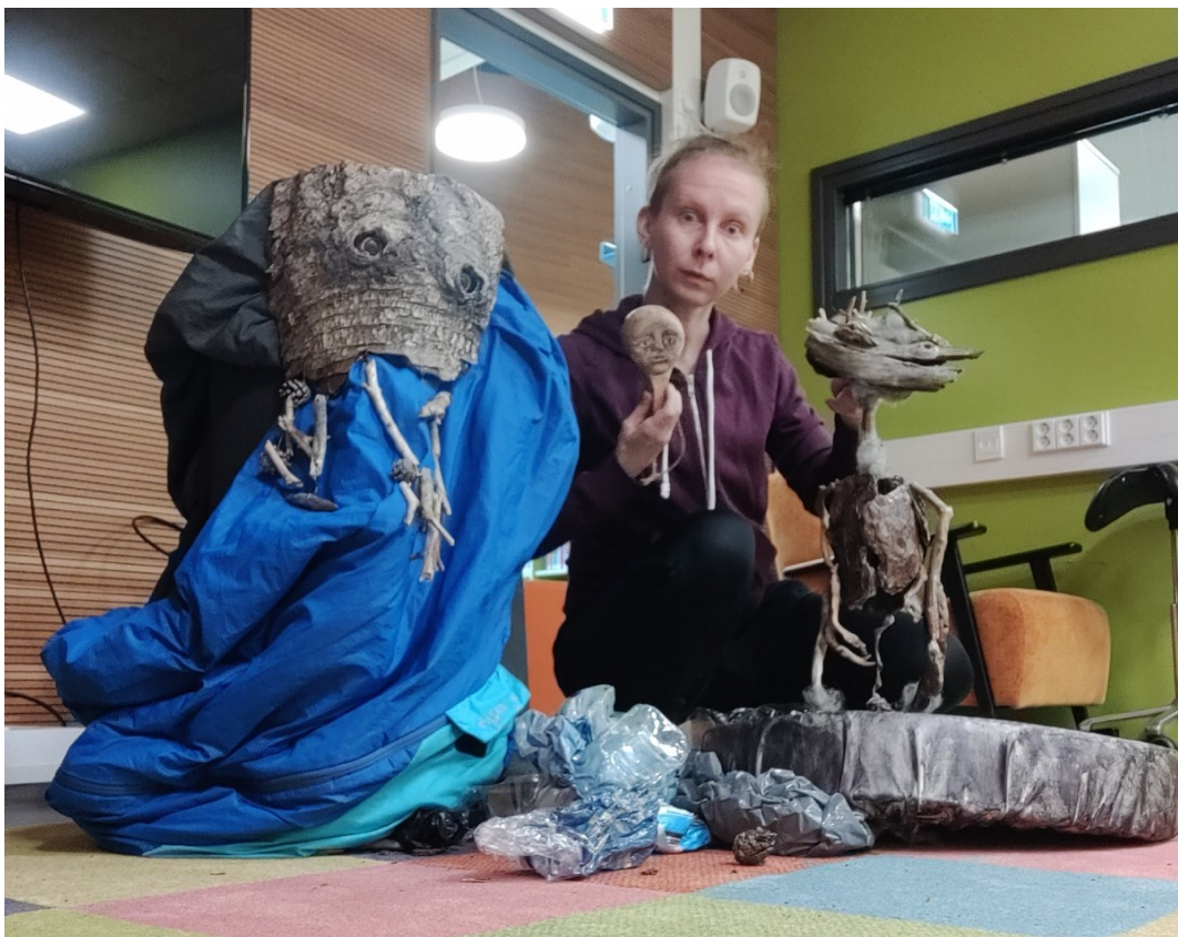
Kuva 7. Nurinkurinen väki metsästä -esityksen esiintyjä, nuket ja lavasteet Aunelan kirjastossa syyskuussa 2024