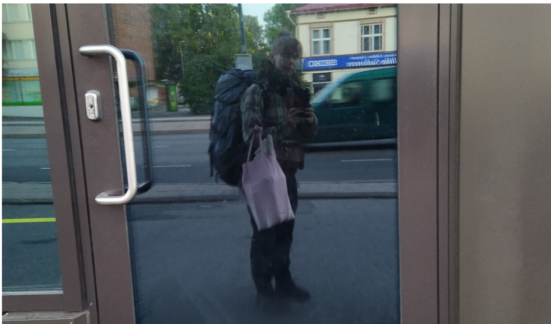
Kuva 11. Matkalla pitämään Metsän olento -työpajaa.

Toteutuneessa Metsän olento -työpajassa kohderyhmänä olivat esi- ja alakouluikäiset lapset. Saatua tietää työpajan lokaation, todellisen aikataulun ja kohderyhmän muokkasin ja terävöitin suunnitelmani heidän tarpeisiinsa sopivaksi. Tilaajan toiveena oli, että koko koulu osallistuisi yhden suuren ympäristötaideteoksen valmistamiseen. Tärkeässä roolissa oli itse tekemisen hetki eli prosessi, oman kädenjäljen näkeminen, taiteen tekemisen loputtomat mahdollisuudet paikasta tai tilanteesta riippumatta ja teoksen jättäminen metsään yleisön nähtäville. Ajatuksena oli, että teokset eivät ole ikuisia, vaan ne muuttavat muotoaan esimerkiksi sään, eläinten ja hajoamisen myötä. Työpajakerroilla käytiin läpi ja keskusteltiin yhdessä aiheesta, mikä on mahdollisesti metsälle, eli luonnonympäristölle, hyvää ja mikä ei. Työpaja huipentui siihen, kun suuri koko koulun yhteinen metsätaideteos valmistui metsään. Työpajan jälkeen oppilaat pystyivät seuraamaan, miten teos muuttui erilaisten ympäristötekijöiden vaikutuksesta.