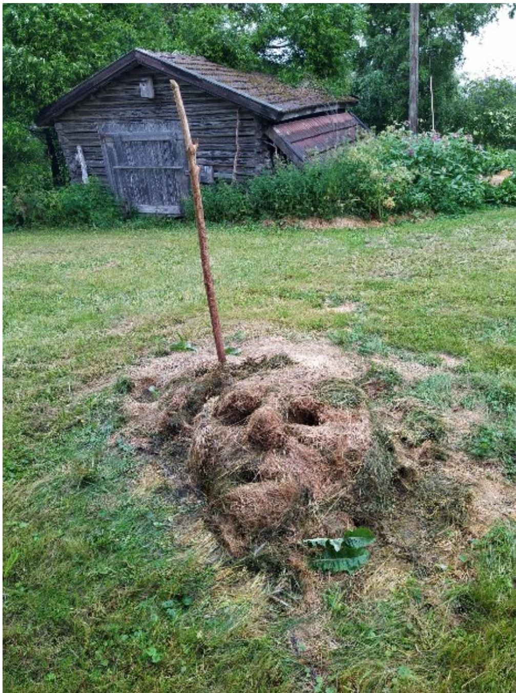
Kuva 3. Puutarhajätteestä syntynyt teos.

luontoa ruokkii monilajista yhteistyötä, ja tuloksena voi syntyä kaikkia alueella asuvia elonkirjon jäseniä palvelevia tekoja (kuva 3).