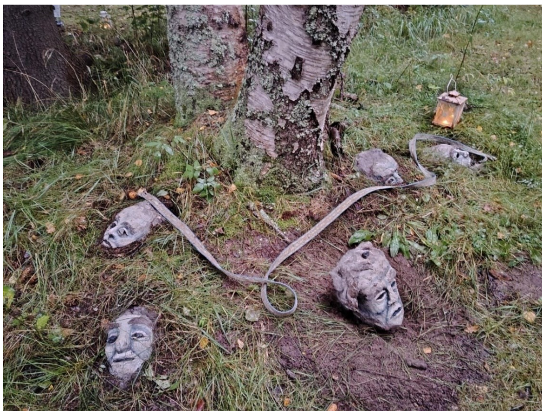
Kuva 6. Lammikko-työryhmän Elonkulku-teoksen maahan jäävä installaatio Porissa.

tilaan tehtyjen teosten kautta on antanut ymmärryksen siitä, miten suuri merkitys teoksen paikalla, rakentumisella ja purkamisella on. Ulkotilassa, jossa teoksen rakentumista ja purkamista on mahdollista seurata, on aina mukana myös performatiivinen väre. Teoksen prosessin näkeminen vaikuttaa ympäristöönsä ja herättää kiinnostusta sekä keskustelua alueella liikkujissa.