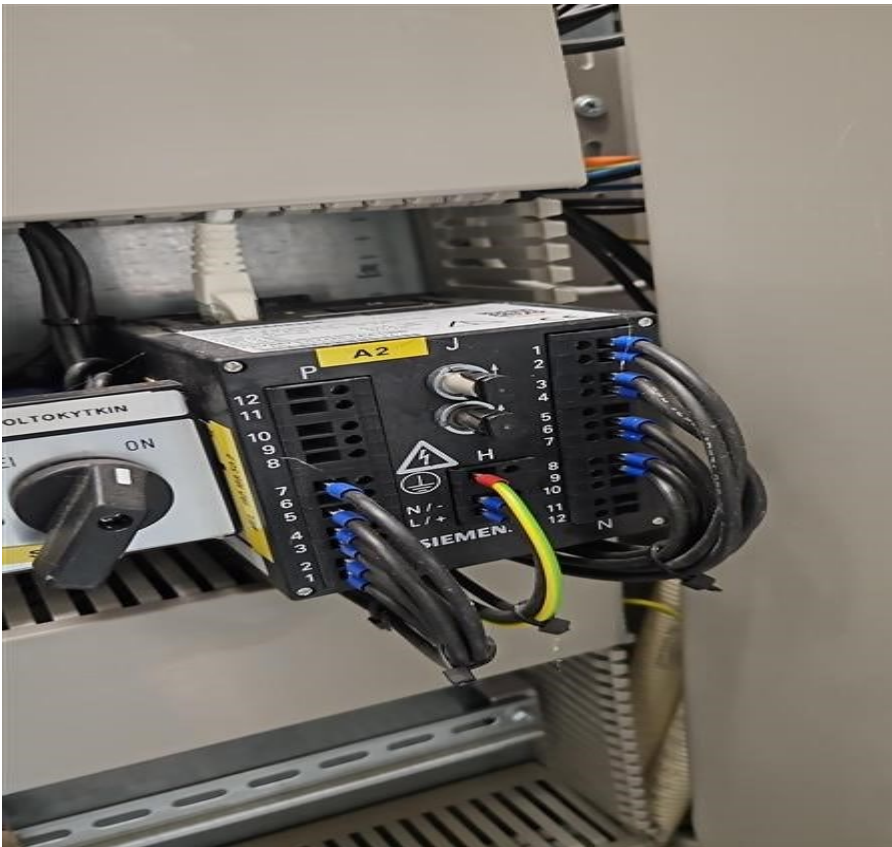
Kuvio 4. Siemens EVY, laitekuva.