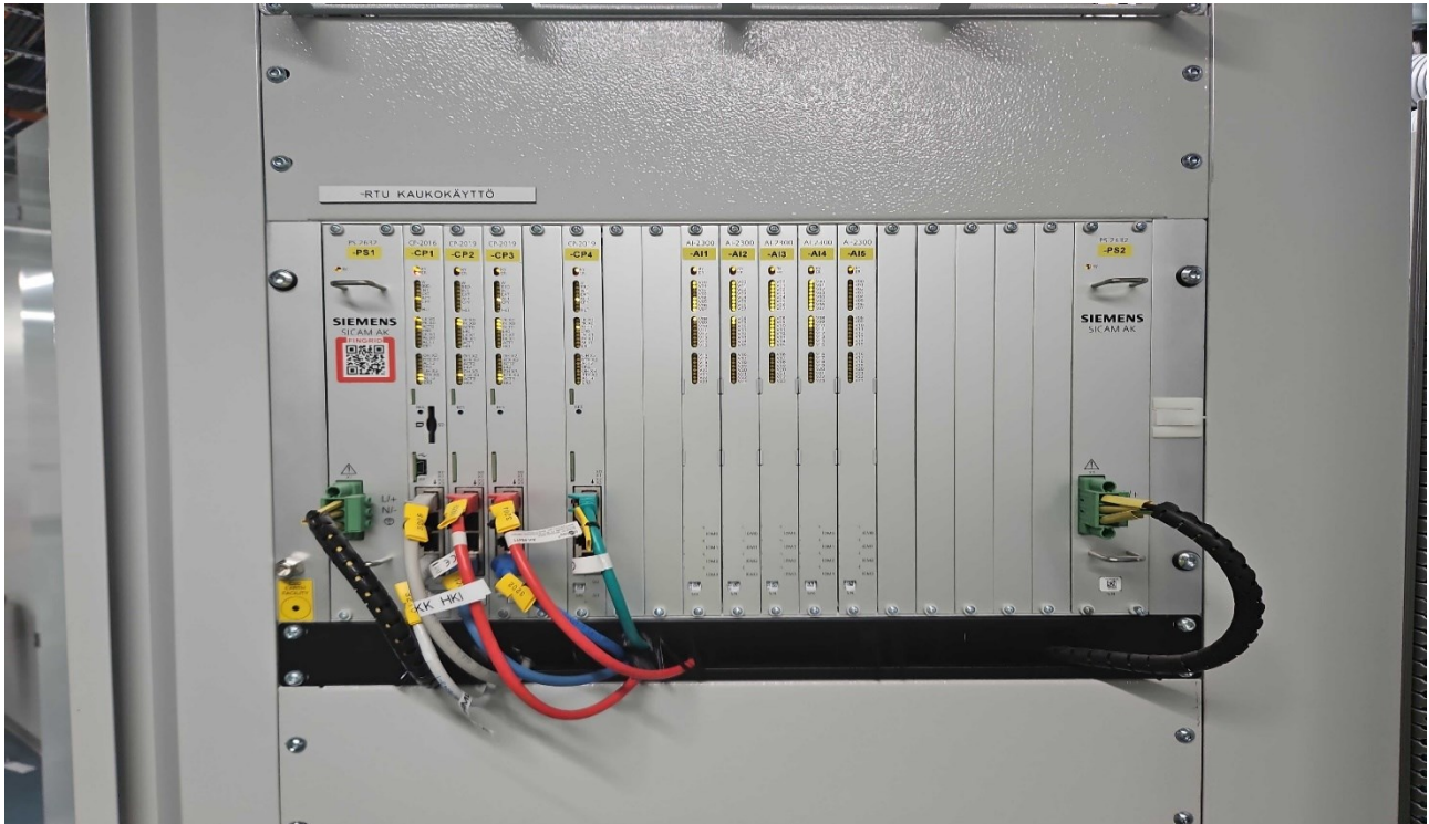
Kuvio 5. Siemens RTU, laitekuva.

Hajautetussa RTU -arkkitehtuurissa toiminnot ovat jaettu useampaan yksikköön ja erilliset I/O-yksiköt ovat sijoitettu lähelle kenttälaitteita. Yksiköt kommunikoivat keskenään väyläyhteyksien kautta, usein valokuidulla toteutettuna. Hajautettu malli vähentää merkittävästi kenttäkaapelointia ja parantaa häiriösuojausta. Se on optimaalinen ratkaisu suurille sähköasemille ja kohteille, joissa laitteet sijaitsevat laajalla alueella tai eri rakennuksissa.