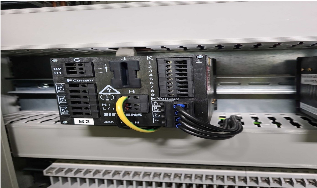
Kuvio 8. Siemens mitta-arvon muunnin, laitekuva.

Protokollamuuntimet mahdollistavat vanhojen sähköasemien asteittaisen modernisoinnin, kun perinteisiä järjestelmiä voidaan liittää uusiin IEC 61850 -pohjaisiin ratkaisuihin ilman koko automaatiojärjestelmän uusimista. Mitta-arvon muuntimet puolestaan varmistavat, että erilaiset kenttälaitteet ja anturit voidaan liittää automaatiojärjestelmiin riippumatta niiden alkuperäisestä signaalityypistä. Yhdessä nämä muuntimet vähentävät järjestelmäintegraation monimutkaisuutta ja kustannuksia, sekä parantavat eri valmistajien laitteiden yhteentoimivuutta.