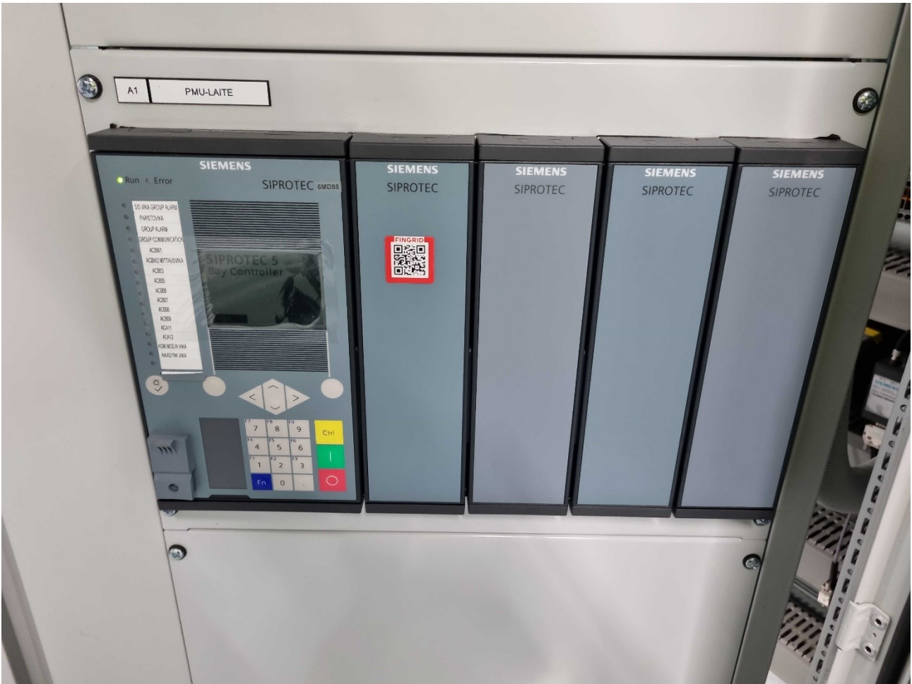
Kuvio 9. Siemens IED PMU, laitekuva.