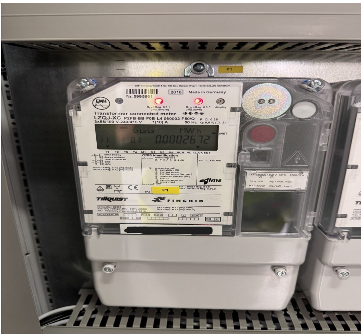
Kuvio 13. EMH energiamittari, laitekuva.

Modernit laitteet tarjoavat mittaustarkkuuden luokkaa 0,25 tai parempi ja mittaavat pätö- ja loisteon lisäksi sähkönladun parametreja. Kaksisuuntainen mittaus kattaa sekä kulutuksen että tuotannon seurannan, mikä on välttämätöntä hajautetun tuotannon yleistyessä. Mittausdata siirtyy automaattisesti taseselvitykseen ja laskutukseen.