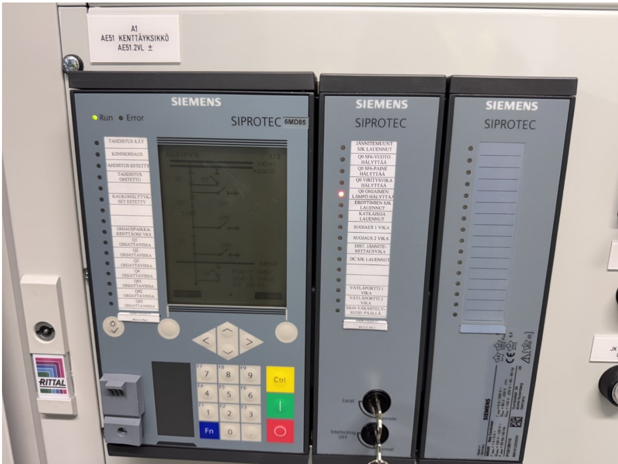
Kuvio 6. Siemens IED BCU Kenttäohjausyksikkö, laitekuva.

IEC 61850 -pohjaisissa automaatiojärjestelmissä edellyttävät systemaattista teknisen dokumentaation hyödyntämistä parametrisoinnin optimoimiseksi (Bay Control Unit 2022).