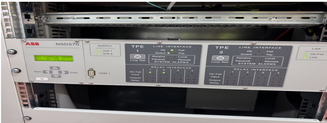
Kuvio 3. ABB SVY, laitekuva.

Laukaisujen ja hälytysten siirto välittää suojausreleiden laukaisukomentoja etäkohteisiin. Hälytys-signaalejen siirto välittää tärkeää tilatietoa verkon valvontajärjestelmille. Vikatilanteessa suojausjärjestelmä lähettää hälytyksen valvontakeskukseen käyttöhenkilökunnalle automaattisesti.