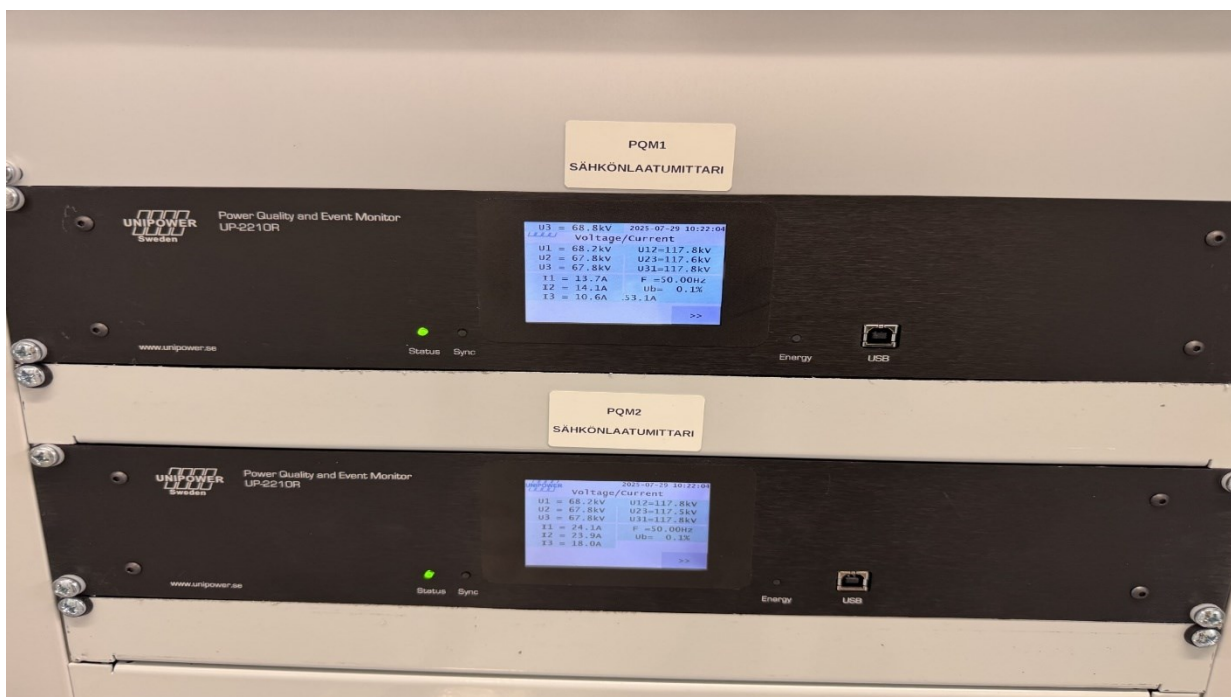
Kuvio 10. Unipower PQM, laitekuva.

Mittausmenetelmät perustuvat Fast Fourier Transform (FFT) -algoritmiin, joka analysoi taajuuspektrin. Standardoidut menetelmät käyttävät 10–12 syklin mittausikkunaa riittävän taajuusresoluution saavuttamiseksi. Total Harmonic Distortion (THD) ilmaisee kaikkien harmonisten komponenttien kokonaistehon suhteen perustaajuuteen. Interharmonisten mittaus on erityisen tärkeää, koska ne voivat aiheuttaa resonanssi-ilmiöitä ja häiritä verkon stabiiliutta (What does the IEC N.d.). PQ-mittauslaitteet integroituvat automaatiojärjestelmiin tarjoten reaaliaikaista dataa SCADA-järjestelmille. Jatkuva sähkönlaadun valvonta tukee ennakoivaa huoltoa ja mahdollistaa nopean ja tehokkaan reagoinnin häiriötilanteisiin.