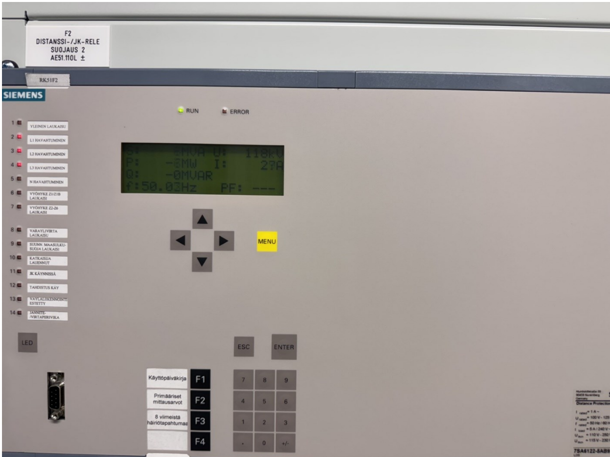
Kuvio 2. Siemens IED Distanssi- ja jälleenkytkentärele, laitekuva.

Modernit IED-laitteet tukevat IEC 61850 -standardia sähköasemien automaatioon, mikä takaa laitteiden yhteentoimivuuden valmistajasta riippumatta. Suurjännitesähköasennuksissa IED-laitteiden tulee täyttää SFS 6001 -standardin vaatimukset turvallisuuden varmistamiseksi (SFS 6001:2025).