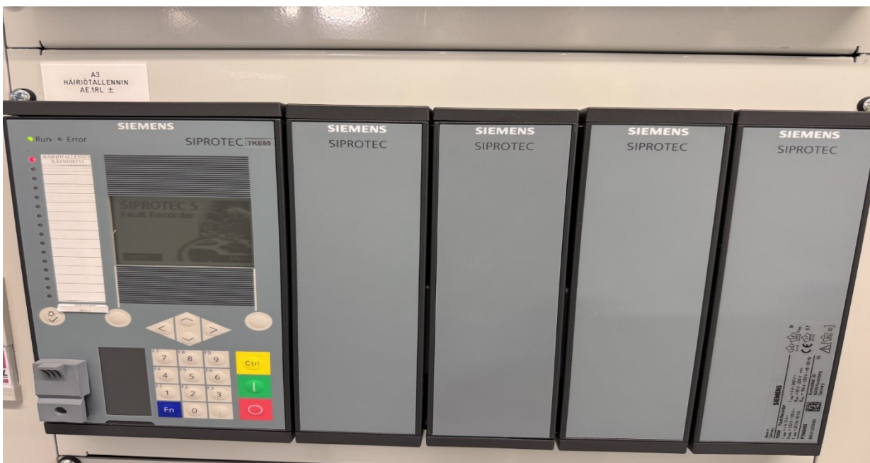
Kuvio 12. Siemens IED häiriöntallennin, laitekuva.

Modernit modulaariset häiriöntallentimet sähköasemakäyttöön voivat tallentaa tyypillisesti jopa 40 analogista kanavaa samanaikaisesti säädettävällä näytteenottotaajuudella 1–16 kHz. Laitteet sisältävät yleensä usean gigatavun massamuistin, jonka käyttäjä voi jakaa eri tallentimille tarpeen mukaan. Nykyaikaiset häiriöntallentimet tukevat COMTRADE-standardia ja sisältävät integroidun PMU-toiminnallisuuden IEEE C37.118 -standardin mukaisesti. GPS-aikaleimaus varmistaa tallenteiden tarkan synkronoinnin, ja IEC 61850 -integraatio tukee toimintaa automaatiojärjestelmien kanssa (Siprotec 7KE85 2023).