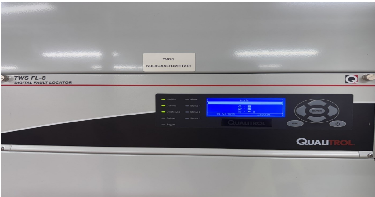
Kuvio 11. Qualitrol kulkuaaltomittari, laitekuva.

Järjestelmä mittaa vian synnyttämien aaltojen kulkuaikoja eri mittauspisteissä mikrosekunnin tark-kuudella. GPS-synkronointi varmistaa aikaleimausten vertailukelpoisuuden. TWS-anturit asenne-taan sähköasemille mittaamaan virta- ja jännitetransientteja ja yksikkö laskee vian sijainnin auto-maattisesti. Verrattuna perinteisiin impedanssimenetelmiin, kulkuaaltomittaus tarjoaa huomattavasti paremman vianpaikannuksen erityisesti pitkillä johdoilla. Järjestelmä kykenee ha-vaitsemaan myös osittaispurkauksia ja muita häiriöitä ennen varsinaista vikaa.