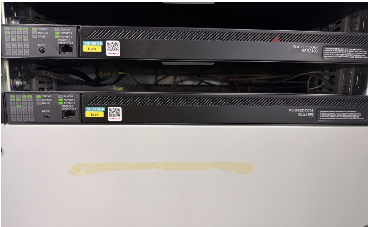
Kuvio 7. Siemens väyläkytkin, laitekuva.