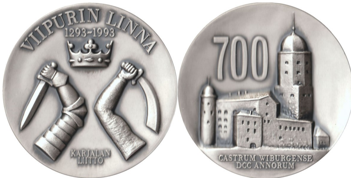
Kuva 7. Viipurin linnan 700-vuotisjuhlamitali, 925 o/oo hopeaa. Maksimilyöntimäärä 2 000 kpl, halkaisija 70,0 mm ja paino 270 grammaa. Myyntihinta oli vuonna 1993 1 500 mk, mikä vastaa nykyrahassa noin 425 €.