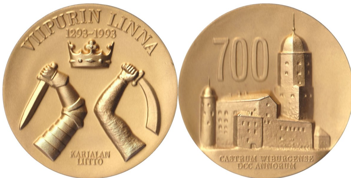
Kuva 6. Viipurin linnan 700-vuotisjuhlamitali, kullattua pronssia. Maksimilyöntimäärä 2 000 kpl, halkaisija 70,0 mm ja paino 270 grammaa. Myyntihinta oli vuonna 1993 290 mk, mikä vastaa nykyrahassa noin 80 €.