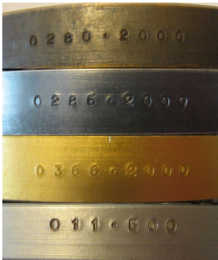
Kuva 8. Viipurin linnan 700-vuotisjuhlamitalin reunanumeroinnit. Ylinnä pronssisen mitalin numerointi, sen alla hopeoidun pronssisen mitalin numerointi, sen alla kullatun pronssisen mitalin