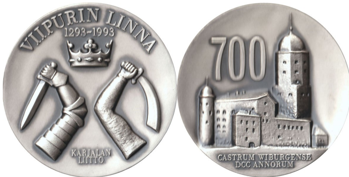
Kuva 5. Viipurin linnan 700-vuotisjuhlamitali, hopeoitua pronssia. Maksimilyöntimäärä 2 000 kpl, halkaisija 70,0 mm ja paino 270 grammaa. Myyntihinta oli vuonna 1993 250 mk, mikä vastaa nykyrahassa noin 70 €.