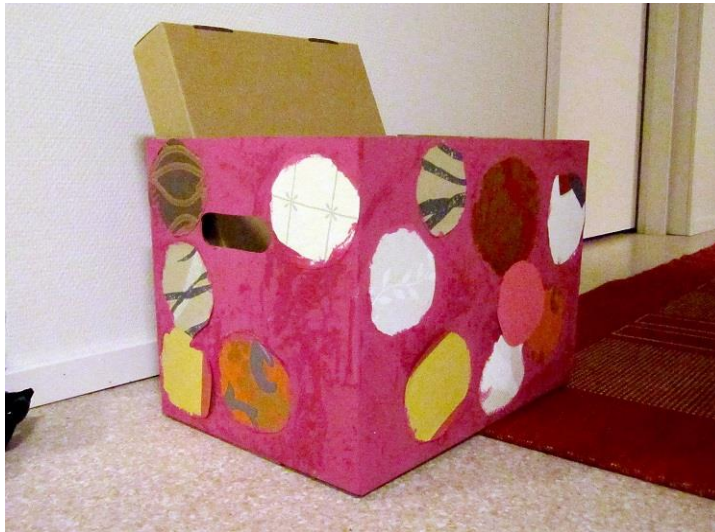
Kuva 2. Oma tarina –laatikko

Tyttö, joka oli osallistumisestaan epävarma, saapui ryhmään ja toi mukanaan vanhempinsa allekirjoittaman tutkimuslupalapun. Tyttö oli hiljainen, ei osallistunut ryhmän yhteiseen tuotokseen eikä myöskään innostunut yksilötehtävästä. Hän osallistui omalla tavallaan; seuraamalla muiden tekemistä ja puheita sekä koristelemalla oman laatikkonsa ja asettamalla itselleen jopa kaksi tavoitetta ryhmän ajaksi.