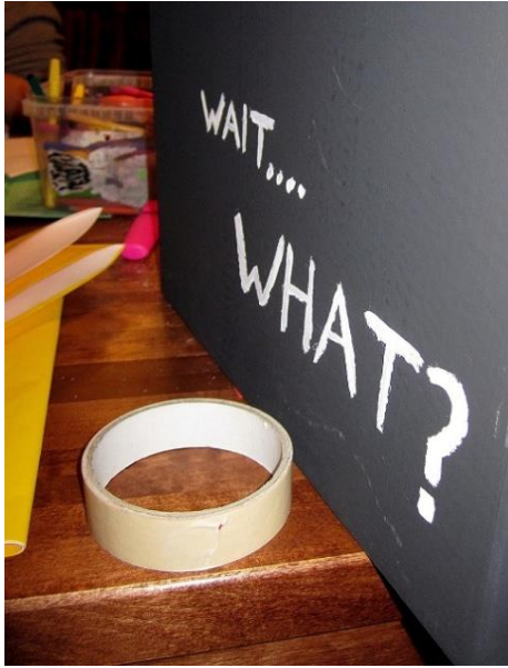
Kuva 3. Oma tarina –laatikko

Kolmas tapaamiskerta: sijoituksen alku. Tytöistä hiljaisin tuli ennen aloitusta kysymään, tarvitsemmeko apua alkuvalmisteluissa. Tyttö ja toinen meistä laitoivat tiloja valmiiksi ja jutustelivat niitä näitä ennen ryhmän alkua. Olimme pohtineet, onko työllä halua olla ryhmässä mukana, tämä oma-aloitteinen avun tarjoaminen antoi vaikutelman innokkaasta, mutta ryhmässä ujosta tytöstä.