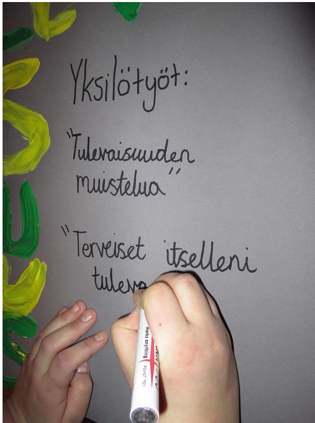
Kuva 5. Tulevaisuus teeman otsikko kartonki

Porukka paikalla hyvin fiiliksin ja tarttuivat otsikoiden tekoon. **** valitsi maalit ja intaantuu tekemään kädenjälkiä kartonkiin...ihana katsoa kun muut tytöt tekevät saman perässä. (Tutkimuspäiväkirja 2.12.14.)