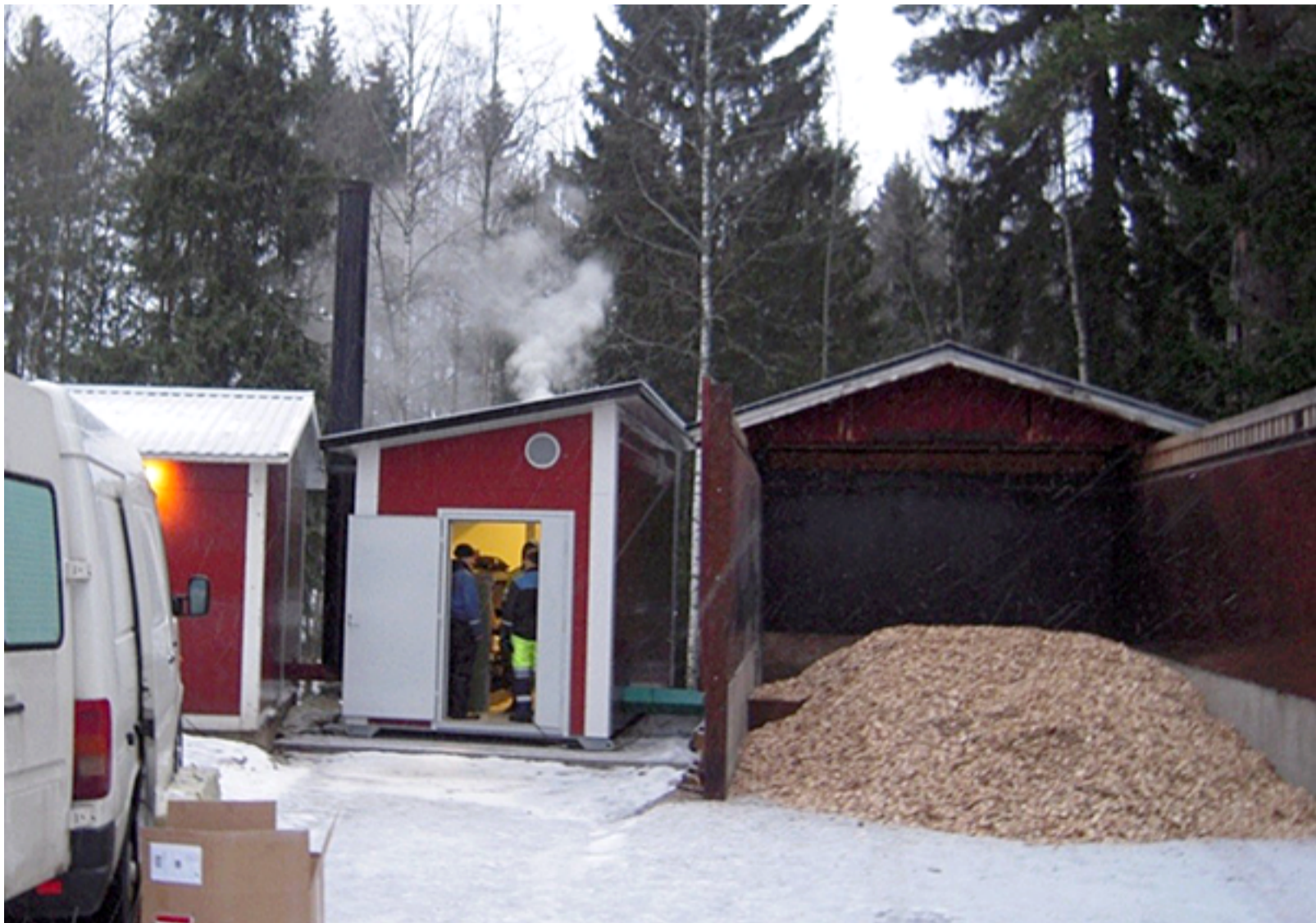
KUVA 1. Volterin CHP-laitoksen koekäyttöä 19.12.2013 Alpuan kylätalolla Vihannissa. Voimalaitos kuvassa keskellä.

Oman kiinnostuksen lisäksi uusiutuville energiamuodoille on monesti myös käytännön tarvetta, ja prosessin alkamisen syykkeenä toimii jokin käytännön ongelma. Maatiloilla tällaisena tekijänä toimii monissa tapauksissa suuri sähkön- ja lämmönkulutus tuotantorakennuksissa. Bioenergiaratkaisulla pyritään pienentämään tuotantotilojen ylläpidosta aiheutuvia kustannuksia ja luomaan maatilaympäristöstä omavarainen kokonaisuus. Maatilojen lisäksi myös monet kyläyhteisöt ovat tarttuneet mahdollisuuteen pienentää omien toimitilojensa energiakustannuksia. Esimerkkinä toimii Alpuan Kyläyhdistyksen kylätalolleen perustama CHP-laitos (kuva 1). Energiakustannusten pienentämisen lisäksi erityisesti karjatililla on tavoitteena vähentää lannoitekustannuksia hyödyntämällä biokaasulaitoksesta kaasun lisäksi myös mädätysjännös lannoitteena. [8] (#cite-text-0-15)