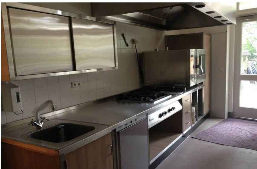
KUVA 11. Keittiö

Ruoka: Tällä rastilla perheet saavat yhdessä leipoa karjalanpiirakoita etukäteen valmistetuista aineista. Ilmoittautumisen yhteydessä olisi hyvä mainita mahdolliset ruoka-aineallergiat, jotta ne voidaan ottaa huomioon taikinan ja riisipuuron etukäteen valmistuksessa.