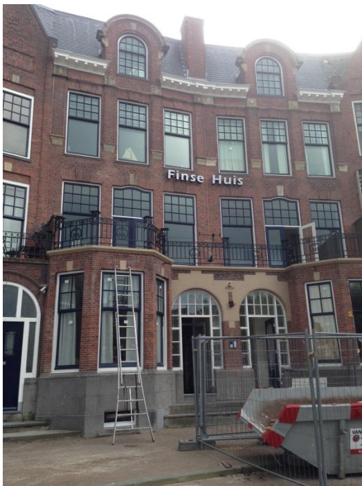
KUVA 3. Rotterdamin suomalainen merimieskirkko vuonna 2014