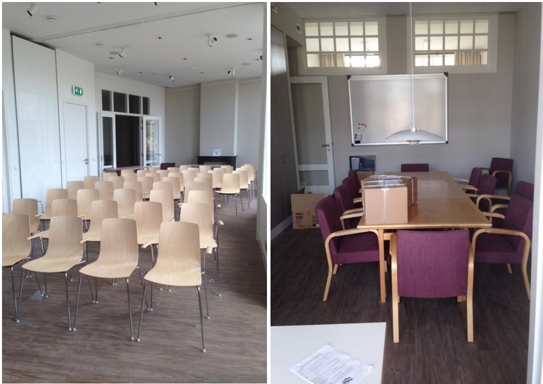
KUVA 9. Sali (Elina Pulkkinen 2014) KUVA 10. Kokoushuone (Elina Pulkkinen 2014)

Ruoka: Tällä rastilla perheet saavat yhdessä leipoa karjalanpiirakoita etukäteen valmistetuista aineista. Ilmoittautumisen yhteydessä olisi hyvä mainita mahdolliset ruoka-aineallergiat, jotta ne voidaan ottaa huomioon taikinan ja riisipuuron etukäteen valmistuksessa.