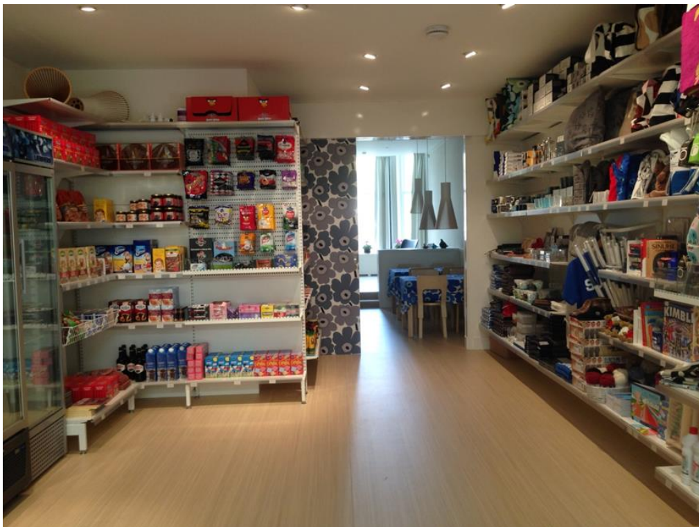
KUVA 4. Suomi-kauppa (Elina Pulkkinen 2014)

Tänä päivänä Rotterdamin merimieskirkko järjestää myös hyvin monipuolisesti erilaisia tapahtumia ja myyjäisiä, jotka ovat avoinna kaikille etnisestä taustasta ja iästä riippumatta. Saatavilla on myös palveluita moneen eri lähtöön. Näitä ovat Suomi-kauppa, kahvila, sauna, kirjasto, yksi vierashuone ja mahdollisuus yksityistilaisuuksien pitämiseen. (Benelux-maiden suomalainen merimieskirkko 2014.)