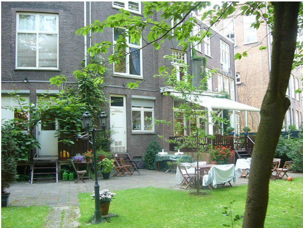
KUVA 12. Rotterdamin suomalaisen merimieskirkon takapiha (Wikipedia 2014)