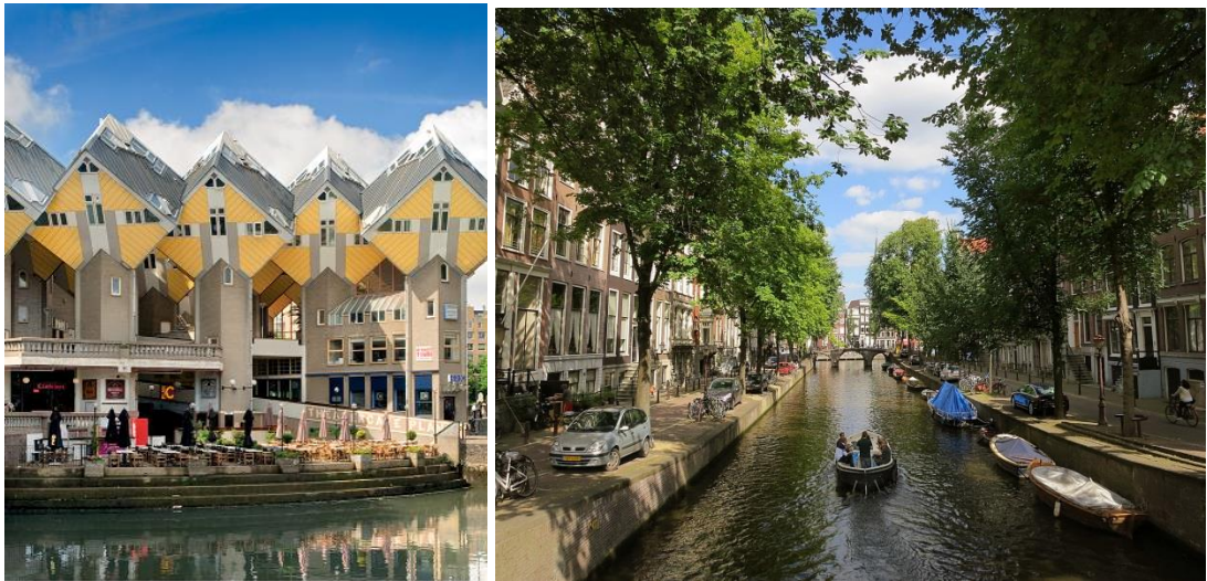
KUVA 5 & 6. Moderni Rotterdam vs. idyllinen Amsterdam

Rotterdamilla olisi paljon tarjottavaa matkailijoille. Rotterdam ei ole tyypillisen idyllinen hollantilaiskaupunki, vaan se erottuu muista nykyaikaisen ja modernin arkkitehtuurinsa puolesta. Rotterdam tunnetaan erityisesti taiteen ja designin keskuksena, mutta myös kaikenlaista kulttuuritarjontaa, kuten museoita, teatteria ja festivaaleja on saatavilla. Lisäksi Rotterdamin suuri satama tuo oman viehätysvoimansa karkeankauniiseen kaupunkiin. (Miettinen & Hietala 2013.)