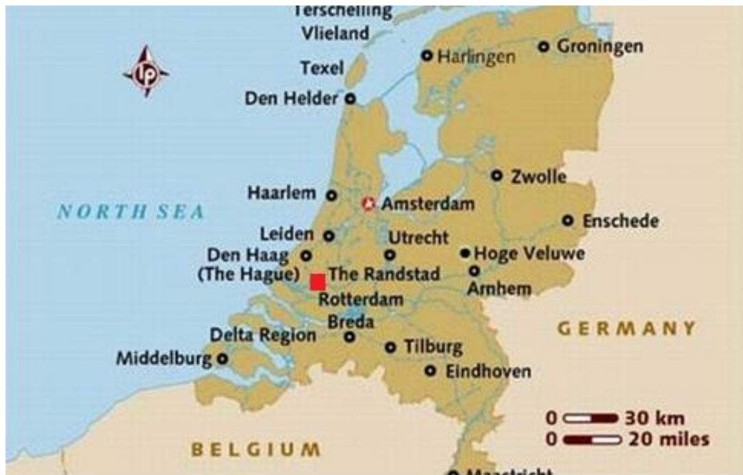
KUVA 1. Rotterdamin sijainti Alankomaissa (Lonely planet ja Elina Pulkkinen 2014)