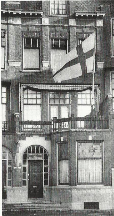
KUVA 2. Rotterdamin suomalainen merimieskirkko vuonna 1955