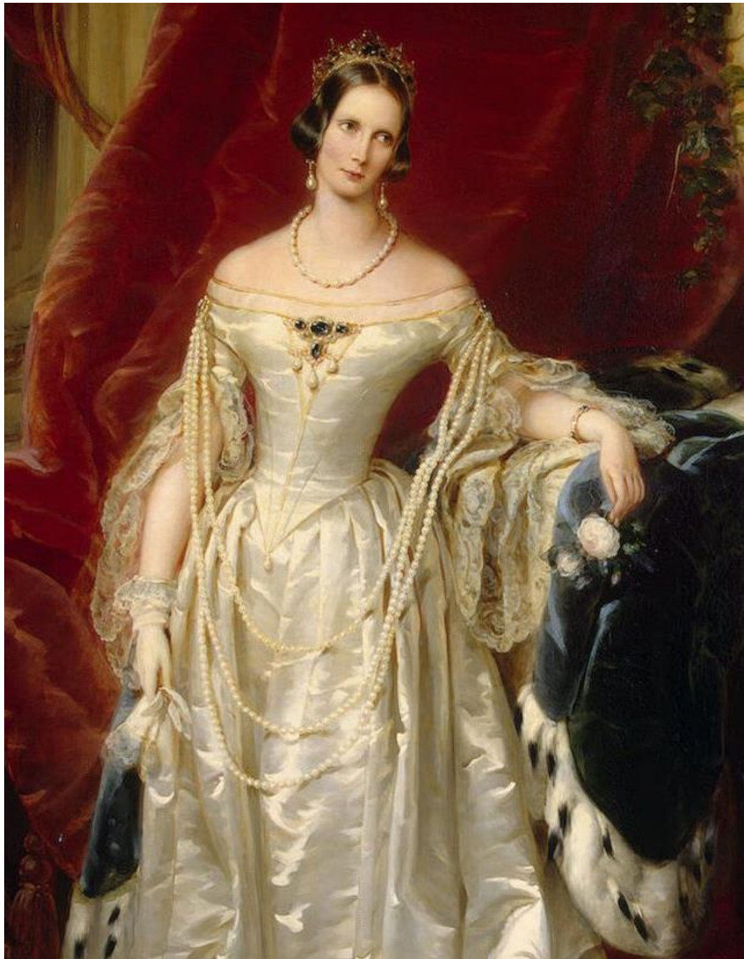
9. Christina Robertson: Empress Alexandra Feodorovna, yksityiskohta

Yhteiskunnassamme koetaan tarpeelliseksi, että valta-asemassa olevat henkilöt pukeutuvat tiukasti tiettyjen valmiiksi asettujen normien mukaan. Vaikka asut olisivat suhteellisen samanlaisia, niitä silti kutsutaan sukupuolitetuilla eri nimillä. Vertaa miehen puvun takki ja naisten jakkutakki. Toisaalta esimerkiksi uskonnollisten johtajien mekkomaiset kaavut ovat yleisesti hyväksytyjä, koska niitä pidetään vakiintuneena traditiona.