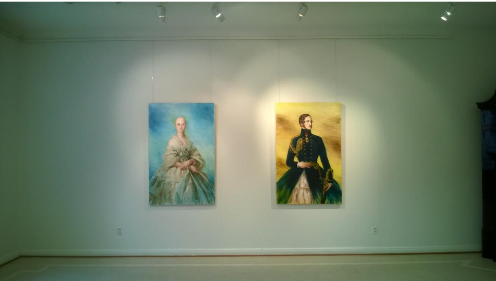
10. Installointi Galleria Saskiassa

”Lukija saattaa ihmetellä, mitä hyötyä [sukupuolen] ”mahdollisuuksien avaamisesta” lopulta on, mutta kukaan, joka on ymmärtänyt millaista on elää sosiaalisessa maailmassa ”mahdottomana” käsittämättömänä, toteuttamattomana, epätodellisena ja luvattomana, tuskin esittää moista kysymystä.” (Butler 2006, 18)