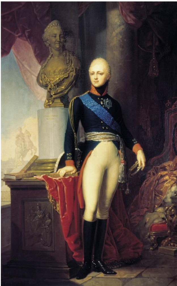
2. Vladimir Borovikovsky: Portrait of Grand Duke Alexander Pavlovich of Russia

Miehiin ja maskuliinisuuteen liitetään kokemus voimasta ja valta-asemasta (Forrester 2000, 111-113). Mieshallitsijoiden maalauksissa maskuliinisuutta pyritään tuomaan esiin miekalla ja arvomerkeillä. Näennäisen rento asento voidaan myös tulkita passiivisen feminiinisuuden sijasta vallan eleeksi, sillä rentous toisaalta kuvastaa passiivisuudestaan huolimatta itsevarmuutta ja hallinnan tunnetta käden