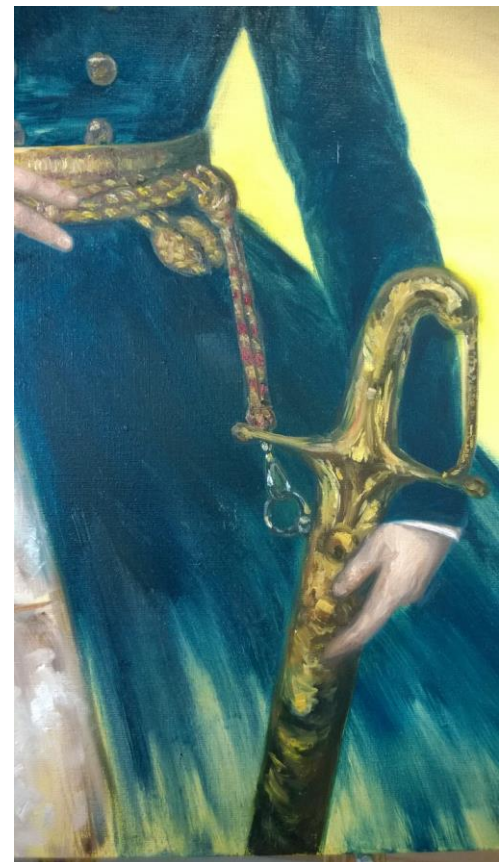
8. Yksityiskohta maalauksesta Miekka tekee miehen

Usein naisten asemaa perustellaankin ajatuksella ”ennen naiset saivat olla naisia ja miehet miehiä”. Butler kirjoittaa ”ennen”-määreen esiinnostamisen aikaansavaan oletuksen siitä, että ”se takaa esiyhteisöllisen ontologian (pohdinta siitä, millainen todellisuus perimmiltään on) henkilöistä, jotka vapaasti suostuvat hallittaviksi ja siten oikeattavat yhteiskuntasopimuksen.” (Butler 2006, 50) Jos aina hyväksyttäisiin tämän kaltainen ajatuskulku, yhteiskunta ei koskaan pääsisi kehittymään ja naiset olisivat yhä kotona poissa silmistä.