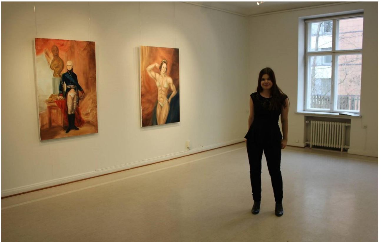
1. Galleria Saskian avajaisista

Seuraava luku (luku 3) käsittelee kehonrakentamista harjoittavia naisia, jotka lihastensa myötä päätyvät väkisin maskuliinisuuden kenttään samalla yrittäen säilyttää naisellisuutensa. Kuvalähteenäni toimii maalaukseni, Kuningatar bikineissä , lihaksikkaasta kuningattaresta kehonrakentajan kisakunnossa. Maalaus on toisinto Venäjän keisarinna Alexandra Feodorovnasta. Neljännessä luvussa pohdin maskuliinisen ja feminiinisen rajaa käyttäen pohjana maalaustani, Nainen ja viuhka , kaljusta ruhtinattaresta, joka alunperin on esittänyt keisarinna Maria Alexandrovnaa. Valitsin alkuperäiset maalaukset niiden esteettisen viehättävyyden ja sen perusteella, kuinka hyvin koin niiden sopivan yhteen valitsemäni teeman kanssa. Esimerkiksi Alexander I:n poseeraus sopi hyvin tekemiini muokkauksiin. Varsinaiset teemat valitsin, koska koen, että niitä on tarpeellista ja ajankohtaista käsitellä.