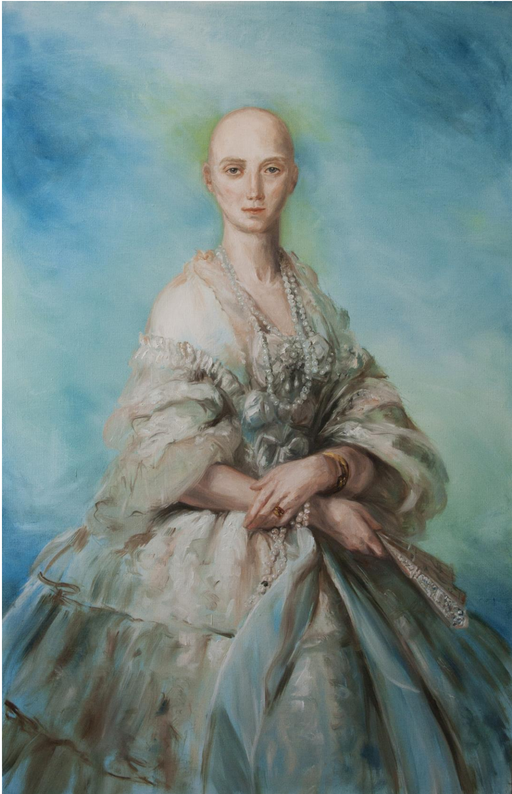
7. Nainen ja viuhka

Butler ottaa naiseuteen kantaa hieman voimakkaammin ja toteaa ihmisen olevan nainen siinä määrin kuin hän toimii naisena vallitsevassa heteroseksuaalisessa kehyksessään. Tämän kehysten kyseenalaistaminen johtaa hänestä siihen, että kyseenalaistaja samalla mahdollisesti kokee menettävänsä jotain omasta paikantuneisuuden tunteestaan suhteessa sukupuoleen (Butler 2006, 21). Toisin sanoen yhteiskunnan asettamien naisen