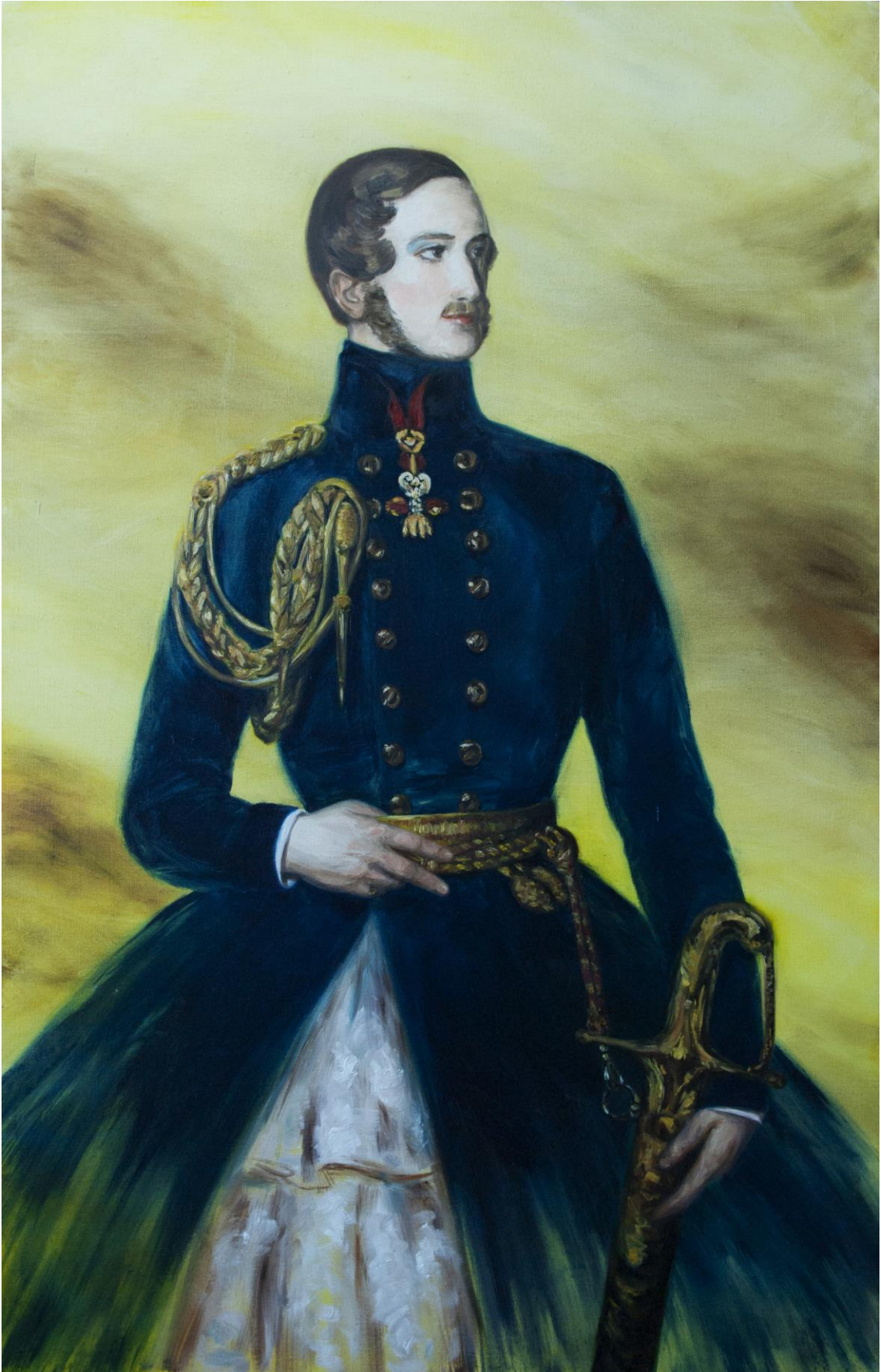
4. Miekka tekee miehen