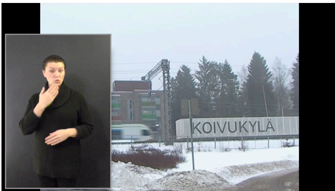
Kuva 2. Tulkkiruutu lopullisessa käännöksessä.

Ensimmäisessä versiossa ruutu oli vaakatasossa kuvaruudun oikeassa alakulmassa, ja se tuntui katsojista liian pieneltä. Toisessa versiossa käänsin ruudun pystysuoraan, suurensin sitä ja sijoitin sen videon vasempaan laitaan. Sain videon kuvakooksi 4:3. Tällä tavalla toimien sain kuvan reunoihin mustat palkit. Sijoittamalla tulkkiruudun osaksi näiden palkkien päälle, tulkkiruutu ei isompikokoisenaakaan peittänyt liikaa alla olevaa kuvaa.