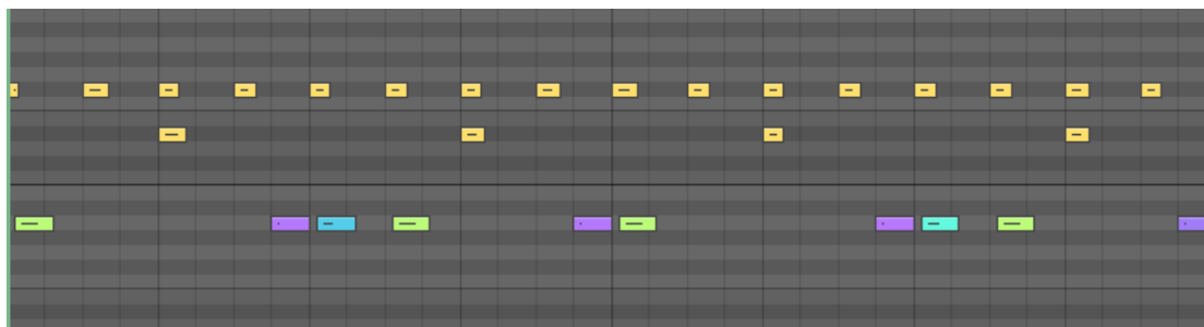
Kuviossa 3 Väri vihreä kuvastaa kovaa, turkoosi normaali ja violetti hiljaa. Värit kuvastavat saman bassorummun eri dynamiikkaa.

Tämän jälkeen hän lisäsi haamunuotteja bassorumpuun, mikä tarkoittaa sitä, että hänellä oli useampi eri sample bassorummusta eri dynamiikalla, mikä huomattavasti elävöittää elektronisesti tehtyjä rumpuja.