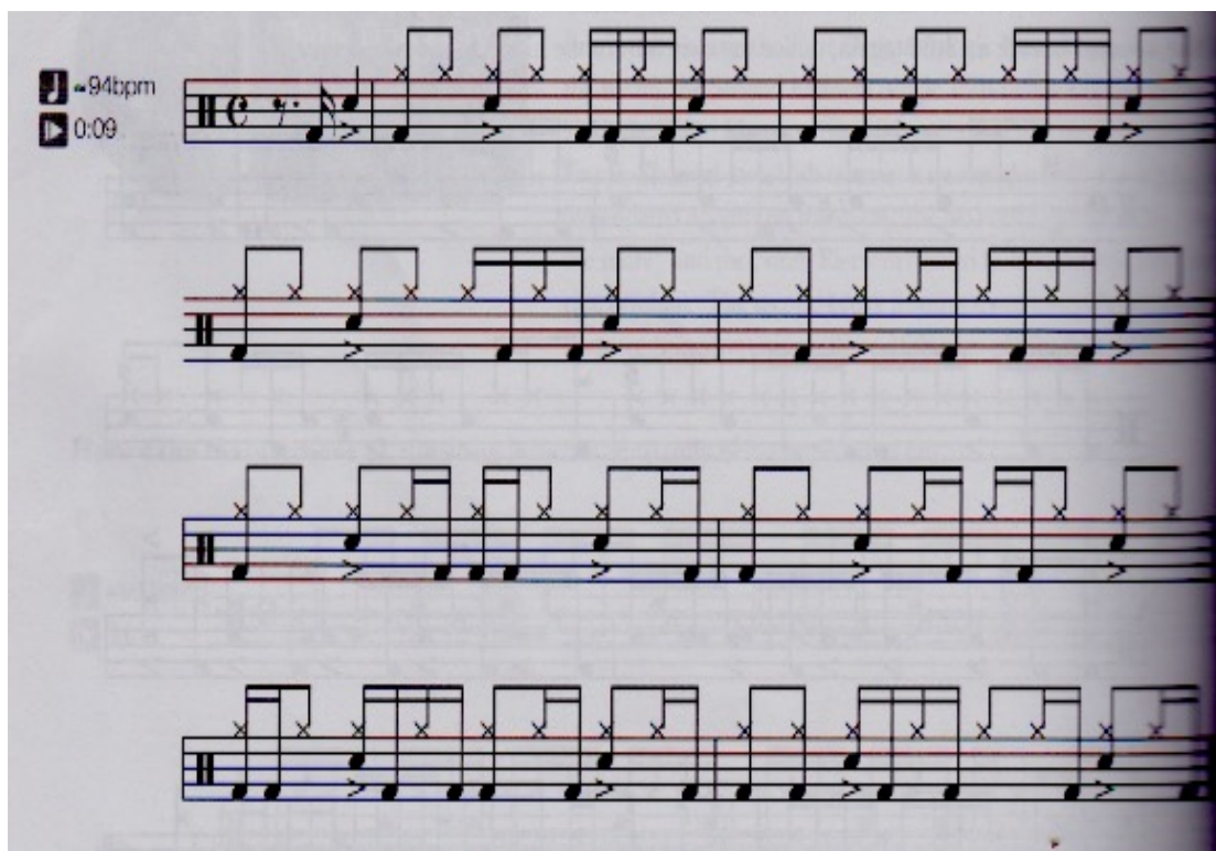
Kuviossa 2 Transkriptio Pharcyden Runnin' kappaleesta (Adamo, 2010).

Questlove sanoi kirjassaan Mo Meta Blues : ”Kun kuulin The Pharcyden Bullshit kappaleen poistuessani keikka paikalta, piti minun kääntyä takaisin ja mennä katsomaan mitä tapahtuu. Hihat ja virveli olivat normaalit, bassorumpu kuulosti kuin lapsi olisi sitä soittanut” (Thompson, Greenman, 2013 s. 259-260).