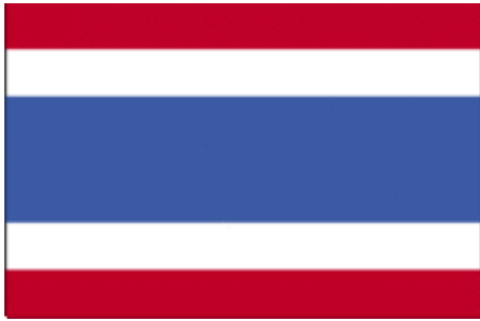
Bild 3: Thailands flagga