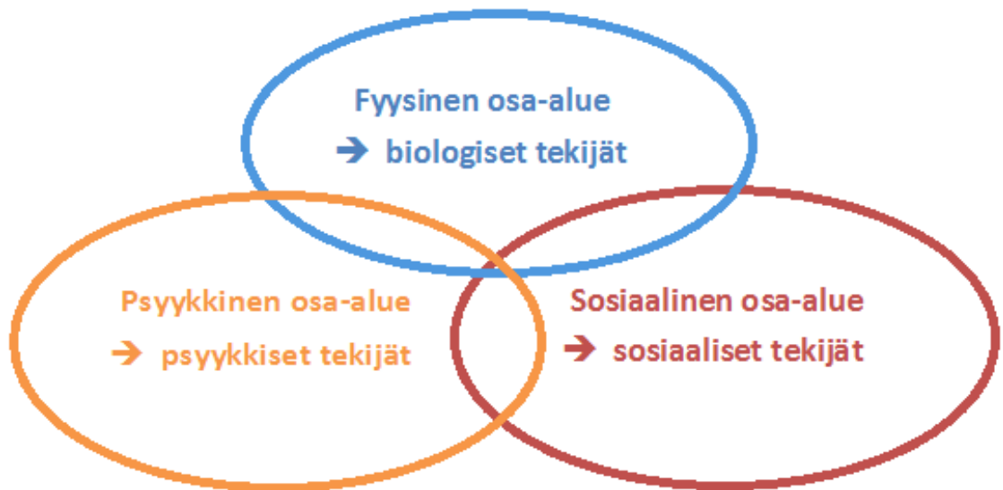
Kuvio 1. Hoitotieteellinen eli holistinen käsitys terveydestä

Tässä kirjallisuuskatsauksessa terveyttä tarkastellaan käyttäen viitekehyksenä hoitotieteellistä eli holistista terveystieteistä (ks. Kuvio 1).