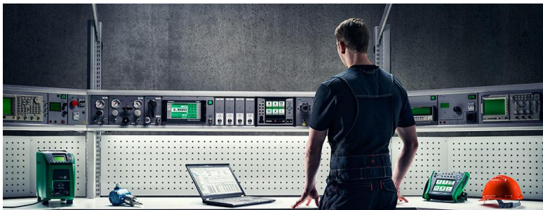
KUVIO 7. Beamexin kalibrointipenkki. (Beamex 2015).

Kannettavien kalibraattoreiden osalta myynnillisesti Beamex Oy Ab panostaa koko mallistoon. Intian markkinoiden laaja-alaisuus tukee nykyistä ja tulevaa tuotetarjontaa. Penkkilinjan, eli kalibrointiasemien osalta Beamex valitsee paikallisen yhteistyökumppanin, jolta tullaan hankkimaan varsinainen kalustus. Penkkiin tarvittavat moduulit ja laitepaneelit toimitetaan Suomesta Intiaan. Rinnalla pidetään kokonaisratkaisun (penkit ja paneelit) toimittamista Suomesta vaativille asiakkaille. Palveluiden osalta Beamex keskittyy varaosien myyntiin yhteistyökumppanille ja koulutetaan heidän huoltoasiantuntija Beamexillä. Yhteistyökumppanin akkreditoimaa eli valtuuttamaa painelaboratoriota hyödynnetään ensisijaisena uudelleenkalibrointipisteenä. Ohjelmistossa keskitytään CMX Light tasoon. (Salimäki, 2008.)