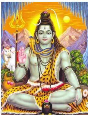
KUVIO 3. Shiva. (Harisingh 2015).

Englanti on yksi Intian kuudestatoista virallisesta kielestä, ja niistä ainoa jota puhutaan Intian yleisesti koulutetussa yhteiskunnassa. Englannin puhuminen nähdään neutraalina, sillä se ei aiheuta alueellisia mielle yhtymiä jotka aiheuttavat paljon kitkaa Intian poliittiseen elämään. Siksi monet intialaiset puhuvat erinomaista englantia, vaikkakin selvällä aksentilla. Kansainvälistä kauppaa harjoittavassa yrityksessä on epätavallista tavata ihminen, joka ei pysty kommunikoimaan englanniksi. (Business Culture in India 2013.)