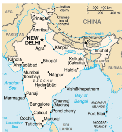
KUVIO 2. Intian kartta. (Starlighttours 2010).

Uskonto on erittäin tärkeä asia intialaisten elämässä. 80,5 % intialaisista on hinduja. Muslimeja on n. 14 % ja kristittyjä noin 3 %. Suomalaisten ja muiden ulkomaalaisten on hyvä yrittää ymmärtää tätä saavuttaakseen onnistuneet suhteet Intiaan. Alla olevassa kuviossa (KUVIO 2) näkyy Intian kartta. (Maatiedosto Intia 2014.)