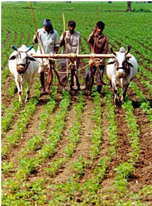
KUVIO 6. Paikalliset maanviljelijät hoitavat soijasatoaan Bhoparin alueella. (The Hindu 2010).

Intia on myös maailman toiseksi suurin viljelyiden tuottaja. Maatalous ja samankal-taiset alat kuten metsätalous, puunkorjuu ja kalastus koostavat 17 % Intian BKT:stä ja työllisti jopa 51 % koko Intian työvoimasta vuonna 2012. Koska Intian talous on monipuolistunut ja kasvanut, maatalouden osuus bruttokansantuotteesta on vähen-tynyt tasaisesti vuosina 1951 – 2012, mutta se on edelleen suurin työllisyyden lähde ja merkittävä osa yleistä sosioekonomista kehitystä Intiassa. Osavaltiot kuten Pun-jab, Maharashtra, Uttar Pradesh, Haryana ja Bihar ovat keskeisiä alueita Intian maa-taloudelle. (WTO 2014.)