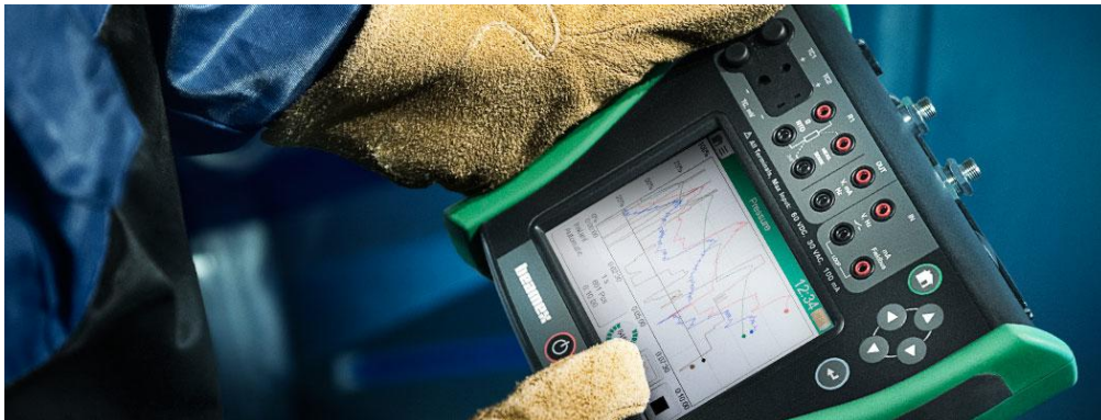
KUVIO 1. Beamexin MC6 kenttäkalibraattori ja -kommunikaattori. (Beamex 2015).

Maailmanluokan kalibroitratkaisuja – vuonna 1975 perustettu pietarsaarelainen yritys keskittyy voimakkaasti ja johdonmukaisesti kalibrointiin. Beamex kehittää, valmistaa ja markkinoi laadukkaita laitteita, palveluita, ohjelmistoja ja kokonaisjärjestelmiä jotka on tarkoitettu instrumenttien kalibrointiin. Beamex on maailman johtava teknologia- ja palveluyritys kattavalla tuote- ja palveluvalikoimalla. Tähän valikoimaan kuuluvat kannettavat kalibraattorit, työasemat, kalibrointiohjelmistot- ja tarvikkeet, kuten myös toimialakohtaiset ratkaisut ja palvelut. (Beamex 2015.)