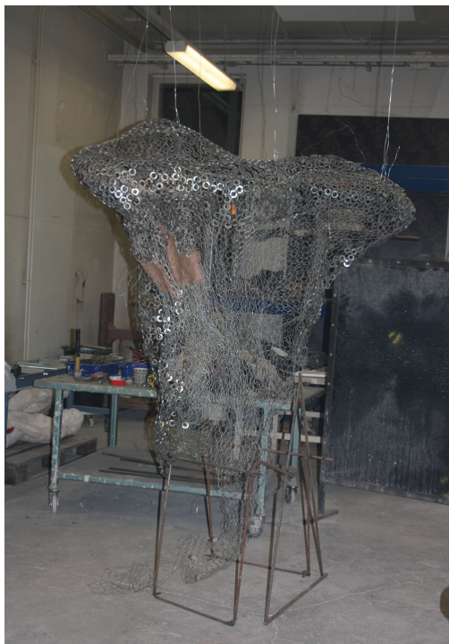
Kuva 5. Teoksen hitsausta pystyasennossa. Loppuajasta pysyitin työskentelemän vain illasta ja alkuyöstä jotta sain tarvitsemäni rauhan tekemiseen.

Tämän tekniikan oivallettuaani työni eteni hyvin johdonmukaisesti vaikkakaan ei mutkattomasti alusta loppuun. Tehtyäni yläosan, ripustin sen katosta roikkumaan sille korkeudelle, kuin mitä se tulisi suurin piirtein näyttelytilassamme olemaan. Viimeistelin teoksen korkeuden sen mukaan. Kiinnitin kanaverkon sivuosat kiinni jo valmiiseen yläosaan ja hitsasin teoksen loppuun tässä asennossa. Käytin edelleen