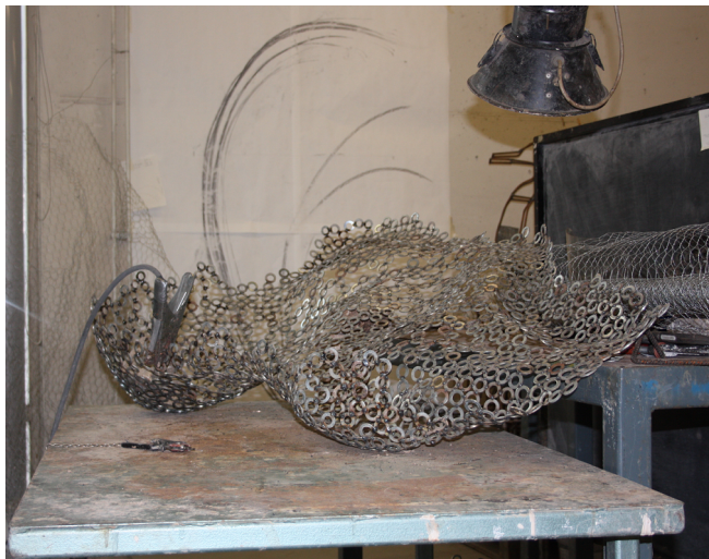
Kuva 4. Yläosan toisen puolen hitsausta. Teos täytyi hitsata molemilta puolilta, jotta siihen tuli riittävästi lujuutta.

pystyin tekemään ensin yläosan pöytatasolla. Vahvistin muotoa savella ja hitsasin aluslevyjä saven päällä. Tuntui hyvältä käyttää orgaanista ja lämpimältä tuntuva savea apuna kylmän ja kovan metallin hitsaamisessa (ks. Kuva 3 ja 4).