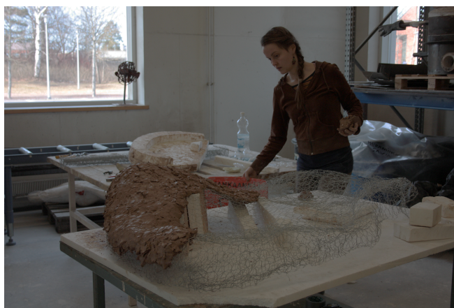
Kuva 3. Yläosan rungon tekoa kanaverkon ja saveen avulla. Taustalla osa hylkäämästäni styroksirungosta.

Tehtyäni teoksesta luonnoksen kanaverkosta oikeaan kokoon, oli varsinaisen teoksen hitsauksen aika. Ajattelin ensin, että työskentelen kanaverkon päällä niin, että pihtejä apuna käyttäen hitsaan aina aluslevyjä yksitellen kiinni toisiinsa ja seuraan kanaverkon muotoa. Tämä osoittautui kuitenkin liian vaikeaksi ja hitaaksi työskentelymenetelmäksi. Sitten palastelin kanaverkon muodon osiin niin, että