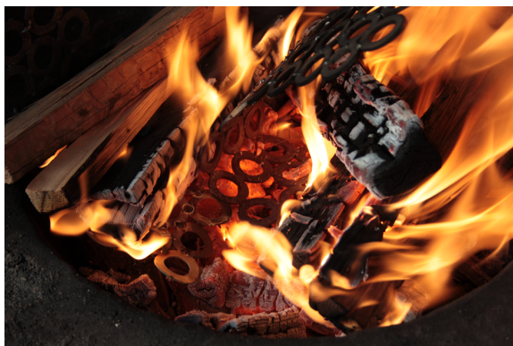
Kuva 1. Hiillos pehmittää kovaa rautaa.

Tammikuussa 2015 aloitin varsinaisen työni tekemisen. Ensin aloitin harjoittamalla tekniikkaani aluslevyjen hitsauksessa, johon löysin varmuuden aika nopeasti. Teknisesti tiesin selviäväni, mutta taideteoksen tyydyttävän muodon löytyminen oli haaste. Työskentelin niin, että keskityin pehmeiden tunteeseen kehossani ja sen jälkeen hitsasin levyjä yksitellen kiinni toisiinsa tunteen ohjaamana. Havaitsin, että keskittyessäni tunteeseen, muoto lähti syntymään aina samalla tavalla: ensin yksittäisenä kaarena, joka sitten muuttui vähitellen kummastakin päästä spiraalimaiseksi. Koska haave tulevasta taideteoksesta oli suuri, siirryin ensimmäisten hitsauskokeilujen jälkeen muovailemaan punavahasta pienoismalleja, joissa tutkin sitä, miten kaari ja spiraalimainen muoto kehittyisivät kolmiulotteisiksi. Tyydyttävän muodon löytyminen ei ollut helppoa. Muovailin ja piirsin paljon erilaisia malleja, joista jokainen lähti aina samanlaisesta kaaresta muuttuen vähitellen spiraaliksi, mutta lopputulos ei tuntunut koskaan tyydyttävältä. Luonnostelun ohessa jatkoin välillä hitsausharjoituksia, mutta lopulta kävi niin, että minua ei enää edes tyydyttänyt hitsaamani pinnan jälki. Ajattelin, että takomalla voisin saada metallin taipumaan juuri niin kuin haluan. Niinpä opettelun takomaan. Tämä ei vienyt teostani varsinaisesti eteen päin tajutessani, että tällä tekniikalla teostani ei ainakaan kannata tehdä. Opin kuitenkin uuden hienon tekniikan ja erityisesti tuli ja siinä pehmenevä