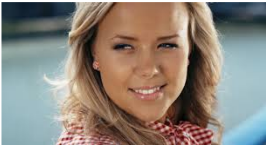
(Figur 2. Peppi ombord på kryssningsfartyget i filmen Nightmare – Painajainen merellä )

Nightmare är gjord på basis av den populära tv-serien Salatut Elämät och med några av seriens centrala rollfigurer. Filmen klassas som en skräckfilm och handlar om nygifta Peppi som åker på en kryssning tillsammans med sin man och några vänner. Ombord träffar de gamla bekanta som lyfter fram tråkiga minnen hos Peppi. Snart börjar det hända konstiga saker ombord och Peppis vänner börjar försvinna en efter en. Det kommer fram att händelserna hänger ihop med ett gammalt narkotikarelaterat mord som Peppi varit inblandad i. Redan från början talar Peppi med sina väninnor om hur ivriga de är över att åka på kryssning. Även i senare skede pratar flickorna med varandra om de mystiska händelserna och vad de kan bero på.