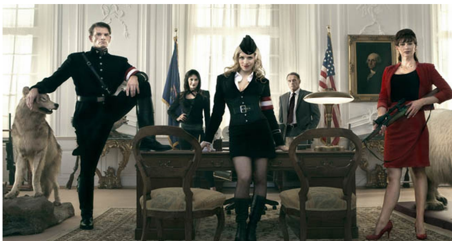
(Figur 10. Nazisterna från månen kommer för att erövra jorden i filmen Iron Sky)