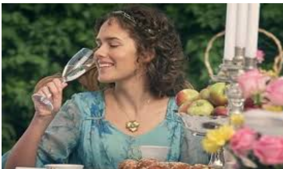
(Figur 6. Lucie försöker bryta sig loss från det hon förväntas vara i filmen Där vi en gång gått)

Där vi en gång gått är ett persondrama och en historisk skildring. Filmen utspelar sig under flere decennier i Helsingfors före och efter inbördeskriget. En stor del av handlingen kretsar kring den excentriska Lucie som tillhör överklassen men förälskar sig i en ung fotbollsstjärna från arbetarklassen. Lucie kämpar mellan att bete sig och tänka som den överklassflicka hon är och sin dragning till Allu och arbetarklassen. I en scen diskuterar Lucie och hennes väninna Mickie om en gemensam bekants livssituation och hur deras bekanta blivit "avelskor".