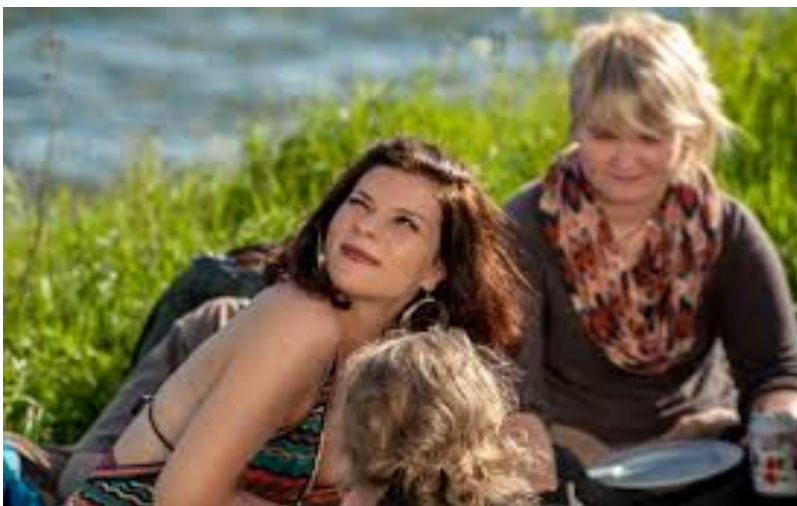
(Figur 5. Aino tror inte på äktenskap i filmen 21 tapaa pilata avioliitto)

21 tapaa pilata avioliitto är en komedi. Huvudpersonen Sanna tror att äktenskap i allmänhet är onaturligt. Hon skriver en avhandling om ämnet och intervjuar 21 par om deras syn på äktenskap. Själv är hon singel och gör en klar skillnad på vänskapsrelationer och sexrelationer. Sannas goda vän Ainos enda mål i livet är att hitta en man och bilda familj. Mot sin vilja blir Sanna förälskad under filmens gång och märker att kärlek och äktenskap kan i själva verket vara väldigt givande med rätt person. Kvinnorna talar givetvis sinsemellan väldigt mycket om män, men i ett par scener talar de om hur Sanna ska gå vidare med sin avhandling och om äktenskap i allmänhet.