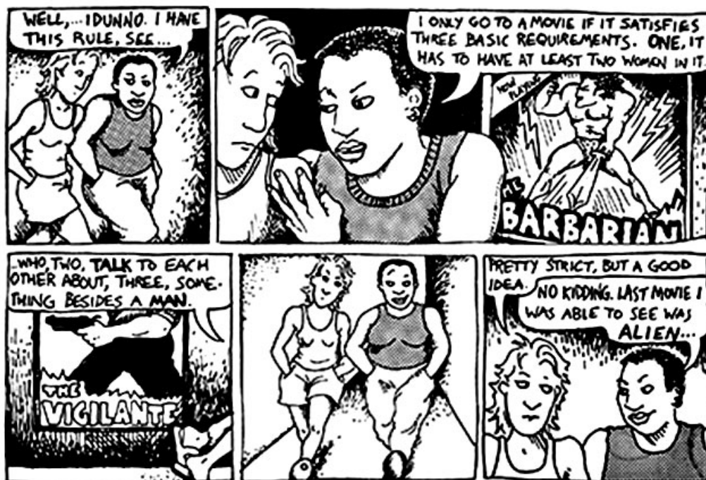
(Figur 1. Serieteckning ”The Rule” som utkom i albumet ”Dykes to watch out for” ursprungligen år 1985 (jfr Bechdel 2008)

Bechdel testets moder är den amerikanska serieförfattaren Allison Bechdel som illustrerade testet i sin serieteckning ”Dykes to watch out for” som kom ut 1985.