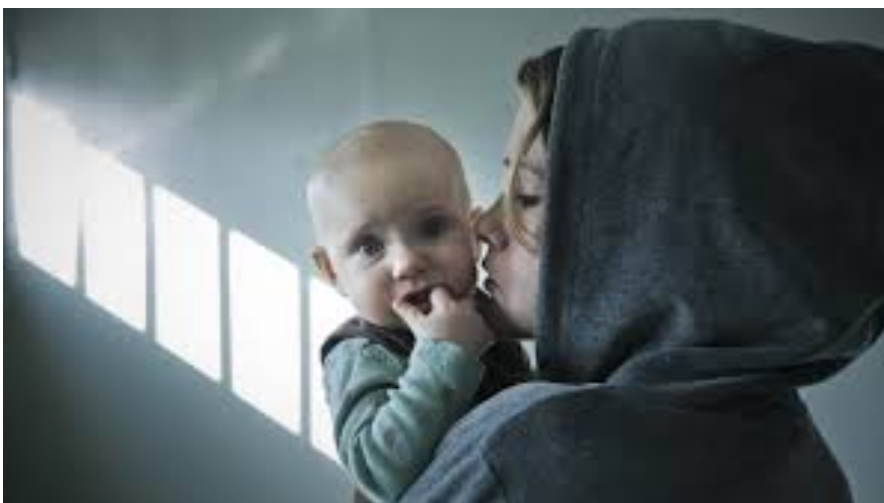
(Figur 8. Pike vill börja om sitt liv, fri från narkotika i filmen 8-pallo)