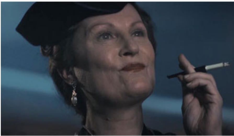
(Figur 9. Hella blir dömd för landsförräderi i filmen Hella W .)

Hella W är ett filmporträtt och drama över Hella Wuolijoki. Filmen handlar om Hella och hennes liv ända från tiden när Finland blev självständigt fram till 1940- talet. Hella gjorde under sin livstid många framgångsrika affärer i Europa, skrev de berömda teaterstyckena om Niskavuoren naiset och hade kamratliga relationer till Ryssland. Filmen tar fasta på hur Hella döms för landsförräderi då STAPO (statspolisen, idag säkerhetspolisen) ansåg henne vara en rysk spion. Hellas närmaste person och något av en bundsförvant är hennes dotter, Vappu. De diskuterar allt från situationen på hemgården till Hellas fängelsetid och Rysslands framtid.