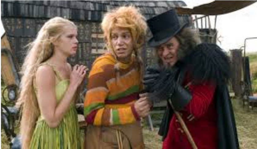
(Figur 4. Sähinä, en ung Rölli och den elaka cirkusdirektören i filmen Rölli ja kultainen avain)