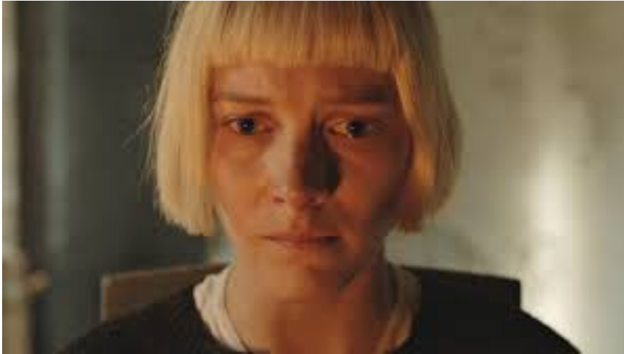
(Figur 7. En ung Aliide är hopplöst förälskad i sin systers man i filmen Puhdistus)