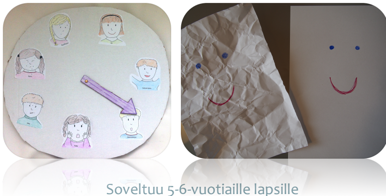
Soveltuu 5-6-vuotiaille lapsille

TAVOITE Tutustuminen ryhmään, tunteiden tunnistaminen