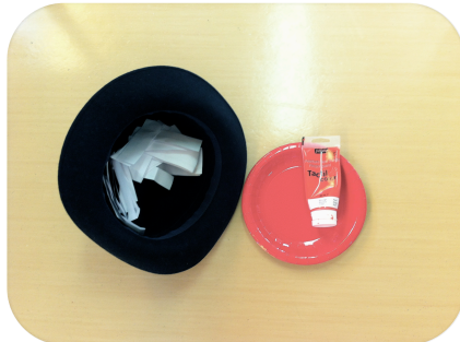
Soveltuu 5-6-vuotiaille lapsille

TAVOITE Empatiataitojen opettelu, anteeksipyyttäminen, oikean ja väärän tunnistaminen, ryhmähengen vahvistaminen