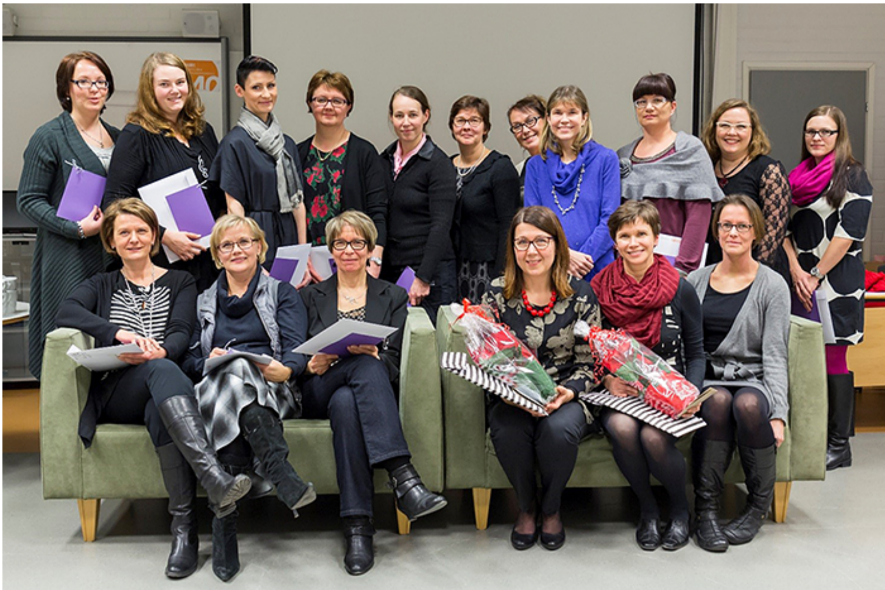
KUVA 3. Amokin ensimmäisen opinto-ohjaajakoulutuksen päätöstilaisuus