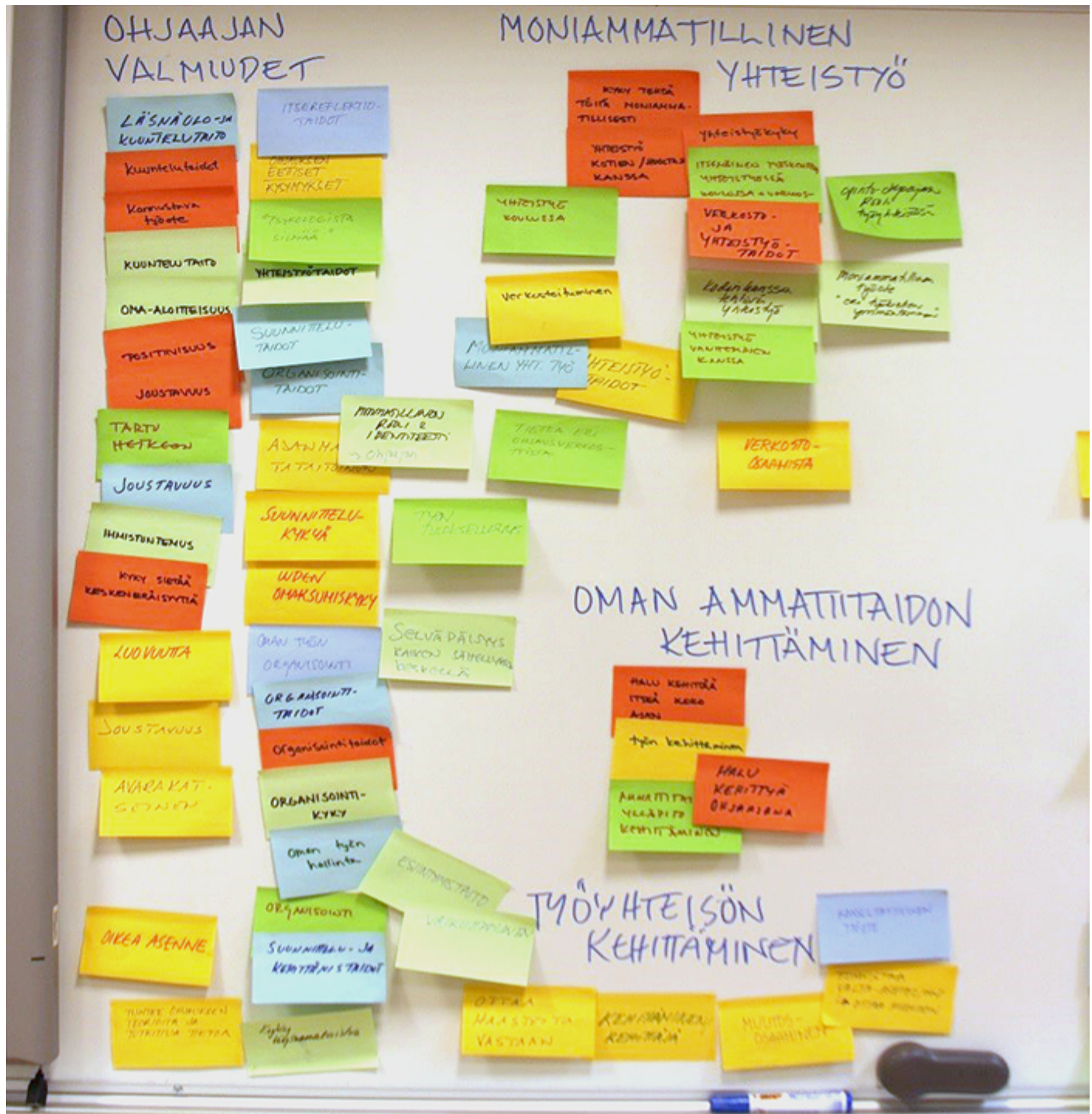
KUVA 1. Opinto-ohjaajan osaamisvaatimuksia

millaista osaamista työelämä vaatii opinto-ohjaajalta. Osallistujat tuottivat pienryhmätyöskentelyssä 149 erilaista työelämän osaamisvaatimusta, joista osa jo hieman ryhmiteltyinä on näkyvillä kuvissa 1 ja 2.