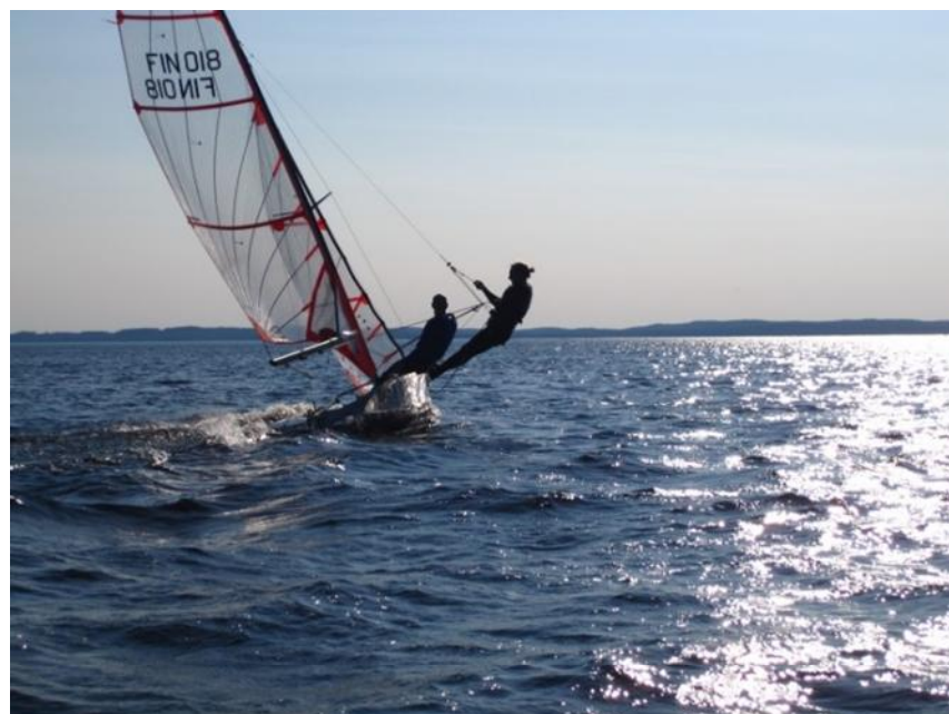
29er kiittää kohti auringon siltaa

Turvallisuudesta purjehdustoiminnan aikana huolehditaan kumiveneistä käsin, joita on kaksi. Lisäksi käytössä on suomi-vene jolla nuoriso opettelee moottoriveneen hallintaa, että voivat jatkossa toimia turvaveneen kipparina. Leiristä laaditaan turvallisuussuunnitelma. Siitä käy ilmi osallistujien tiedot, tiedot henkilökunnasta ja turvallisuus vastuista. Lisäksi se sisältää pelastus ja tiedotussuunnitelman. Tämä liitetään Kontiolahden leiriturvallisuus asiakirjaan, joka sisältää muun muassa riskianalyysit nuoriso- ja rippikoululeirien sekä kouluikäisten leirien osalta Hirvirannan leirikeskuksessa.