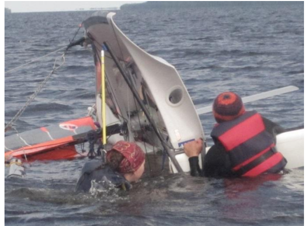
Kaatuminen kuuluu jollapurjehdukseen

Turvallisuudesta purjehdustoiminnan aikana huolehditaan kumiveneistä käsin, joita on kaksi. Lisäksi käytössä on suomi-vene jolla nuoriso opettelee moottoriveneen hallintaa, että voivat jatkossa toimia turvaveneen kipparina. Leiristä laaditaan turvallisuussuunnitelma. Siitä käy ilmi osallistujien tiedot, tiedot henkilökunnasta ja turvallisuus vastuista. Lisäksi se sisältää pelastus ja tiedotussuunnitelman. Tämä liitetään Kontiolahden leiriturvallisuus asiakirjaan, joka sisältää muun muassa riskianalyysit nuoriso- ja rippikoululeirien sekä kouluikäisten leirien osalta Hirvirannan leirikeskuksessa.