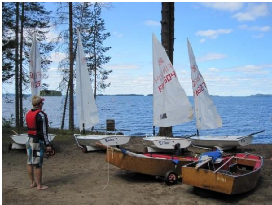
Optimisti-jollat, Zoom8:t ja Höytiäisen Hirviselkä

Vuosikymmen aikana on talkoo voimin kunnostettu vanhasta majoitusrakennuksesta venevaja kaluston korjaamista ja säilytystä varten. Samoin talkoovoimin yhdessä nuorten kanssa on ensin kunnostettu, vieläkin käytössä olevat, optimistijollat sekä Windmill. Vuosittain talkooleiriläiset keväällä tekevät pieniä pintakorjauksia sekä vahaavat veneet kesää varten valmiiksi. Vähitellen vuosien varrella on tehty hankintoja ja ostettu zoom8-jollia sekä viimeisimpänä 29er skiff luokan jollia, jotka yhdessä muodostavat kaluston tämän hetkisen rungon. Lisäksi käytössä on ollut kansainvälinen 505 sekä Vikla.