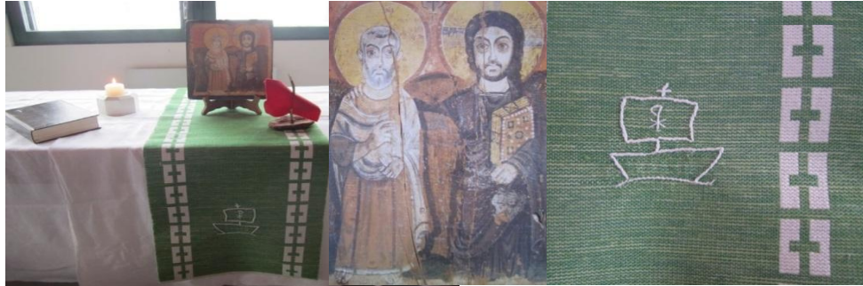
Hiljaisuuden talon alttari, Ystävyyden ikoni sekä nuorisotyön ”arkiliina”

Hiljaisuuden talossa istutaan lattialla. Alttaritaulun kesäaikaan muodostaa näkymä järvelle useasti auringonlaskun kera. Iltahartaus muodostuu rauhallisesta musiikista, yhteislaulusta, Raamatun luvusta, hiljaisesta hetkestä, saarnapuheesta ja rukouksesta.