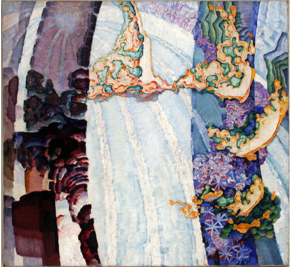
František Kupka: Kosmické Jaro II (Kosminen kevät II) 1911-20 Narodni Galerie, Praha

Mielenkiintoinen, ennen huomaamattomani asia oli myös Creation -teoksen tiivis yhteys noihin molempiin maalauksiin. Se oli merkitty vuosille 1911-20, kuten Kosmicke Jaro II , saman kokoinen, samalla seinällä. Myös tässä maalauksessa oli nähtävissä vaaleiden alueiden useat kerrokset - Kupka on sitäkin keventänyt runsaasti vuosien varrella. Myöskin aihe kolahti sillä ymmärsin jatkumon: Luominen jota seuraa kosminen kevät. Täräyttävää! Miksei kukaan hehkuta tätä sarjaa?