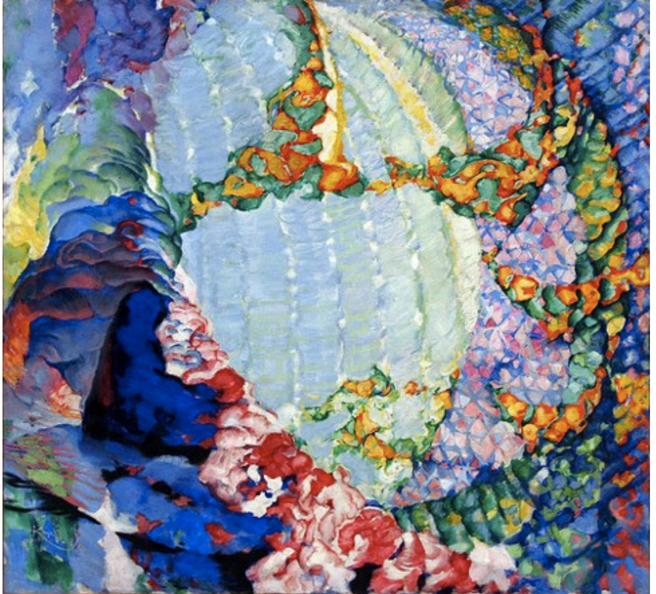
František Kupka: Kosmické Jaro (Kosminen kevät) 1910-11 (Narodni Galerié, Praha)