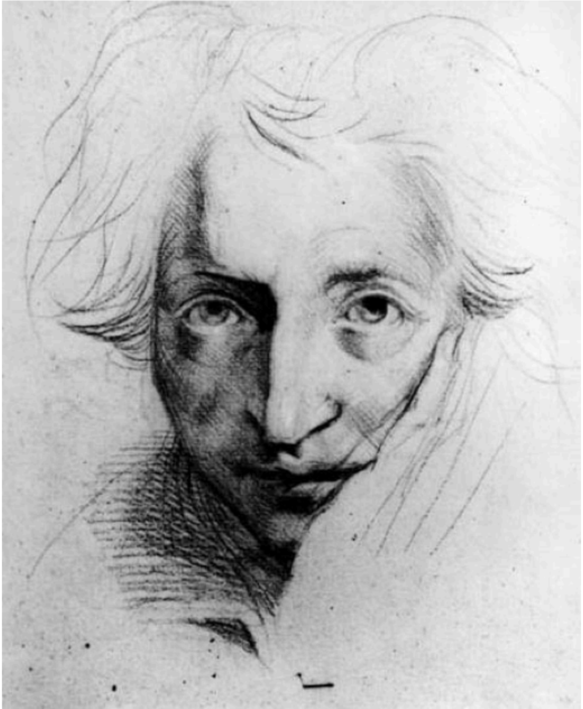
Heinrich Füssli: Omakuva