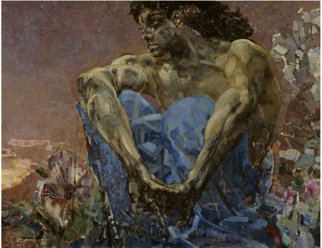
Mihail Lermontovin demoni M. Vrubelin tulkitsemana: The Demon Seated (yksityiskohta) 1890 (Tretjakovin galleria, Moskova)