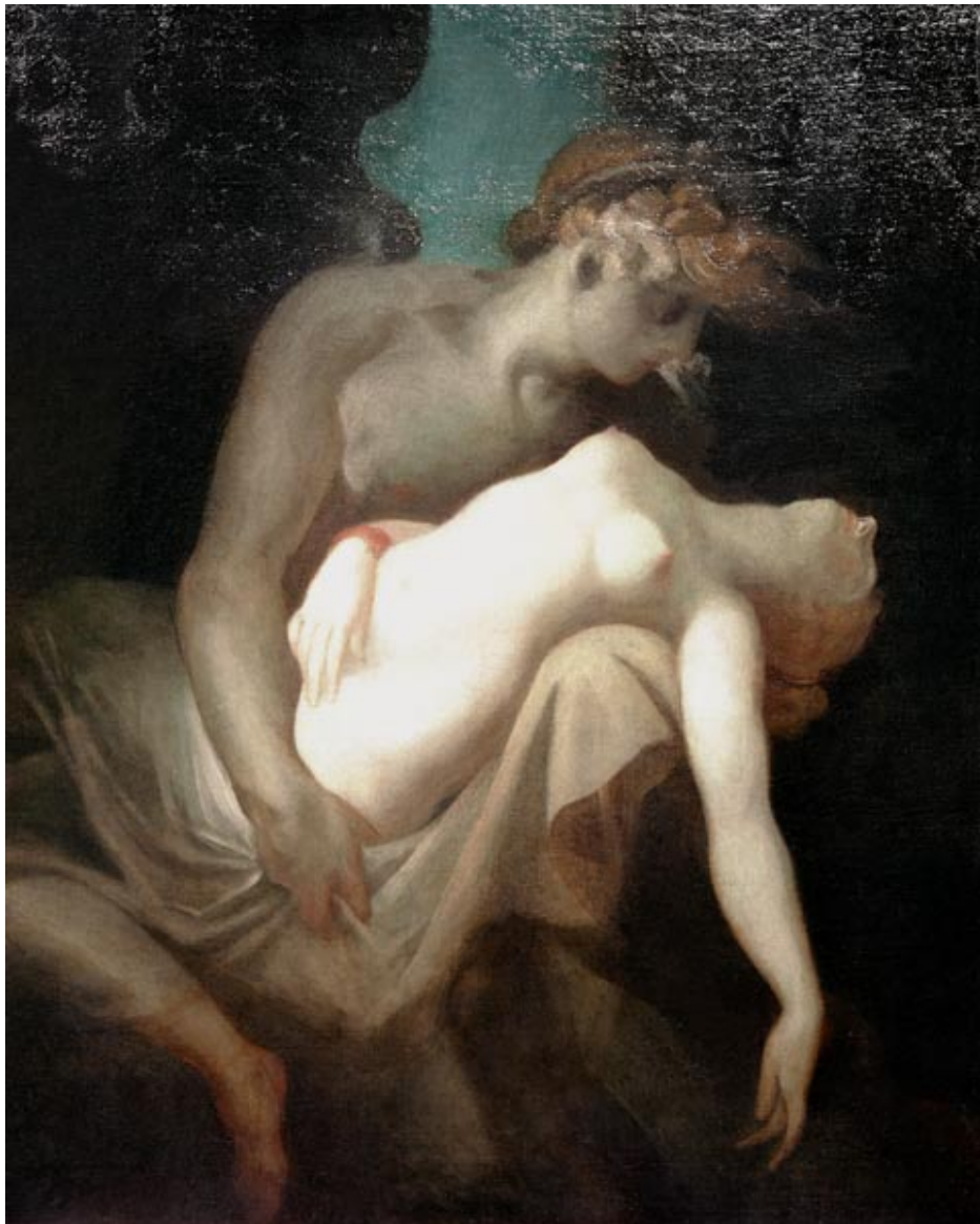
Amor und Psyche Johann Heinrich Füssli 1810 (Kunsthaus Zürich)