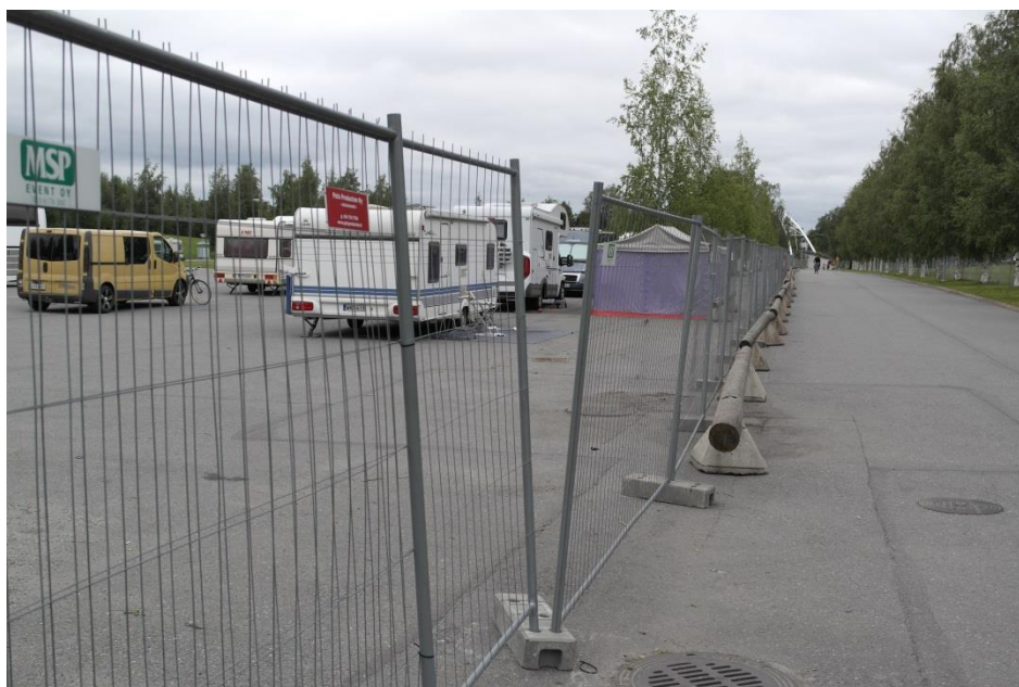
Kuva 6: Karavaanialueen aita

Asuntoautoalueen vieressä oli verkkoaita ja verkkoaidan edessä alueen ulkopuolella jo paikalla olleet puutukkiesteet, joiden korkeus oli n. 40-50 cm. Tukeista olisi saanut hyvän tuen, jos olisi halunnut kiivetä aidan yli eikä aidan toisessa päässä - portista katsottuna - ollut minkäänlaista vartiointia. Asuntoautoalueella oli jonkin verran ihmisiä, mutta ei jatkuvasti, joten sisälle pääseminen olisi ollut mahdollista. Enemmän haittaa olisi tullut ulkopuolisista kävelytiellä kulkijoista, jotka olisivat nähneet yritykset päästä leirialueelle. Aitaa ei ollut kiinnitetty kaikissa kohdissa kunnolla, vaan siitä olisi voinut painautua läpi alueelle (kuva 6.).