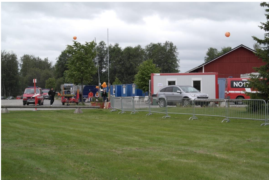
Kuva 7: Pääportti ja turvan kontti

Parkki- ja koulutusalueen avoimuus tuli aiemmin esille. Parkkialueella ei ollut vietävää irtaimistoa, mutta työkaluilla voi tunkeutua murtautua autoihin ja viedä joko niiden sisältä tavaraa tai koko auton. Parkkialue oli kaukana muusta leiritoiminnasta, joten järjestyksenvalvojia ei näkynyt usein paikan päällä, jolloin aikaa suorittaa murtautuminen olisi ollut enemmän. Koulutusalue oli parkkialueen vieressä. Siellä ei ollut koulutustelttoja lukuun ottamatta mitään vietävää koulutusten ulkopuolella, sillä tarvikkeet tuotiin koulutustilaisuuksiin paloautoista tai varastoista. Tarkkailija lähestyi leirialuetta toisena päivänä puiden seassa kulkevaa kävelypolkua pitkin (kuva 8.), josta siirtyi koulutusalueen kautta telтта-alueelle. Hänelle ei tehty pistotarkastusta rannekkeen osalta. Tarkkailija sai kävellä rauhassa telтта-alueelle asti, jossa ei ollut valvontaa, koska suurin osan leiriläisistä osallistui koulutuksiin.