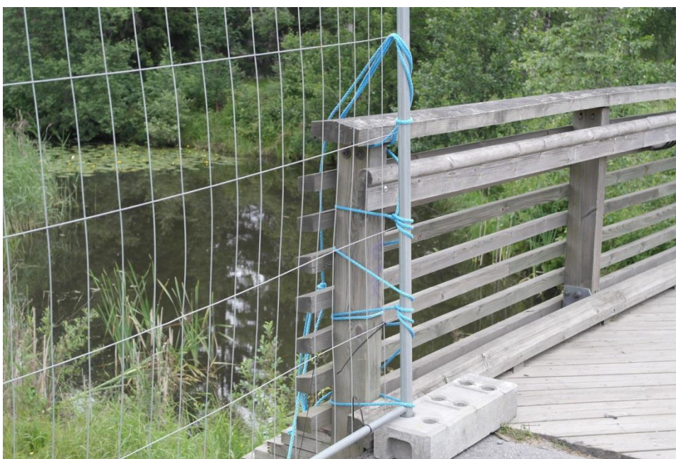
Kuva 5: Siltaan sidottu verkkoaita

Toisen portin luona, joka sijaitsi sillan lähellä, oli verkkoaita solmittu vahvasti kiinni siltaan (kuva 5.). Tätä aitaa ei olisi ollut helppo liikuttaa tai hajottaa ilman työkaluja. Portilta näkyi sillalle ja järjestyksenvalvoja istui tuolilla portin vieressä, mutta ei katsonut koko aikaa sillan suuntaan. Alueelle hyppääminen olisi onnistunut, mutta pudotusta oli n. 1,5 metriä alaspäin viettävälle nurmikolle. Sisäänpääsy siis onnistuisi, mutta samaa reittiä takaisin tuleminen minkään raskaamman kantamuksen kanssa ei olisi mahdollista. Siltaa pitkin liikkui myös päiväsaikaan jatkuvasti ihmisiä, joten huomaamattomasti ei leirialueelle olisi päässyt. Hypätessä olisi myös mahdollista loukata itsensä, joten tämä kohta ei ollut oletettavin paikka josta ulkopuolinen olisi tullut leirialueelle.