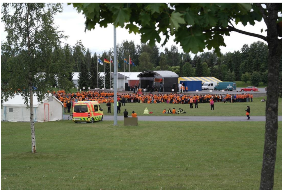
Kuva 9: Kokoontumisalue ja avajaiset

Leirialueen turvallisuuden kannalta kriittisimmät hetket olivat yhteiset ohjelmat. Leirin avajaisien aikana teltta-alue tyhjeni täysin, koska kaikki siirtyivät kokoontumispaikalle lavan eteen (kuva 9.). Teltat olivat tyhjillään eikä valvontaa ollut järjestyksenvalvojien toimesta aktiivisesti. Toimistokonteista suurin osa oli lukittu, joten niiden sisälle ei päässyt. Huollon remontoijat työskentelivät jatkuvasti konttialueen ja pääportin luona, mutta he eivät kiinnittäneet huomiota kehenkään liikkujaan. Järjestyksenvalvojat partioivat leirialueen reunamia myös autoilla, mutta suurin osa partioista suoritettiin polkupyörillä. Päiväsaikaan partiointi keskittyi asuntoauto- ja kanttiinialueille.