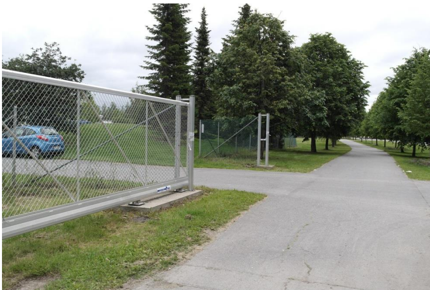
Kuva 4: Auki oleva rahtiportti

Toisen portin luona, joka sijaitsi sillan lähellä, oli verkkoaita solmittu vahvasti kiinni siltaan (kuva 5.). Tätä aitaa ei olisi ollut helppo liikuttaa tai hajottaa ilman työkaluja. Portilta näkyi sillalle ja järjestyksenvalvoja istui tuolilla portin vieressä, mutta ei katsonut koko aikaa sillan suuntaan. Alueelle hyppääminen olisi onnistunut, mutta pudotusta oli n. 1,5 metriä alaspäin viettävälle nurmikolle. Sisäänpääsy siis onnistuisi, mutta samaa reittiä takaisin tuleminen minkään raskaamman kantamuksen kanssa ei olisi mahdollista. Siltaa pitkin liikkui myös päiväsaikaan jatkuvasti ihmisiä, joten huomaamattomasti ei leirialueelle olisi päässyt. Hypätessä olisi myös mahdollista loukata itsensä, joten tämä kohta ei ollut oletettavin paikka josta ulkopuolinen olisi tullut leirialueelle.