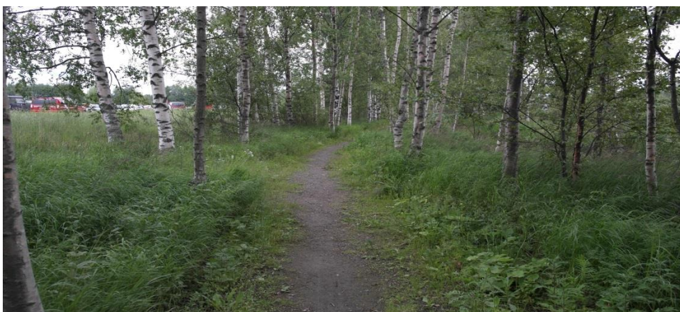
Kuva 8: Koulutusalueen vieressä kulkeva kävelypolku

Parkki- ja koulutusalueen avoimuus tuli aiemmin esille. Parkkialueella ei ollut vietävää irtaimistoa, mutta työkaluilla voi tunkeutua murtautua autoihin ja viedä joko niiden sisältä tavaraa tai koko auton. Parkkialue oli kaukana muusta leiritoiminnasta, joten järjestyksenvalvojia ei näkynyt usein paikan päällä, jolloin aikaa suorittaa murtautuminen olisi ollut enemmän. Koulutusalue oli parkkialueen vieressä. Siellä ei ollut koulutustelttoja lukuun ottamatta mitään vietävää koulutusten ulkopuolella, sillä tarvikkeet tuotiin koulutustilaisuuksiin paloautoista tai varastoista. Tarkkailija lähestyi leirialuetta toisena päivänä puiden seassa kulkevaa kävelypolkua pitkin (kuva 8.), josta siirtyi koulutusalueen kautta telтта-alueelle. Hänelle ei tehty pistotarkastusta rannekkeen osalta. Tarkkailija sai kävellä rauhassa telтта-alueelle asti, jossa ei ollut valvontaa, koska suurin osan leiriläisistä osallistui koulutuksiin.