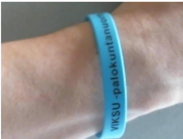
Kuva 2: Viksu - ranneke

Rannekkeen väärentäminen olisi värin kannalta voinut onnistua, sillä mikä tahansa keltainen tai vaalean sininen nauha olisi kauempaa katsottuna näyttänyt oikealta. Lähempi tarkastelu olisi paljastanut rannekkeen materiaalin eroavaisuuden ja tekstin puutoksen tai sen vajavaisuuden. Rannekkeen väärentäminen ei olisi helpoin tapa päästä alueelle ja se vaatisi ensin leirialueen tarkkailua, jotta näkisi minkä väriset rannekkeet olisivat käytössä. Itse tekstiä ei kiikareiden tai kameran avulla erottaisi.