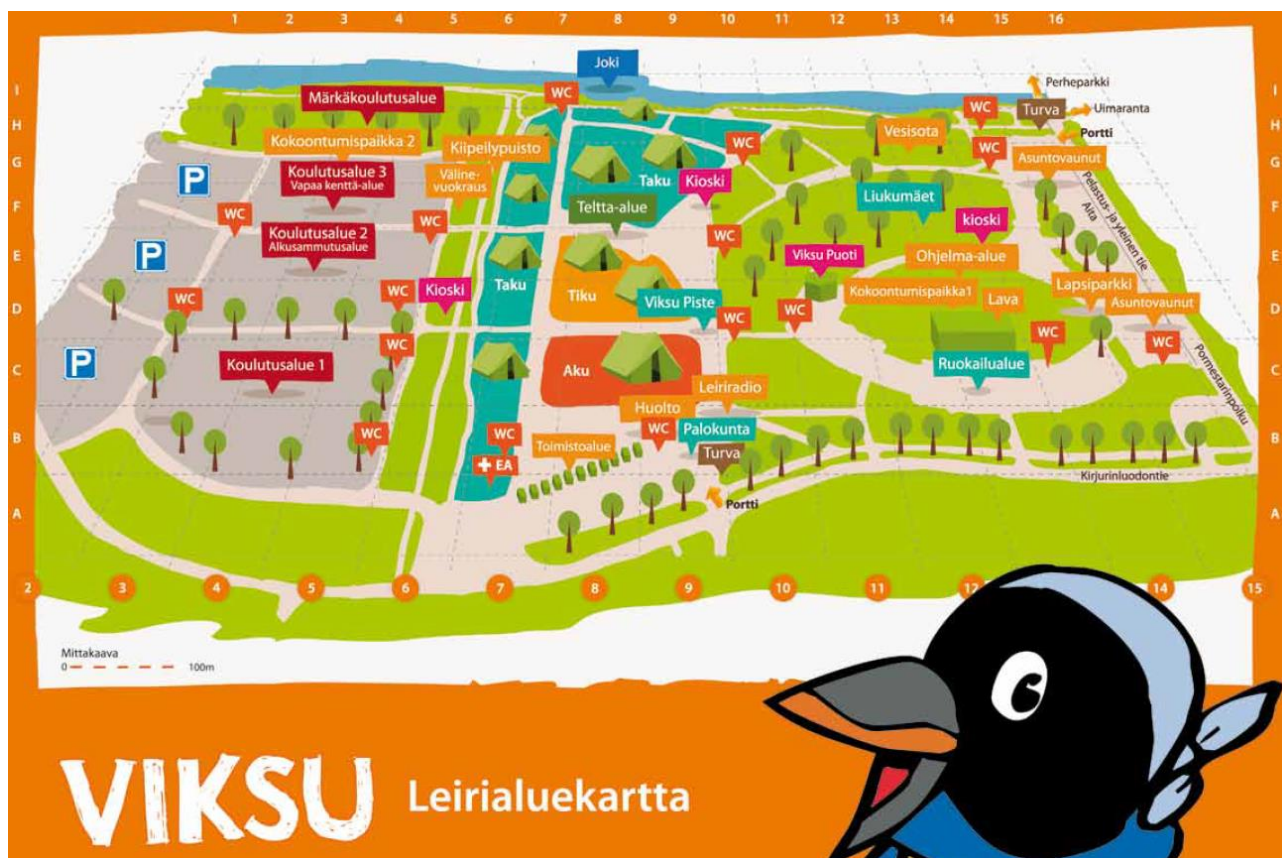
Kuva 1: Leiriaapisen leirialuekartta