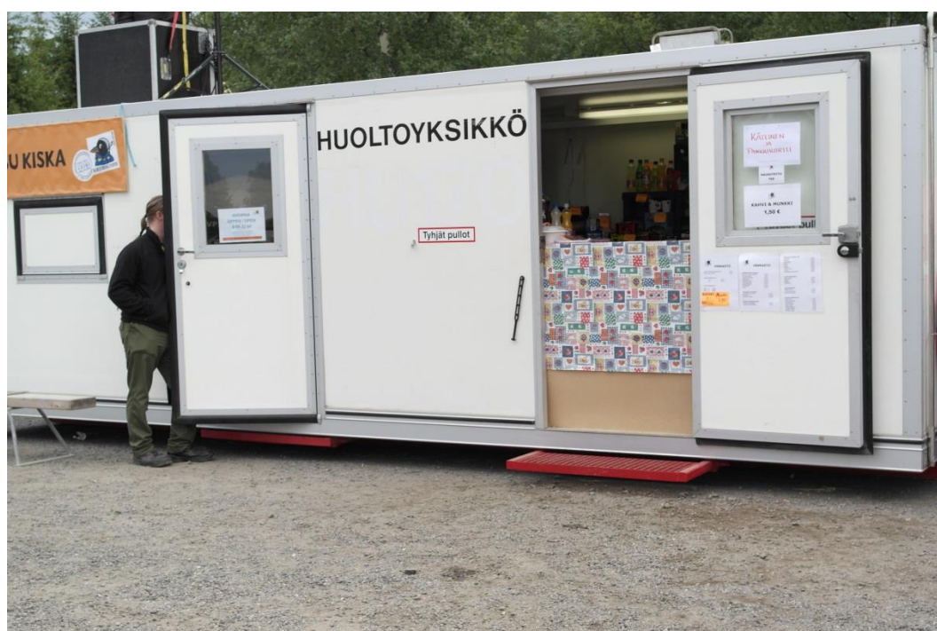
Kuva 10: Tekijä kioskin ovella

oveen (kuva 10). Myyjille hän kertoi ennalta kehitetyn tarina, kuinka Porin poliisi oli ilmoittanut turvalle kaupungin alueella liikkuvista taskuvarkaista. Tästä syystä järjestyksenvalvojat olivat päättäneet yhdessä kioskvastaavan kanssa hakea kioskin rahat säilöön turvan omalle kontille. Myyjä hämmentääkseen tekijä kertoi vielä vastaavan nimen keskustelun yhteydessä, jotta hän vaikuttaisi olevan leiriorganisaation työntekijä. Jos tekijältä olisi kysytty ranneketta, olisi se ollut teltassa. Vapaapalokuntaa kysyttäessä tekijä olisi kertonut jonkun ennalta valitun vpk:n nimen, sillä jokaisessa paloautossa luki jonkin vpk:n nimi ja useamman teltan edessä oli myös nimikyltti.