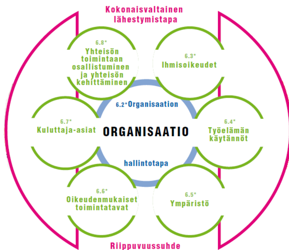
Kuvio 2: Yritysvastuun ydinaiheet