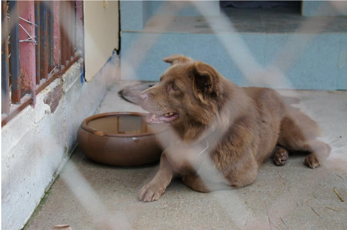
Kuva 25. Kuvassa etualalla näkyvä aitauksen verkko tuo kuvaan hieman karua tunnelmaa.