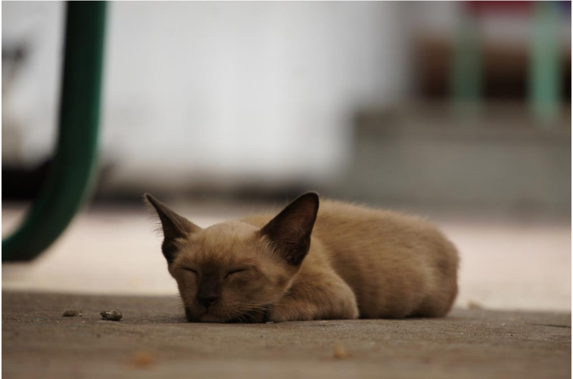
Kuva 29. Kohteen ympärille on jätettävä hieman tilaa jotta kuvasta ei tulisi liian tunkkainen.