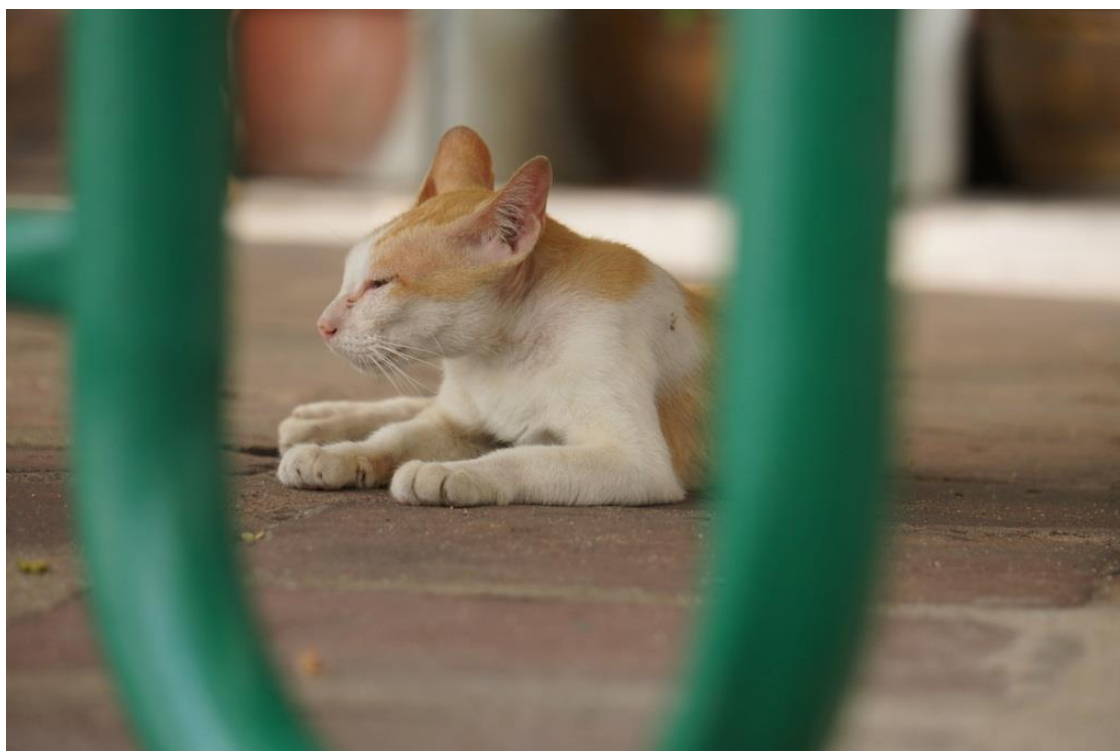
Kuva 3. Temppeelialueella asuva kissa on tyytyväisen oloinen nukkuessaan ruokapöytien alla.

Buddhalainen uskonto on osana katueläinongelmaa. Eläimiä hylätään usein temppeelialueille ja siellä asuvat munkit ruokkivat niitä koska niiden surmaaminen ei ole hyväksyttävää. (Kuva 3. ja 4.) Monet paikalliset ovat tietoisia tästä buddhalaisuuden säännöstä ja käyttävät sitä hyväkseen halutessaan eron lemmikeistään. Tämä johtaa koira- ja kissapopulaatioiden kasvamiseen temppeelialueilla ja eläimet lisääntyvät helpommin. Toisaalta buddhalainen uskonto on eläimille hyväksi koska niillä on hyvä mahdollisuus tulla ruokituksi päivittäin. Ne saavat elää omaa rauhallista elämäänsä Thaimaan kaduilla ja puistoissa saaden samalla helposti ravintoa hyvää karmaa haluavilta buddhalaisilta.