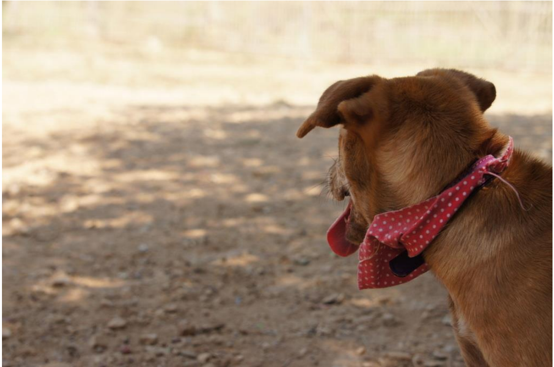
Kuva 24. Leikkihetki puistossa.

metallikaltereita. (Kuva 25.) Varsinkin tällaisista kuvista näkee millaisissa oloissa eläimet oikeasti asuvat. En ole yrittänyt olla hienovarainen kuvia ottaessani vaan tarkoitukseni on ollut näyttää asiat mahdollisimman totuudenmukaisesti vaikka se tarkoittaisikin surumielisiä tai raakoja valokuvia.