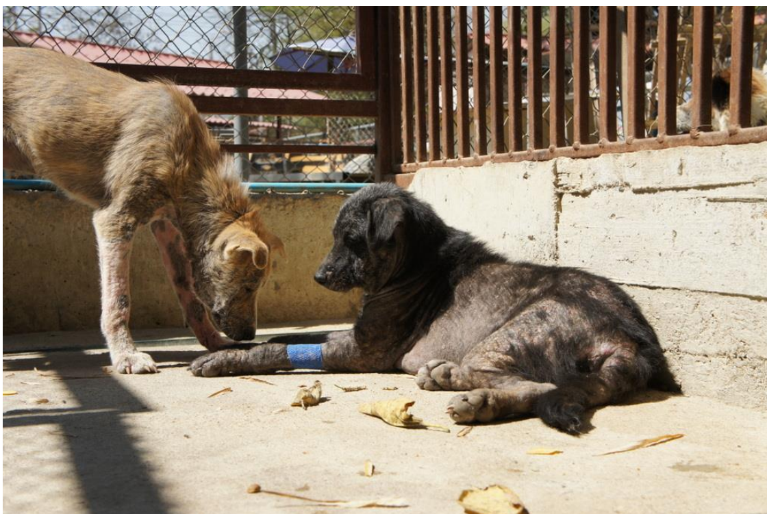
Kuva 6. Kuvan koirilla on ikävän näköinen iho, sillä niillä on molemmilla vakava syyhy. Tämän vuoksi niiden aitauksessa kävi harvoin vierailijoita.

Thaimaalaiset välttävät fyysistä kontaktia eläinten kanssa sillä ne mielletään hyvin likaisiksi. Eläimillä uskotaan olevan sairauksia ja raivotauti onkin sairauksista pelätyin. Koirat ovat usein loukkaantuneita, niillä on iho-ongelmia tai muita näkyviä sairauksia, joten niiden oletetaan olevan vihaisia ja tautisia eivätkä ihmiset siksi halua koskea niitä tai antaa niille huomiota. (Kuva 6.) Tämä on toisaalta positiivinen asia niin ihmisille kuin eläimillekin: molemmat lajit antavat toistensa olla rauhassa ja elää omaa elämäänsä ilman konflikteja. (Kuva 7.)