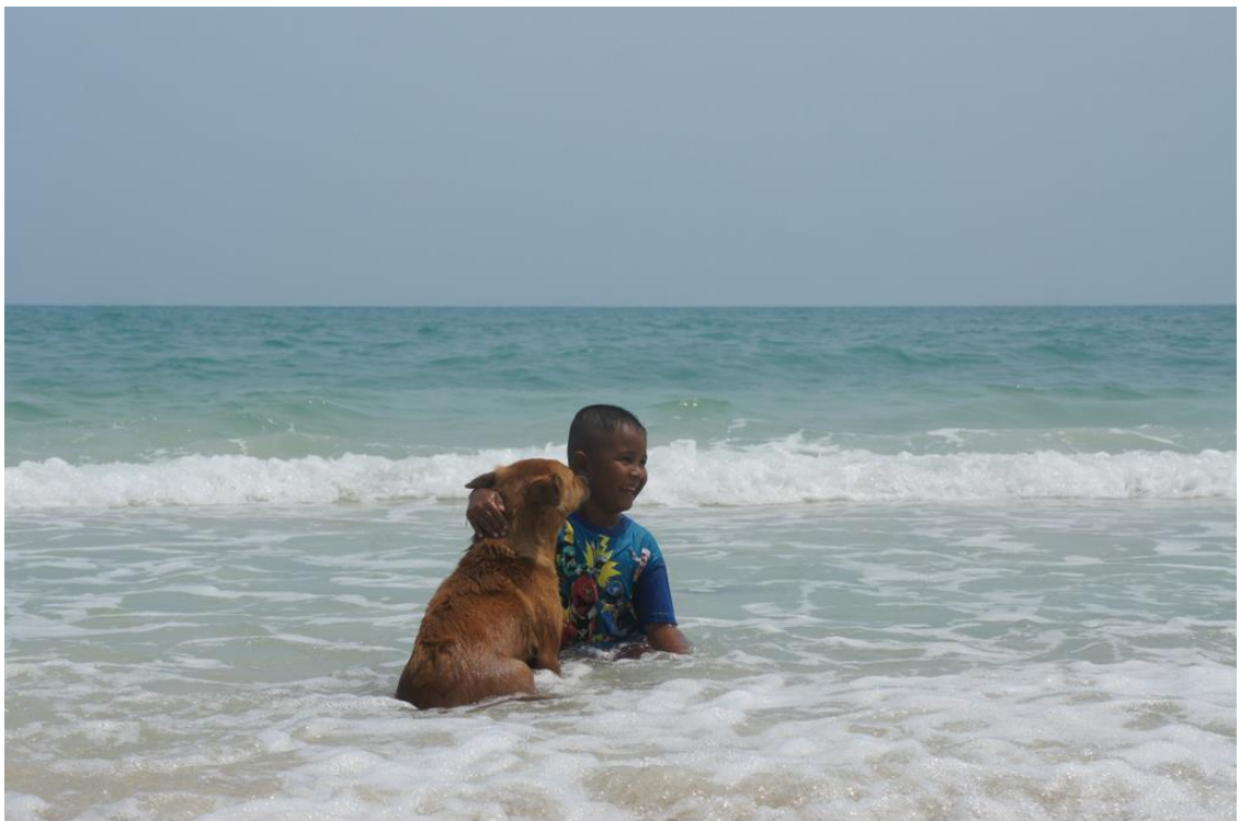
Kuva 18. Koira nautti pojan halauksista.