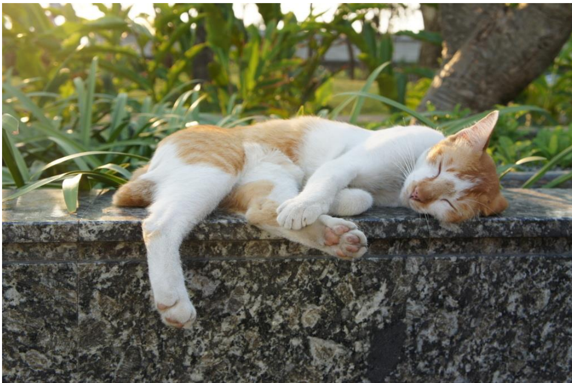
Kuva 2. Kissa loikoilee puistonpenkillä auringonvalossa.