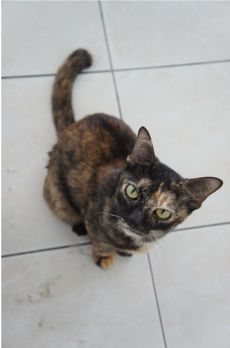
Kuva 8. Kuvan kissa kerjasi ruokaa katuravintolan tiloissa ja se saikin useita maittavia aterioita. Kissan annettiin oleskella ravintolassa, koska sen läsnäolo ei haitannut työntekijöitä eikä ruokailijoita.