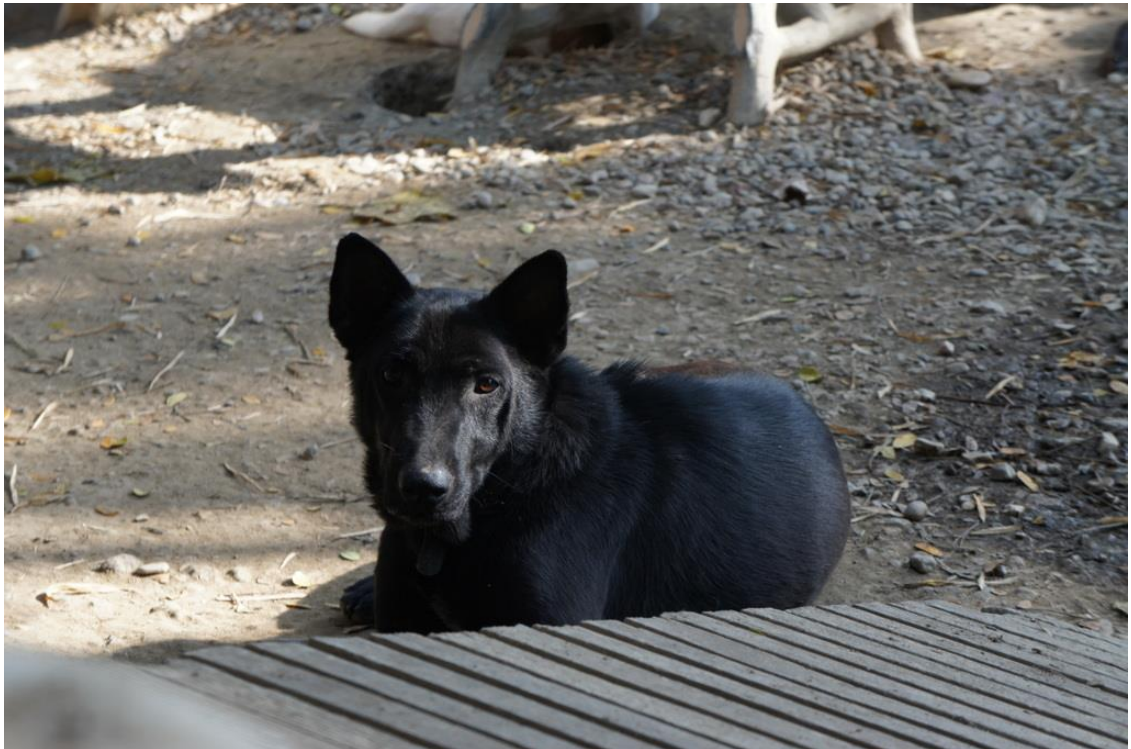
Kuva 13. Kuvan koira ei ollut täysin varma siitä olenko uhka vai ystävä. Se päätti kuitenkin jäädä lähistölle tutkailemaan touhujani, mutta pysyi turvallisen välimatkan päässä.