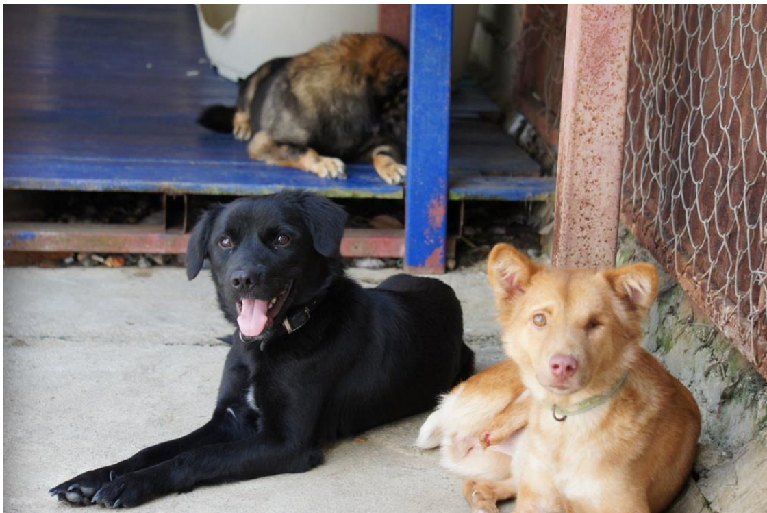
Kuva 14. Oikeanpuoleisen koiran toinen silmä on poistettu, mutta se pystyy silti elämään normaalia elämää. Koira on kuitenkin varmuuden vuoksi siirretty asumaan pienempään aitaukseen muiden rauhallisten koirien kanssa.