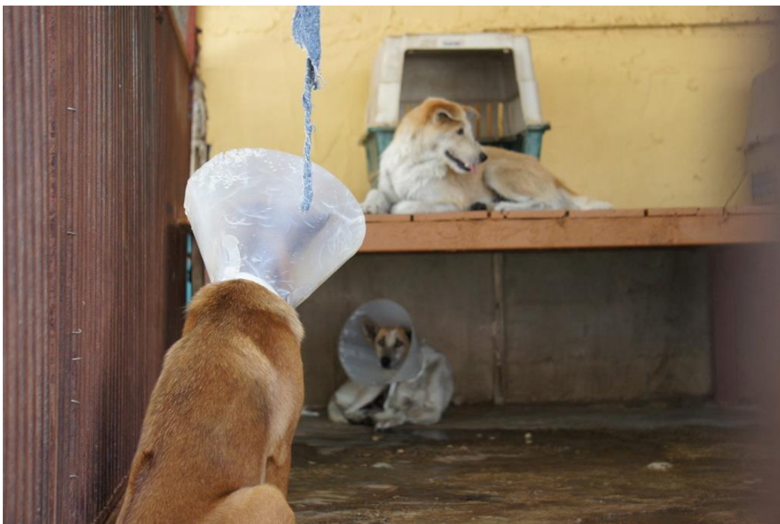
Kuva 10. Leikkauksesta toipuvia koiria.