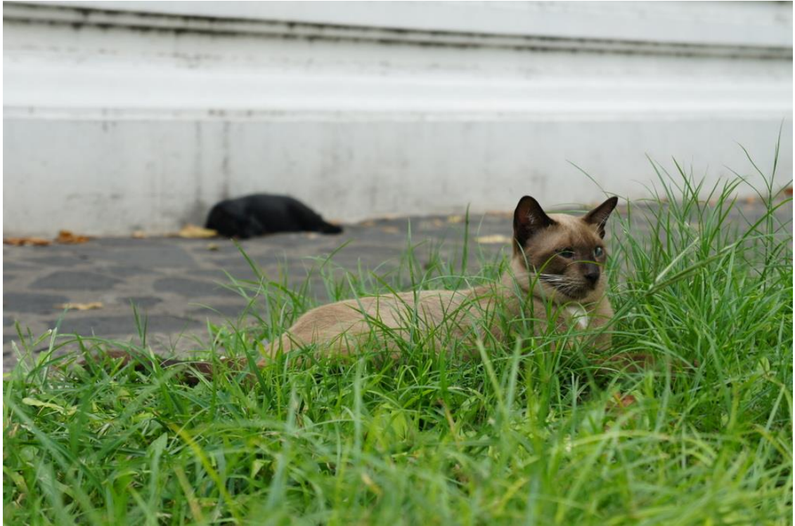
Kuva 16. Kuvan kissa olisi varmasti lähtenyt paikalta jos olisin lähestynyt sitä enemmän tämän kuvan saadakseni. Sain kuvan kuitenkin otettua käyttämällä pitkää linssiä jossa on tehokas zoomi.

Päätettyäni opinnäytetyöni aiheen tiesin että minun on hankittava kameraani uusi erityisen pitkä linssi, jonka avulla saan otettua kuvia pitkän matkan päästä eläintä häiritsemättä. Katueläimiä nähtyäni ymmärsin niiden olevan ujoja, pelokkaita ja ehkä hieman aggressiivisiakin, joten halusin mahdollisuuden ottaa valokuvia kauempaa sekä oman että eläimen turvallisuuden vuoksi. En halua tehdä kuvauskohdettani epämukavaksi tai saattaa itseäni vaaraan. Hankin pitkän linssin jonka avulla saan hyvälaatuisia kuvia jopa kymmenien metrien päästä. Pitkä linssi oli tehokas varsinkin kissojen valokuvaamisessa sillä eläimet usein piiloutuivat minut nähdessään. Luulenkin suuren osan kuvistani olleen mahdollisia ainoastaan tehokkaan linssin ansiosta.