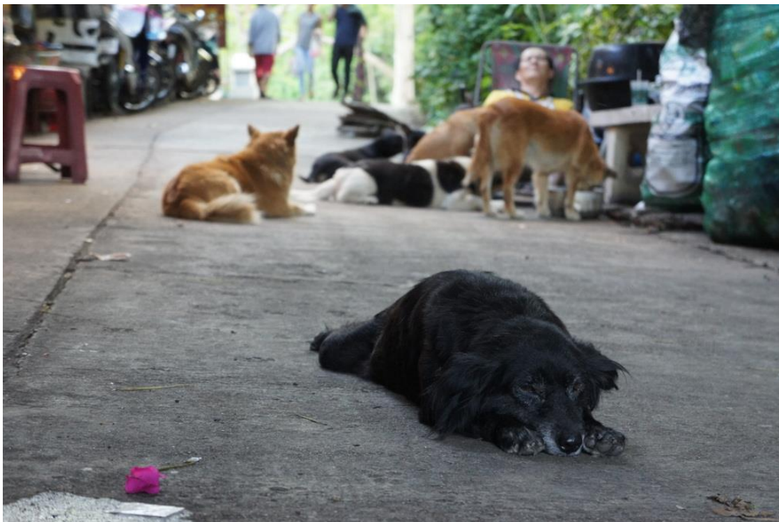
Kuva 5. Koirat nukkuvat missä tahansa, tarvittaessa myös keskellä tietä.

Kaupunkialueella asuminen on eläimille vaarallista. Katueläimet ovat selviytyäkseen kuitenkin oppineet suunnistamaan liikenteen seassa. Koirat odottavat usein suoja tiellä liikennevalojen vaihtumista tai seuraavat ihmisjoukon liikkeitä ja näin ylittävät kadun turvallisesti. Vilkas liikenne on joskus kuitenkin ylivoimainen ja niin koirat kuin kissatkin joutuvat usein autojen tai moottoripyörien töytäisemäksi tai yliajamaksi.