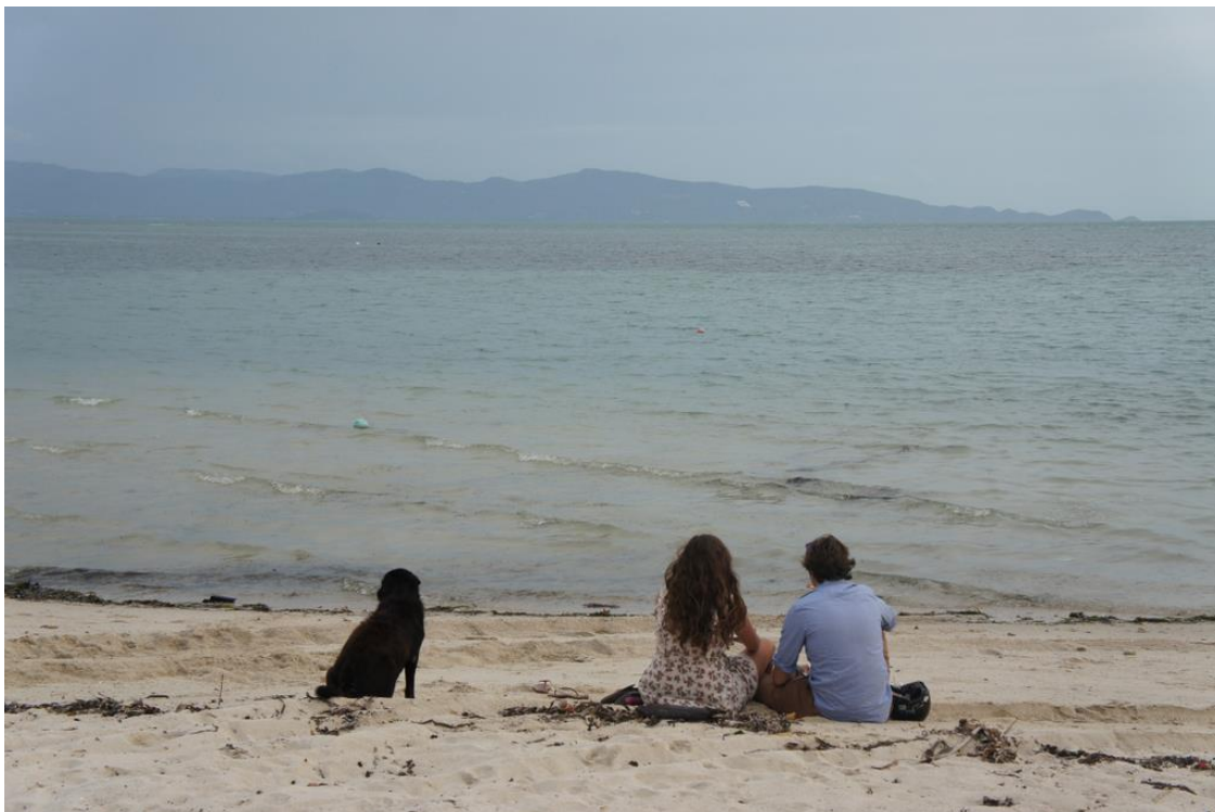
Kuva 7. Katukoira päätti istua rannalla oleskelevan pariskunnan viereen. Meren ihastelu sujui kaikilta ilman ristiriitoja.

Jotkut eläinrakkaat turistit pitävät koirien ja kissojen läsnäolosta ravintoloissa ja hotelleissa joten he ruokkivat niitä ja antavat niille huomiota. Tämä hämmentää eläintä ja se luulee löytäneensä uuden omistajan koska siitä pidetään huolta ja se saa säännöllisesti ruokaa. Joskus eläinten ruokkiminen johtaa ikävään lopputulokseen siinä vaiheessa kun turisti jatkaa matkaansa. Jos eläin jää viettämään aikaa ravintolan tai hotellin tiloihin odottaen uutta ruokkijaa ja seuraava vieras valittaakin eläimen läsnäolosta niin on paikan omistajan reaktio yleensä joko eläimen häätäminen pois tai sen myrkyttäminen. Eläin saattaa lisäksi menettää oman reviirinsä ja joutua muiden alueella elävien koirien tai kissojen uhriksi harhaillessaan niiden reviirille. Turisteja kehotetaan välttämään eläinten ruokkimista ja niille huomion antamista jotta vahinkoja ei sattuisi.