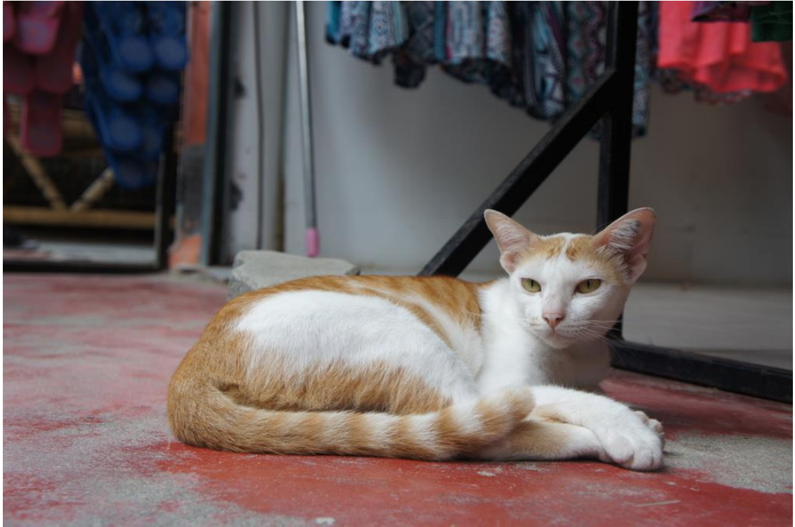
Kuva 28. Saadakseni tämän kuvan laskeuduin aivan maantasolle.

Salamavalon käyttöä kannattaa välttää sillä salama säikäyttää eläimen helposti. Luonnonvalo olisikin suositeltava sillä se tuo kuvaan kirkkautta ja värit näyttävät luonnollisemmilta. Kuviin on lisäksi hyvä jättää hieman tyhjää tilaa kaikkiin reunoihin. (Kuva 29.) Liian täysinäinen kuva on tunkkainen ja sitä on epämiellyttävä katsoa. Jos eläin katsoo vasemmalle on sen silmien eteen jätettävä hieman tilaa jotta kuvaan saa luotua tunnelman että eläin katsoo jotakin. (Walker 2008, 76) (Kuva 30.) Näin valokuvaan saa enemmän sisältöä ja katsoja voi käyttää mielikuvitustaan kuvaa katsoessaan, esim. keksiä mikä on saanut eläimen huomion. Kameraan katsova eläin olisi hyvä sommitella kultaisen leikkauksen kohdalle, eli leveys suunnassa hieman vasemmalle tai oikealle.