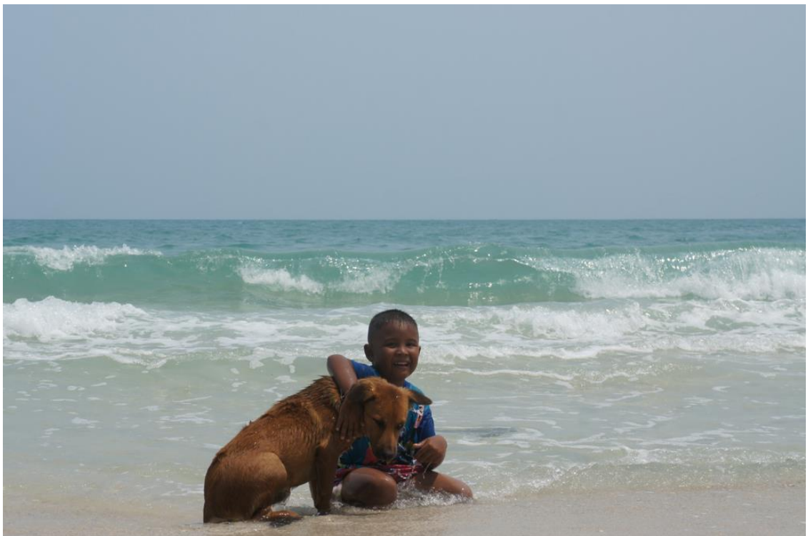
Kuva 20. Kaverukset nauttivat meren viileydestä kuumana kesäpäivänä.