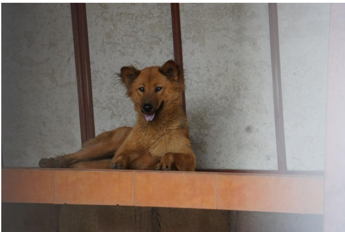
Kuva 11. Kemoterapiassa käyvä TVT-koira.