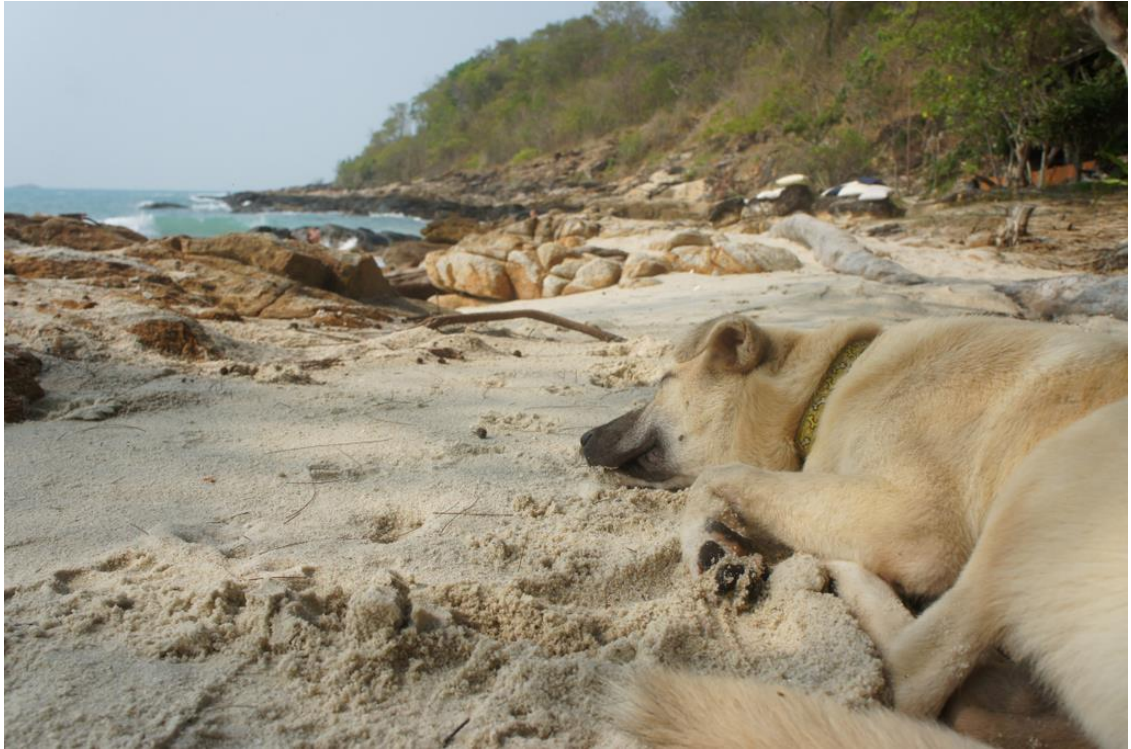
Kuva 27. Hetki rantakoiran elämästä.

Valokuvatessa ei aina ole aikaa suunnitella kuvakulmia sillä eläimet liikkuvat ja poistuvat paikalta nopeasti. Varsinkin katueläimiä kuvatessa on hyvä vähentää kaikkien osapuolten stressiä mahdollisimman paljon suorittamalla valokuvaus nopeasti ja tehokkaasti. Ennen valokuvausta on hyvä ennakoida koko prosessi etukäteen ja kuvauksen aikana päätöksiä on tehtävä nopeasti. Tilannetta helpottaa myös jos on tiedossa millaisissa oloissa eläimet oleskelevat ja kuinka pelokkaita ne ovat. Yhdelle polvelle, suurinpiirtein eläimen silmien tasolle laskeutuminen on suositeltavaa sillä näin kuvat saa eläimen perspektiivistä ja kuvia on miellyttävämpi katsoa. (Walker 2008, 64) Eläimen silmät näyttävät luonnollisemmilta kun ne on suunnattu suoraan eteenpäin eikä ylös ihmisen kasvojen korkeudelle. Samalla eläimen asento on luontevampi. (Kuva 28.)