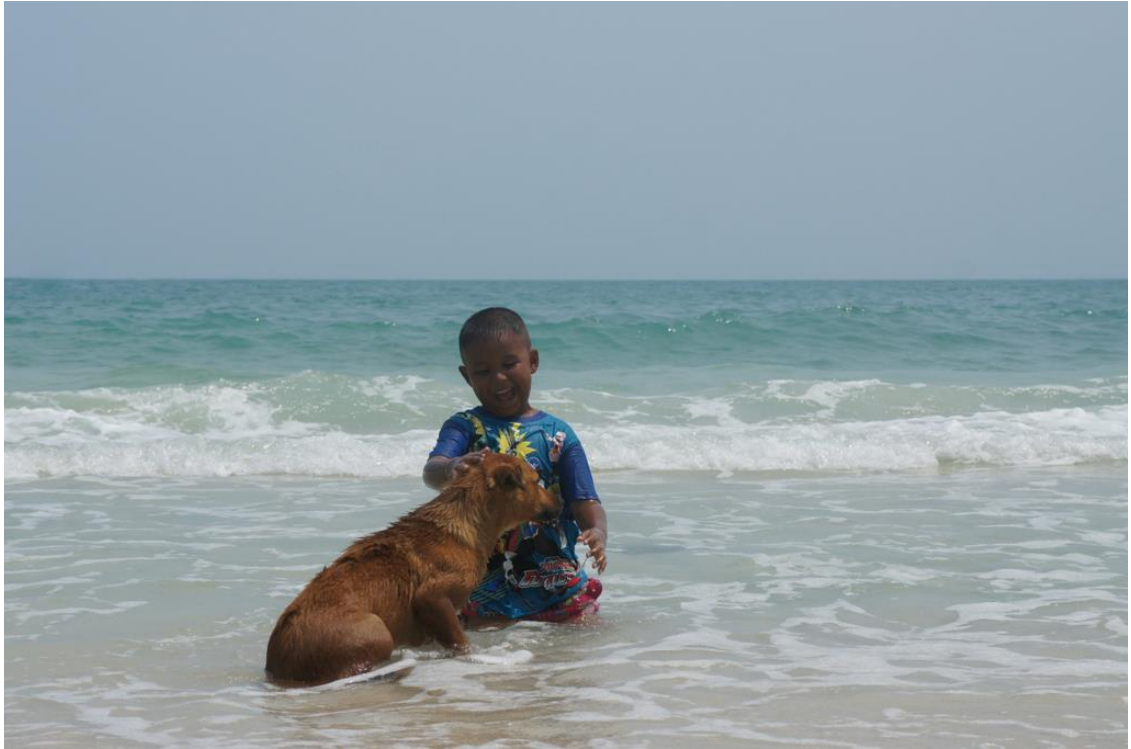
Kuva 19. Leikkimielistä tutustumista.