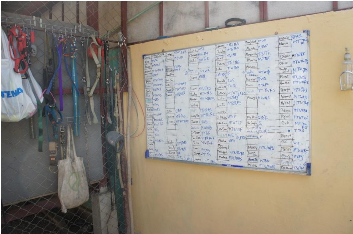
Kuva 12. Koirien ulkoiluttamisesta pidetään tarkkaa listaa.

Oma kokemukseni Care for Dogs-järjestössä oli kaikenkaikkiaan positiivinen. Tilat olivat mielestäni siistit ja turvalliset, koirat vaikuttivat tyytyväisiltä ja hyvin ruokituilta. Joitain poikkeuksia tosin löytyi. Koirat jotka olivat sairaita käyttäytyivät hieman stressaantuneesti ja joskus koiranjätöksiä löytyi tiloista, joissa sitä ei saisi olla (esim. vapaaehtoisten oleskelutilasta). Vakavia koiratappeluita ei tapahtunut montaa ja jos koirat alkoivat syystä tai toisesta riitelemään niin siihen puututtiin välittömästi. Vapaaehtoistyöntekijät käsittelivät koiria huolella ja selvästi välittivät niistä. Koirat olivat kuitenkin varuillaan joidenkin thaimaalaisten työntekijöiden läheisyydessä ja todistinkin pariin kertaan kun thaimaalainen työntekijä käyttäytyi aggressiivisesti koiria kohtaan, esim. heitti niitä leikkipallolla. Se oli harmillista sillä tämä tapahtui usein pentuaitauksessa. Toivon kuitenkin ettei tarkoituksena ollut vahingoittaa koiria sillä thaimalaiset ovat usein lapsenmielisiä. Vakavampia tilanteita en kuitenkaan huomannut yhdeltäkään työntekijältä. Eläinlääkärit osasivat työnsä hyvin ja koirilla oli aina saatavilla raikasta vettä sekä varjoisa lepopaikka. Ruoka-aika oli kahdesti päivässä.