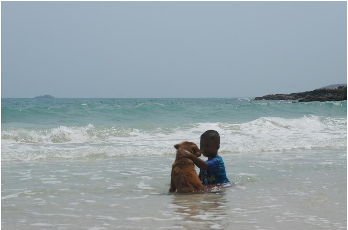
Kuva 17. Ensitapaaminen.