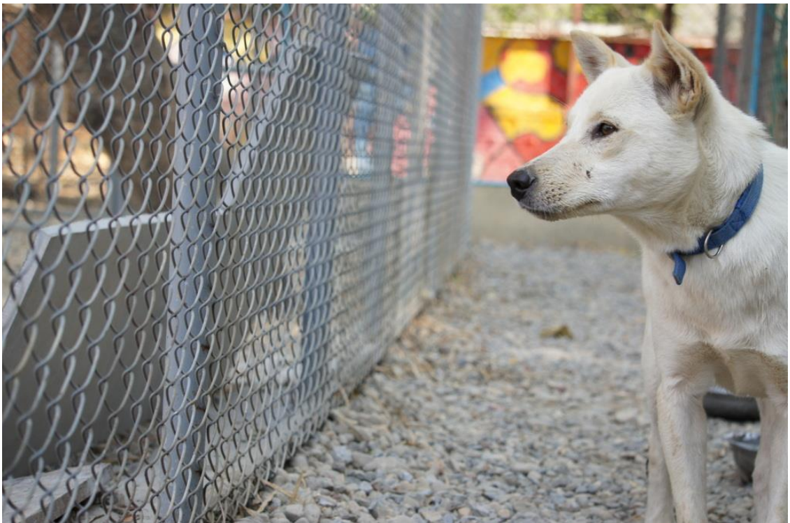
Kuva 30. On katsojan päätettävissä mikä on kiinnittänyt koiran huomion.