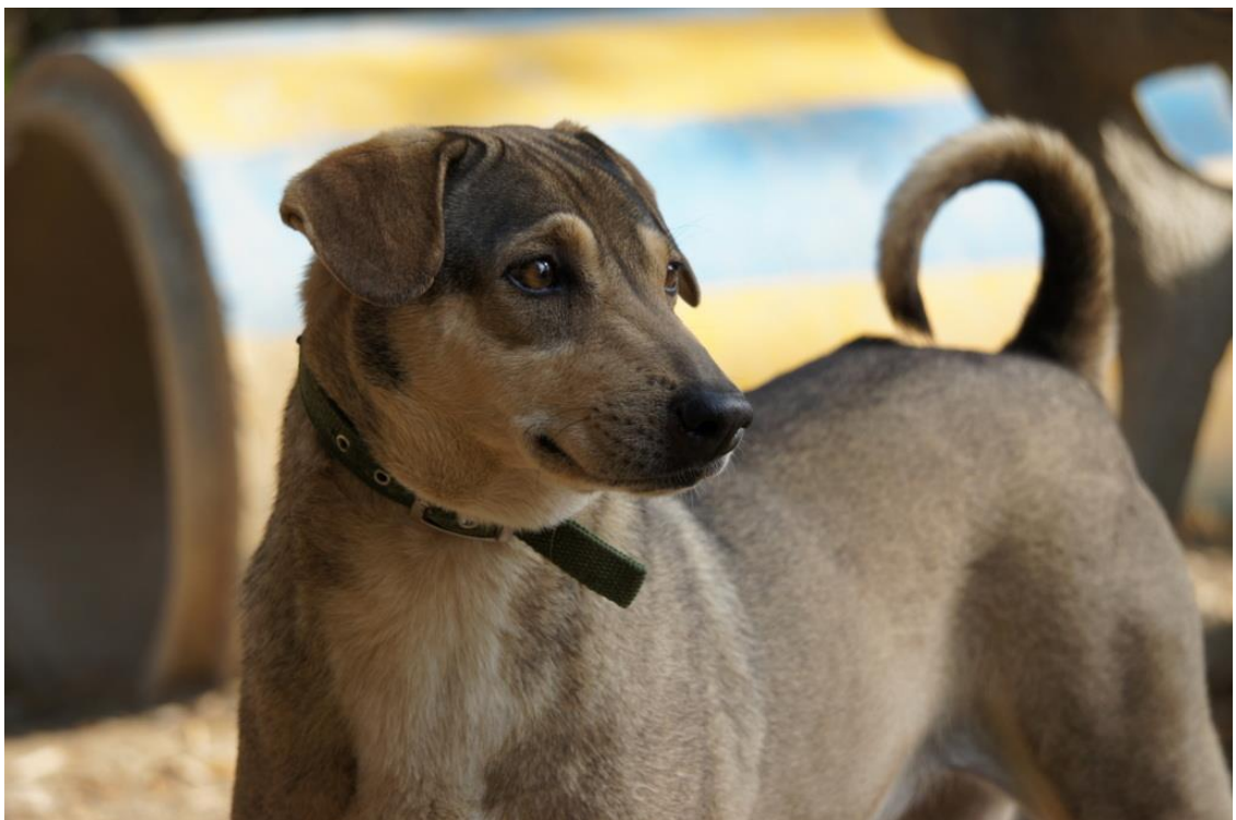
Kuva 26. Bella on yksi ujoimmista eläinjärjestön koirista, mutta se tottui läsnäolooni yllättävän nopeasti ja sainkin otettua siitä tämän kuvan, pidempää linssiä käyttämällä

On muistettava että katueläimet ovat usein laiminlyötyjä, hylättyjä ja niitä on ehkä pahoinpidelty. Eläimet ovat herkkiä eivätkä kaikki pidä ihmisen läsnäolosta. Jos valokuvaaja huomaa eläimen olevan etäinen ja ujo niin on se parempi jättää omiin oloihinsa. (Kuva 26.) Valokuvaaja ei saa loukata eläimen arvoa ja vaikka eläin ei oikeuksiaan itse ymmärräkään niin on sen oikeuksia kuitenkin kunnioitettava. Valokuvatessa on aina ajateltava eläimen parasta ja sen hyvinvointi on oltava etusijalla. Olen itse yrittänyt välttää vakavasti loukkaantuneiden eläinten valokuvaamista sillä en halua synnyttää liiallisia negatiivisia tunteita katsojissa. Eläimiin kohdistuvaan väkivaltaan reagoidaan varsinkin länsimaissa hyvin vahvasti ja suomalaisen on vaikea ymmärtää thaimaalaisen kulttuurin erilaisuus varsinkin jos hän ei ole koskaan matkustanut Kaakkois-Aasiassa ja nähnyt erilaista elämäntapaa paikanpäällä. Vakavissa tapauksissa, kuten pahoinpidellyn eläimen valokuvaamisessa, on mietittävä mitä kannattaa kuvata ja mitä jättää kuvaamatta. Kaikkea ei ole aina hyvä tuoda julki.