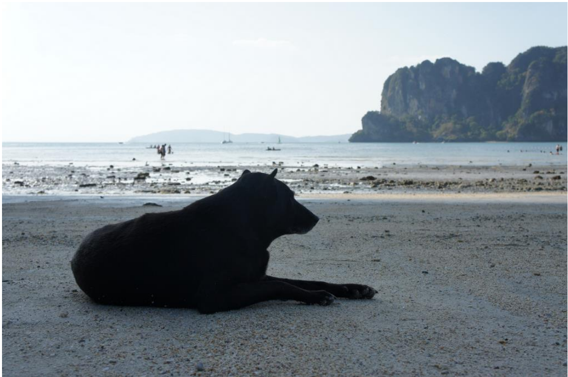
Kuva 22. Thaimaan rantakohteessa, Krabilla, asuva koira ihastelee laskuveden paljastamaa rannikkoa.

Thaimaassa on tunnetusti hyvin lämmin ja kostea ilmasto joka vaikuttaa myös valokuvaamiseen. (Kuva 23.) Auringonvalo toi usein hyvän valaistuksen kuviin eikä salamavalolle ollut tarvetta juuri lainkaan. Samalla kuitenkin pelkästään ulkona kävely toi hien pintaan ja lisäksi kannoin mukani kameralaukkua kaikkine tarvikkeineen ja useamman vesipullon. Tärkeintä ulkona liikkuesssa on nesteytys ja varjoisissa paikoissa pysyminen. Vaaleana suomalaisena ihon auringossa palaminen oli jokapäiväistä ja se vaikutti esim. kuvauskeikkojen alkamisaikoihin. Aamuisin ennen puoltapäivää ulkona ei ollut vielä liian kuuma, mutta puolenpäivän jälkeen liikkuminen oli erittäin epämukavaa sillä lämpötila pysyttelee Thaimaassa noin +30:n asteen paikkeilla ympäri vuorokauden. Yritin kuitenkin pysyä positiivisena ja otin ankarat kuvausolosuhteet vastaan yhtenä monista haasteista, joita projekti tuotti ja päätinkin selviytyi niistä voittajana. (Suonpää 2002, 45) Opettelin muistamaan parhaat valokuvausajat ja päivän kuumimpina tunteina pysyin sisällä. Haasteena oli myös paikallinen kieli sillä useat thaimaalaiset osaavat vain hieman englanninkieltä. Elekieltä on kuitenkin kaikkien helppo ymmärtää ja kun molemmilta osapuolilta löytyy hieman huumorintajua niin viestit menevät perille melko nopeasti.