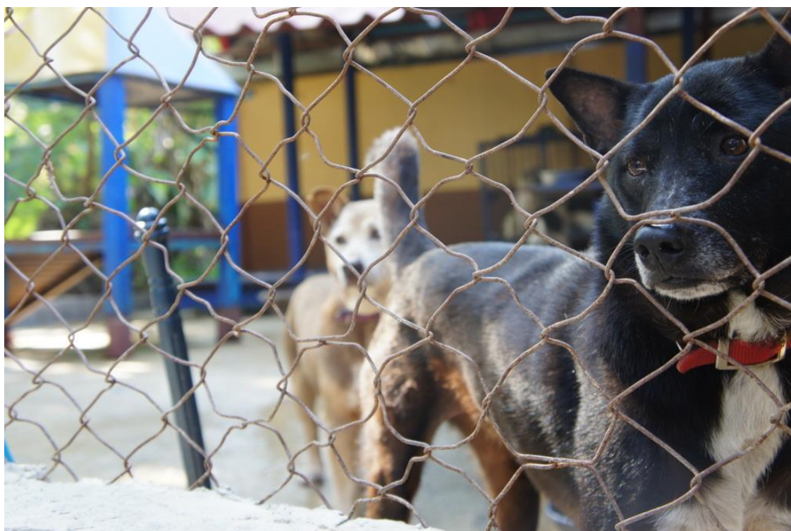
Kuva 21. Hieman surumielinen kuva näyttää eläinkodissa asuvan koiran näkökulman aitauksen takaa.

Halusin valokuvata eläimiä Thaimaan eri osissa sillä on mielestäni mielenkiintoista kuinka paljon eläinten elinolot vaihtelevat riippuen niiden kotikaupungista. Minulla ei ollut mahdollisuutta käyttää kuvaukseen studiota enkä olisi niin halunnutkaan, sillä studio ei ole eläimelle luonnollinen paikka eikä pyrkimyksenäni ollut saada täydellisiä valokuvia täydellisellä valaistuksella. Halusin enemmänkin tuoda esille eläimen elinympäristön ja eläimen luonteen. (Kuva 21. ja 22.)