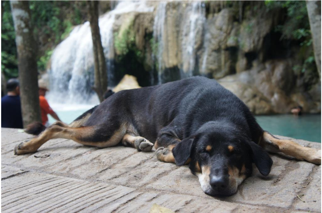
Kuva 23. Vesiputousten läheisyydessä oli erityisen hankala keskittyä valokuvaukseen ilman kosteuden vuoksi, mutta koirille se oli mukavan rentouttava paikka.

Katueläimiä valokuvatessa on hyvä muistaa tilanteen vaarallisuus. Eläimet ovat aina arvaamattomia huolimatta siitä kuinka kesyjä ja kilttejä ne ovat. Varsinkin eläinkodissa, jossa on useita isokokoisia koiria samassa tilassa, on oltava varovainen sillä koirat saattavat pelästyä valokuvaajaa tai valokuvauskalustoa ja siten hyökätä. Uteliaat koirat lähestyvät valokuvaajaa ja kun kaksi koiralaumaa kohtaa toisensa voi helposti syttyä tappelu. Kuvatessani Care for Dogs-järjestöllä koirat tappelivat päivittäin ja usein tilanne saatiin rauhoitettua vasta kun joku työntekijöistä ehti koirien väliin. Henkilövahinkoja ei kuitenkaan koskaan tullut.