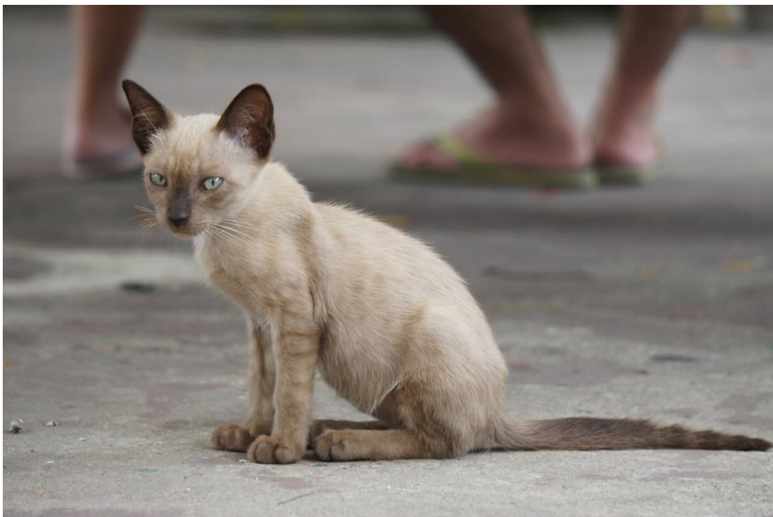
Kuva 4. Tempelialueiden eläimet saavat elää rauhassa buddhalaisten munkkien rinnalla.

Yksi suurimmista ongelmista on eläimistä tarttuvat sairaudet, kuten raivotauti ja erilaiset loiset. Raivotauti on paikallisten keskuudessa pelätyin tarttuvista taudeista ja siihen kuolee Thaimaassa vuosittain noin 200 henkeä. Kaikista Thaimaan raivotautitapauksista 70-95 prosenttia johtuu koiranpuremista. (Savvides 2013, 37) Eläimet ovat usein pelokkaita eivätkä ne anna ihmisten koskea tai lähestyä niitä. Pelokkuus saattaa joskus kehittyä aggressioksi ja eläimet voivat peloissaan hyökätä ihmisten kimppuun. Vaikkakin tämä on harvinaista niin se ei ole mitenkään mahdotonta. Esim. vuonna 2001 raivotautinen koira ehti purra 52 ihmistä yhdellä Bangkokin suurimmista markkina-alueista ennen kuin paikallinen vartija sai sen kiinni. (Savvides 2013, 37) Samalla marketilla on myös ollut myynnissä raivotautisia koiranpentuja. Tauti selvisi vasta eläinten menehdyttyä.