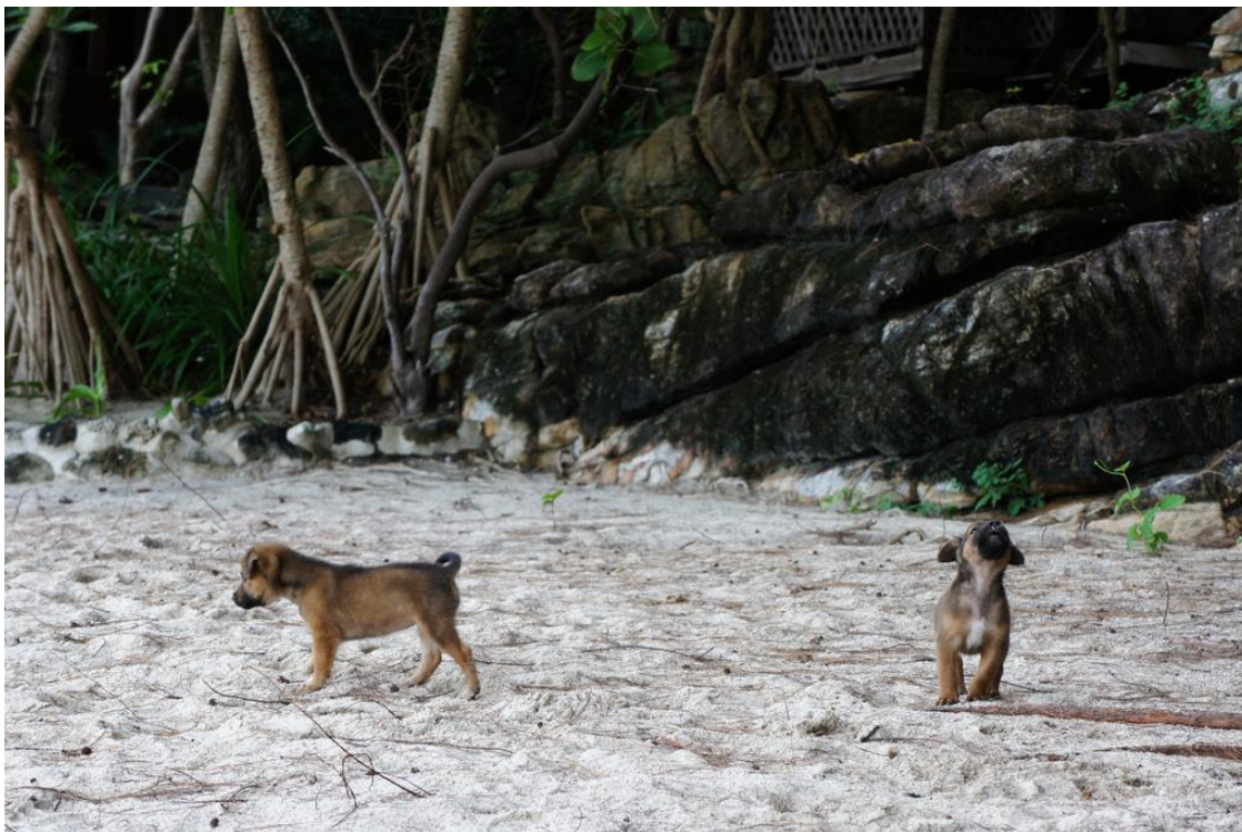
Kuva 1. Koiranpentu ulvoo nähtyään valokuvaajan.

Thaimaalaisen katukissan alkuperäisrotu on Siamilainen, joka on nimensä mukaan peräisin Siamista, nykyisestä Thaimaasta. Siamilainen kissa on hoikka, sen pää on kiilamaisen muotoinen ja häntä piiskamainen. Kissarodulle tyypillistä on lyhyt, ohut turkki ja se on luonteeltaan leikkisä ja vilkas. (Suomen Rotukissayhdistys ry 2015) Siamilaisen kissarodun tunnusmerkit täyttyvät useissa Thaimaan katukissoissa sillä ne ovat pienikokoisia ja siroja. Lisäksi Thaimaan katukissoille on tyypillistä tynkä tai kiemura häntä sillä se kulkee paikallisten kissojen geeneissä. Katukissat ovat harvinaisempi näky varsinkin kaupungeissa koska ne ovat hyvin säikkyjä ja vaikeasti lähestyttäviä. Onkin hankala sanoa kuinka monta katukissaa Bangkokissa tai Thaimaassa elää. Katukissoja adoptoidaan uusiin koteihin helpommin, koska ne ovat pienikokoisia ja helppohoitoisia. Ne piileksivät usein syvällä sivukatujen uumenissa ja tulevat esiin vain pimeän aikaan. Puistoalueilla ne loikoilevat kuitenkin auringonvalossa kaikkien nähtävillä. (Kuva 2.) Lomakohteissa kissat asustelevat usein hotellien ja ravintoloiden läheisyydessä ja varsinkin turistit ruokkivat niitä. Kissat elävät enimmäkseen ruoantähteillä mutta tarvittaessa ne metsästävät pieneläimiä kuten rottia, hiiriä, liskoja ja oravia.