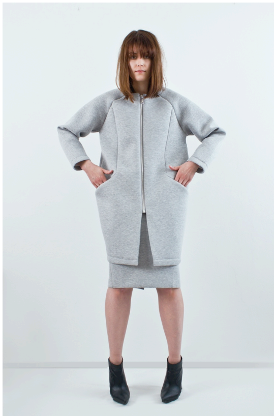
Kuva 1. Tyhjätasku