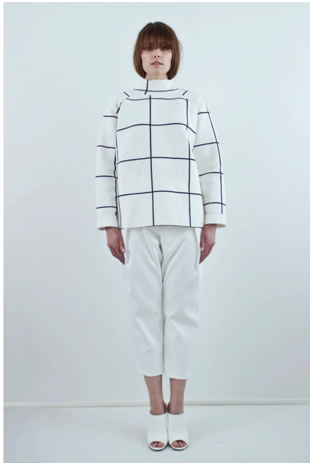
Kuva 3. Valkosuora