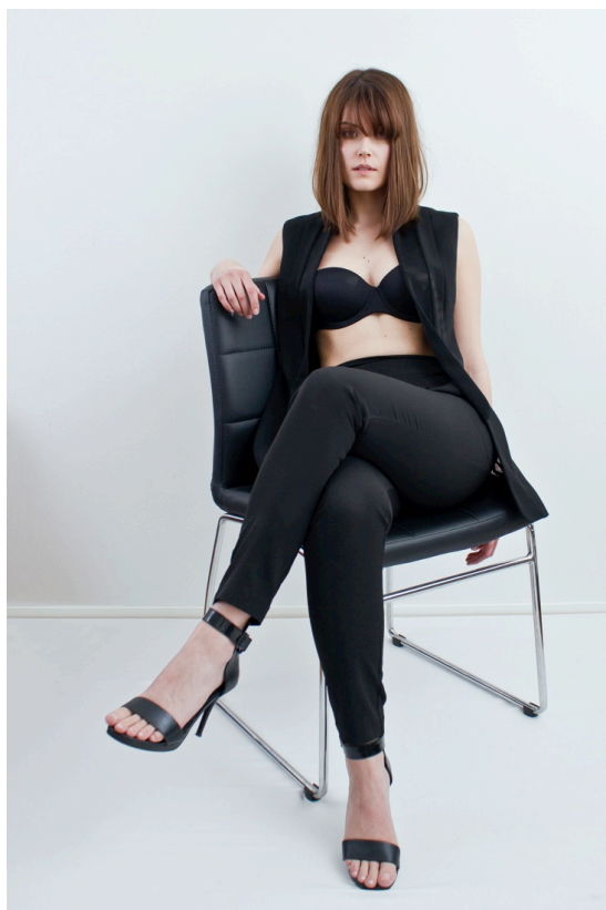
Kuva 8. Viettelys