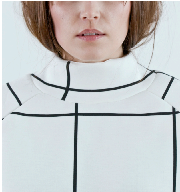
Kuva 4. Ruuturuouva