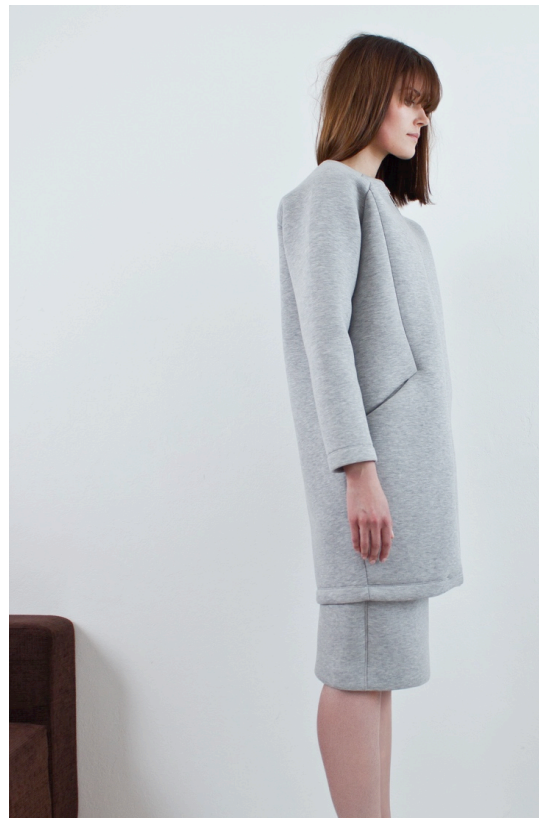
Kuva 2. Harmaa hetki