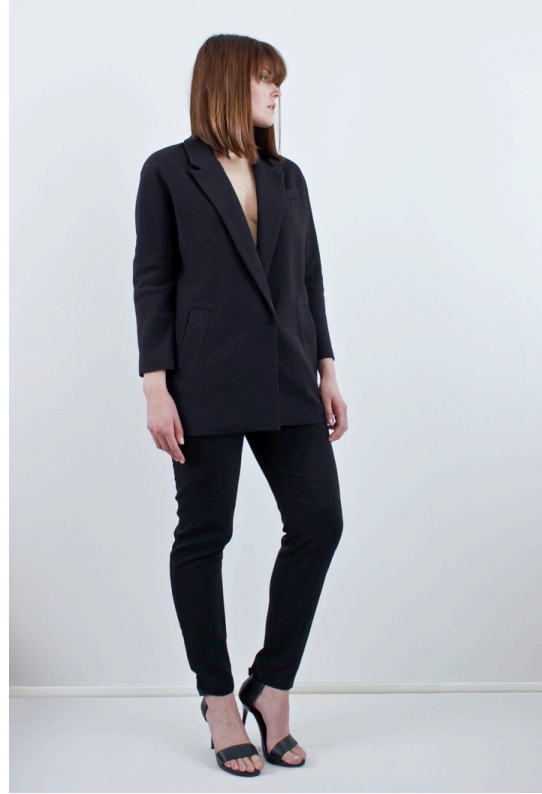
Kuva 7. Mustissa

Kuvassa 6 malli on kuvattu läheltä. Hän on osittain sivuprofiilissa, mutta kasvot ovat kameraan päin. Hill (2002) väittää, että minimalismi on tyyntä ja seesteistä. Kuvan mallilla on hyvin levollinen katse, mikä tuo mukavan vastakohtan mallin kovaan ja auktoriteettiseen tyyliin. Henderson & Henshaw'n (2010) mukaan musta väri viestii auktoriteetista. Oikealta puolelta tuleva luonnonvalo ja sälekaihtimet luovat toistuvan raitakuvion mallin kasvoille ja käsivarrelle. Smithin (1990) mukaan minimalistinen ideaali koostuu muun muassa yksinkertaisista, toistuvista muodoista. Kuvassa 7 malli seisoo osin sivuttain, kasvot oikealle päin ja oikeanpuoleinen jalka hieman koukistettuna. Tämä luo jakun kanssa yhteispelin, josta muodostuu pitkä, suora, diagonaalinen linja olkapäästä polveen. Malli näyttää hyvin itsevarmalta asennossaan ja asussaan. Walkerin (2011) mukaan pitkät selkeät linjat ovat minimalistisessä tyyliässä tärkeässä roolissa.