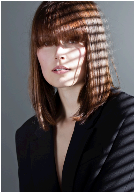
Kuva 6. Mustiin verhoutunut