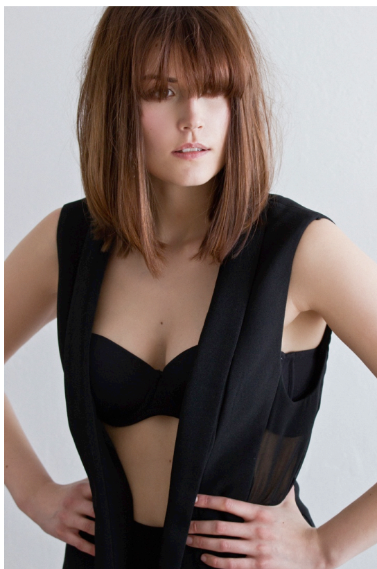
Kuva 9. Voimanainen

Kuvassa 8 malli istuu tuolilla, oikea jalka ristittyä vasemman jalan yli. Yksi käsi nojaa rennosti tuolin selkänojaan ja toinen käsi roikkuu vapaana. Katse on vahva ja suoraan kameraan päin. Kuvassa 9 malli on lähikuvassa: hänen kätensä ovat lantiolle aseteltuna, mikä luo naisellisen tiimalasivyötärön. Mallin katse on suunnattu hieman oikealle. Mallilla on yllään mustat olkaimettomat rintaliivit ja musta, pitkänmallinen suora liivi. Walkerin (2011) mukaan minimalismin yhtenä avainmääränä ovat pitkät selkeät linjat. Mallilla on myös yllään korkeavyötäröiset, suorat mustat housut ja korkeat mustat sandaalit. Kindersleyn (2012) mukaan minimalistinen tyyli on pelkistettyä ja väripaletiltaan suppeaa.