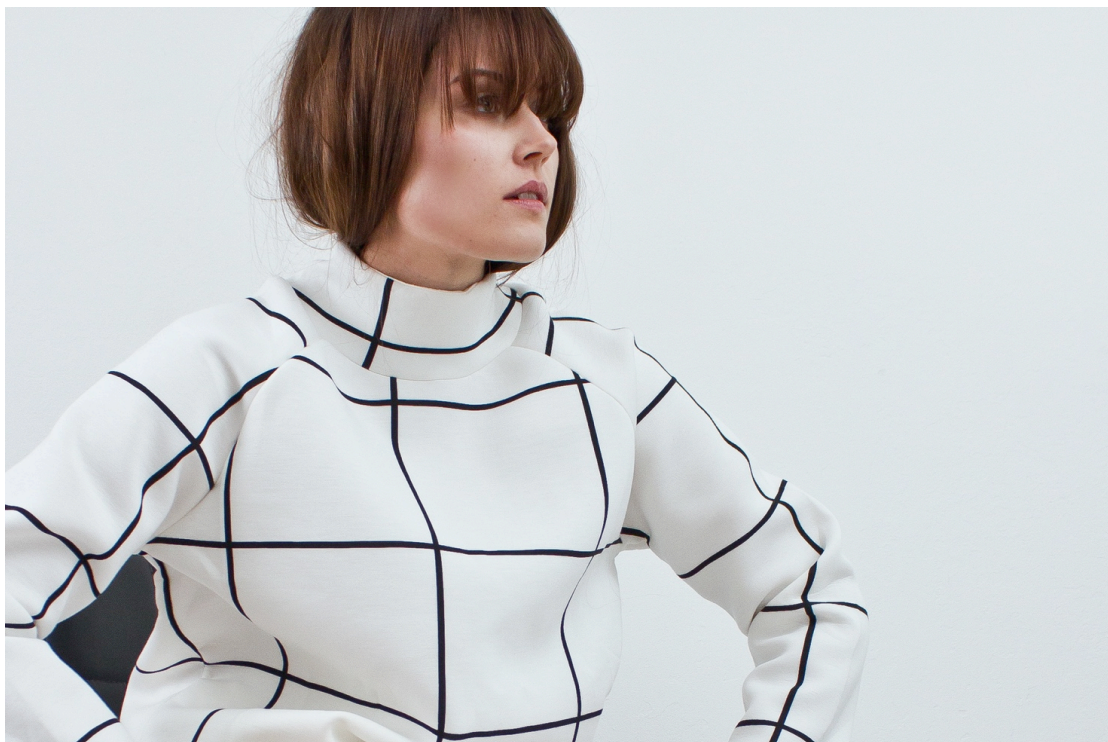
Kuva 5 Futurismi minimalismi