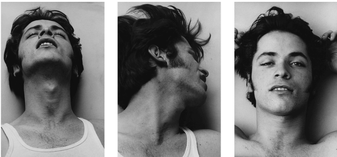
Peter Hujar, Orgasmic Man (I, II & III) , 1969 (screenshot)

Jag upplever att han gömmer sig bakom kameran. De ger honom modet att söka intimitet. Han behöver inte blotta sig själv, han är fotografen. Visar de här bilderna hans perspektiv på intimitet eller är detta så nära sann intimitet som han kan komma?