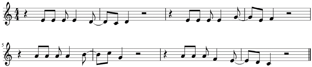
Kuvio 1. Sama rytmikuvio toistuu, mutta melodia muuttuu.