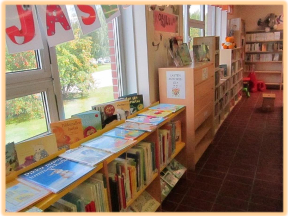
Kuva 2. Kuvakirjaseinä ennen uudistusta.

Uudet lokerikkohyllyt tilattiin. Suunnitelmana oli, että hyllyjen yläosan selattaviin lokeroihin sijoitettaisiin kuvakirjojen genret ja alaosan perinteiseen kirjahyllyyn entiset P-kirjahyllyn suosikkisarjat sekä muutama muu kysytty sarja. Pidetty P-kirjahylly säilyisi, mutta saisi väljemmän esillepanon, kun osa sen kirjoista sijoituisi uuden genrelokerikon alaosan hyllyyn. Uuden hyllykokonaisuuden väriksi valittiin keltaisesta kuvakirjaseinästä poiketen punainen. Ajatuksena oli genrehyllyn tunnistettavuus ja helppo neuvottavuus, sekä lastenosaston vahvojen värien iloisuus.