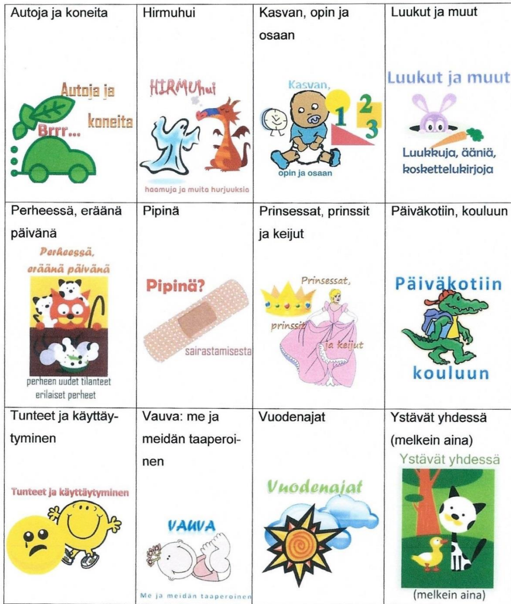
Kuva 3. Genret ja niiden kuvamerkinntät.