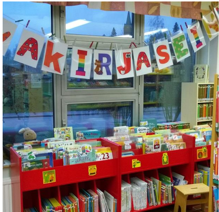
Kuva 5. Genrelokerikko kuvakirjaseinällä.