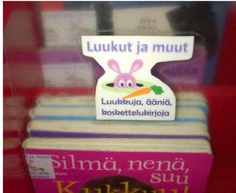
Kuva 4. Luukut ja muut-genre.

sen kaiken ikäisille käyttäjille, valmiiksi uusiutumaan käyttäjiensä myötä. Vuorovaikutus sen ja koko osaston käyttäjien kanssa on tärkein muutoksen työkalu.