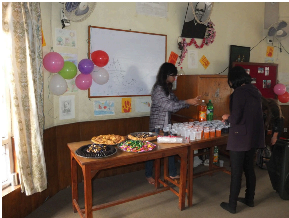
Kuva 14. Vapaaehtoistyöntekijät auttamassa tarjottavien esillepanossa

Pidin pojille ulkona puheen ja kerroin miksi olemme järjestäneet tämän valokuvanäyttelyn. Kerroin, että näyttelyssä on kuvia kaikista pojista ja työntekijöistä harjoittelumme ajalta sekä kehystetyt kuvat pojista, jotka osallistuivat produktioon. Kuvaaja osoittaa tilanteen arvokkaaksi ottamalla kuvia ja palaamalla niihin myöhemmin (Harju 2009, 232). Pojat olivat innoissaan, kun pääsivät sisälle katsomaan omia kuvia (ks. Kuva 15). Pojat, jotka olivat osallistuneet produktioon, olivat erityisen innoissaan, sillä he halusivat nähdä kuvansa kehystettyinä. He esittelivät muille omia kuviaan ja kertoivat, että saavat ne vielä lopuksi itselleen. He olivat selvästi ylpeitä kuvistaan.