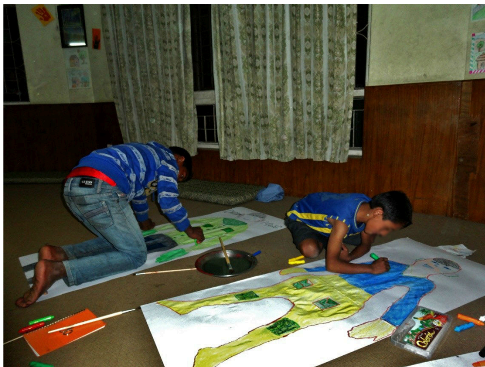
KUVA 3. Pojat hiovat yksityiskohtia keskittyneesti

Pojat piirsivät tarkkoja yksityiskohtia kuviinsa (ks. Kuva 3) ja jaksivat maalata vaikka kuinka kauan. Olin ajatellut, että saamme tunnissa hoidettua koko prosessin, mutta aikaa meni melkein puolitoista tuntia. Muut pojat alkoivat palata jalkapallokentältä ja yrittivät tulla sisälle luokkahuoneeseen. Käännytin heidät ja kerroin, että tarvitsemme vielä rauhallista aikaa tehdä työt loppuun. Muut pojat yrittivät kurkistella ikkunoista sisälle, mutta poikien keskittymiskyky ei kuitenkaan herpaantunut. Muut pojat tulivat kyselemään, että pääsenkö minäkin maalaamaan ja, että mitä te siellä oikein teitte. Harmitti, kun en voinut ottaa kaikkia poikia mukaan. Järjestimme toisen opiskelijan kanssa kaikille lastenkodin pojille kuitenkin muuta ohjelmaa, jotta heille ei tulisi paha mieli.