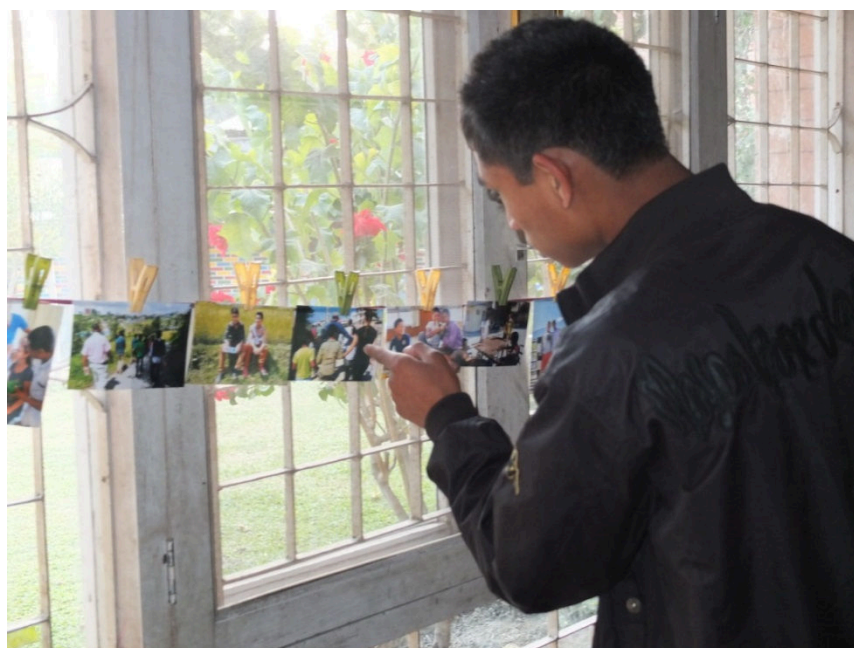
Kuva 17. Valokuvan valitsemista

Sovimme, että jokainen lastenkodin poika sai valita itselleen muistoksi yhden valokuvan (ks. Kuva 17). Pojat olivat niin nopeita ottamaan kuvia, joten voi olla, että muutama poika jäi ilman. Jälkikäteen ajateltuna olisi pitänyt tehdä niin, että me olisimme antaneet jokaiselle yhden valokuvan. Valokuvanäyttelyn jälkeen produktioon osallistuneet saivat voimakuvansa muistoksi itselleen produktiosta.