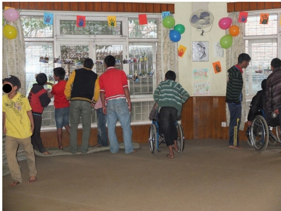
Kuva 16. Pojat tarkastelevat valokuvanäyttelyn satoa

Sovimme, että jokainen lastenkodin poika sai valita itselleen muistoksi yhden valokuvan (ks. Kuva 17). Pojat olivat niin nopeita ottamaan kuvia, joten voi olla, että muutama poika jäi ilman. Jälkikäteen ajateltuna olisi pitänyt tehdä niin, että me olisimme antaneet jokaiselle yhden valokuvan. Valokuvanäyttelyn jälkeen produktioon osallistuneet saivat voimakuvansa muistoksi itselleen produktiosta.