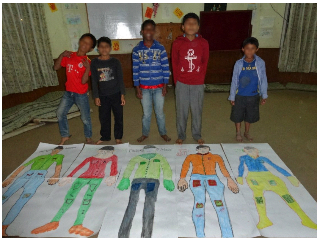
Kuva 4. Ylpeät pojat ja valmiit omakuvat

Pojat näyttivät ylpeinä kuviaan muille ja säteilivät ilosta, kun saivat kehuja. Muut pojat tulivat heti auttamaan ja leikkaamaan teippiä. Teippailimme kuvat (ks. Kuva 5–7) seinille poikien omien sänkyjen lähetyville. Sanoinkin, että kuvaa voi aina katsoa herätessä ja muistella kuvan tekemistä. Pojat tulivat vielä kiittämään kuinka kivaa heillä oli ollut.