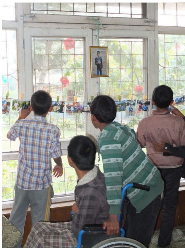
Kuva 15. Pojat tutustumassa omiin kuviin

Kaikki työntekijät pääsivät paikalle ja kertoivat, että olemme tehneet hyvää työtä ja kuvat näyttävät todella hyviltä. Oli ihanaa kuulla positiivista palautetta, sillä kaiken tämän produktion järjestelyihin oli mennyt paljon aikaa. Parasta oli kuitenkin nähdä ilo poikien silmissä, kun jokainen etsi omia kuviaan ja halusi esitellä niitä muille. Pojat jaksoivat yllättävän kauan keskittyä kuvien katseluun ja he tarkkailivat kuvia todella pitkään (ks. Kuva 16). Yksi pojista tuli kysymään, että saako hän todella tämän kuvan itselleen näyttelyn päätyttyä. Kerroin, että kyllä, saat sen muistoksi tästä kaikesta. Se hymy ulottui kyllä korviin asti ja hän pakasi kuvan näyttelyn loputtua hellävaroin reppuunsa. Valokuvat jäävät näkyviksi muistoiksi ja työnjälki heijastuu omaan elämään (Halkola 2009, 17). Valokuvilla ja kuvaamisella rakennetaan yhteisöllisyyttä ja valokuvat ovat läsnä visuaalisessa ympäristössämme (Savolainen 2009, 213). Valokuvien katselun jälkeen herkuteltiin, leikittiin sydänleikkiä ja pidettiin hauskaa.