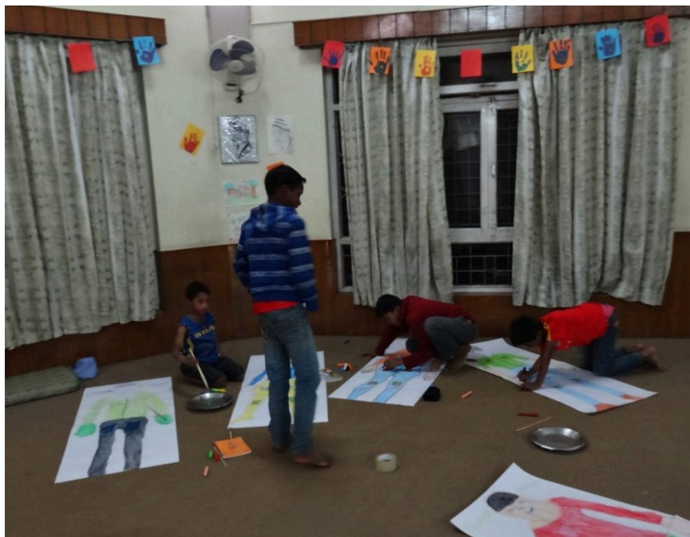
Kuva 2. Pojat maalaavat omakuviaan luokkahuoneessa

sin. Pojat myös tottuivat paremmin kameran käyttämiseen, sillä otin heistä kuvia mahdollisimman paljon. Oli tärkeää tehdä kamerasta tuttu väline, jotta osallistavaa valokuvaamista pystyi toteuttamaan. Kertasin vielä pojille muiden tapaamisten sisältöjä ja aikatauluja. Kerroin, että haastattelen heitä torstain ja perjantain aikana haastattelulomaketta käyttäen. Sovimme, että haastattelen osaa pojista torstaina illalla jalkapallon jälkeen ja loppuja perjantaina aamulla.