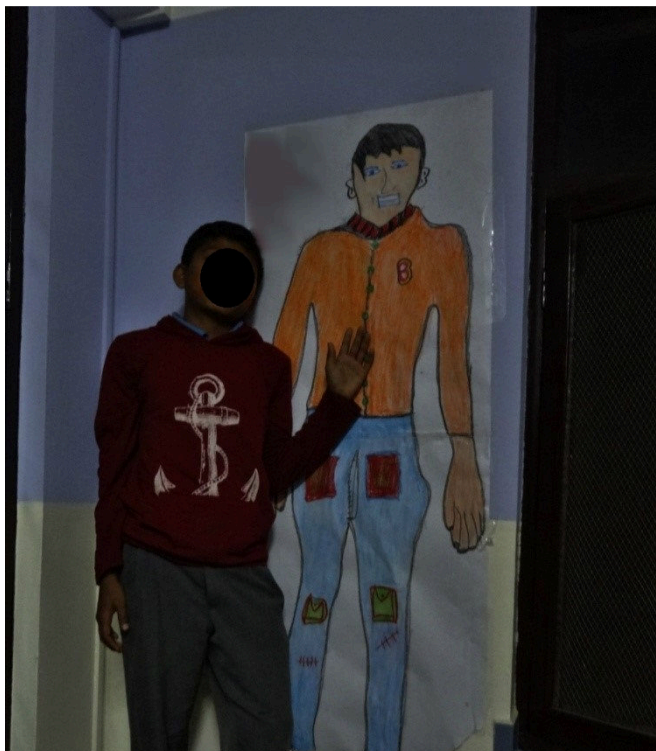
Kuva 5. Ram ja hänen omakuva ripustettuna huoneen seinälle