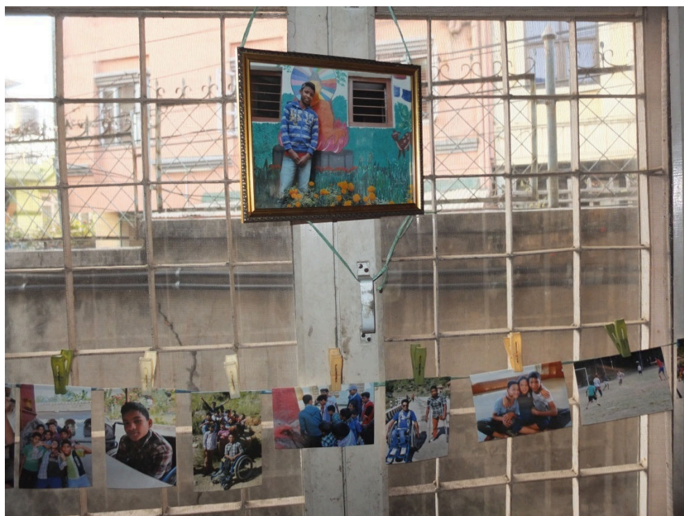
Kuva 13. Yhden pojan voimakuva kehystettynä, alla kuvia muista lastenkodin pojista

Yhdessä vapaaehtoistyöntekijän ja toisen harjoittelijan avulla kiinnitimme ikkunoihin narut, joihin ripustimme valokuvia pyykkipojilla (ks. Kuva 13). Laitoimme ne sellaiselle korkeudelle, että pienemmätkin varmasti näkisivät ne. Laitoimme ilmapalloja koristamaan luokkahuonetta ja asettelimme naposteltavat ja limut valmiiksi (ks. Kuva 14). Kehystetyt kuvat laitoin näkyville paikoille koristamaan jokaista ikkunaa. Pojat yrittivät koko ajan tulla kurkkimaan, mitä oikein puuhaamme. Käännytimme heidät, sillä emme halunneet kenenkään näkevän tilaa ennen kuin kaikki olisi valmista.