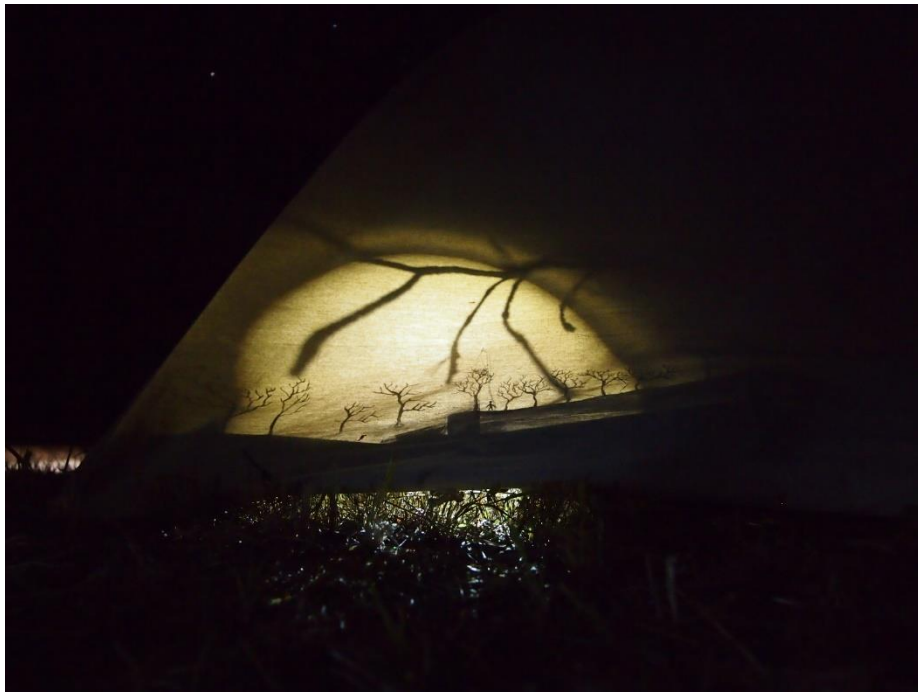
Kuva 4. Matkaelegia , Kontufolk, 2013

siinsa. Esityksessä ei ollut selkeää narraatiota. Se oli pikemminkin installaation kaltainen aistillinen ja väreilevä kuva. Esityksen työstäminen jätti jälkeensä ajatuksia tulevia projekteja varten. Halusin kehittää pidemmälle ajatusta maiseman kertomuksesta maisemassa olevan ihmisen kautta sekä tuoda sen selkeämmin esiin narraation kautta.