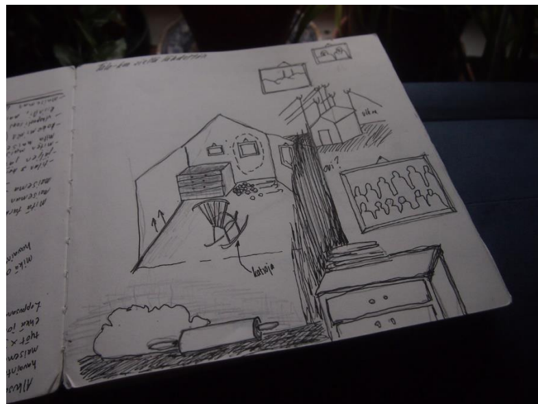
Kuva 8. Hahmotelmia esityksestä Kun sieltä lähdettiin

Talo on talo, jota en oikeastaan koskaan ole nähnyt, mutta talo, joka silti aina ollut mielessäni. Se on talo, jossa isoäitini, babuska asui Karjalassa ennen sotaa. Se on talo, joka on ollut kuvitelmissani lapsuudesta asti. Babuskani talo pysyy aina täytenä. tarinat talosta päättyivät painokkaiisiin sanoihin silloin kun