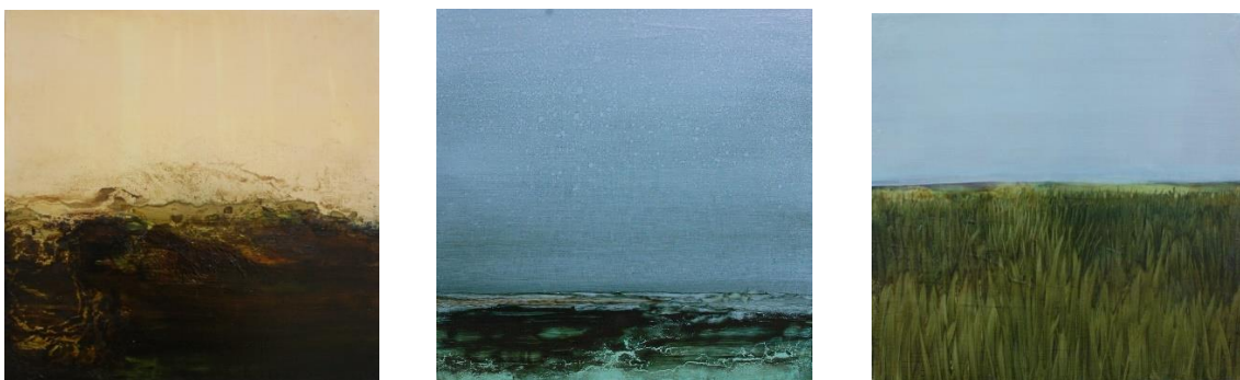
Kuva 2. Teoksia sarjasta Tuulen puolella , 2013

Yksi maalaus pohjalle vaakasuuntaan vedetty viiva luo ympärilleen tilaa, oletuksen maisemasta. Leikittelin maalauksissa horisontin peittämisellä, piilottamisella ja poispyyhkimisellä. Tila muuttui esittävästä viitteelliseksi yhdellä pyyhkäisyllä. Maisema heilui työstövaiheessa pitkään olemassaolonsa rajoilla. Galleriatilaan rinnakkain asetettuna ne kävivät dialogia keskenään, jatkoivat maalausprosessissa käynnistynyttä leikkiä ja ehdotuksia.