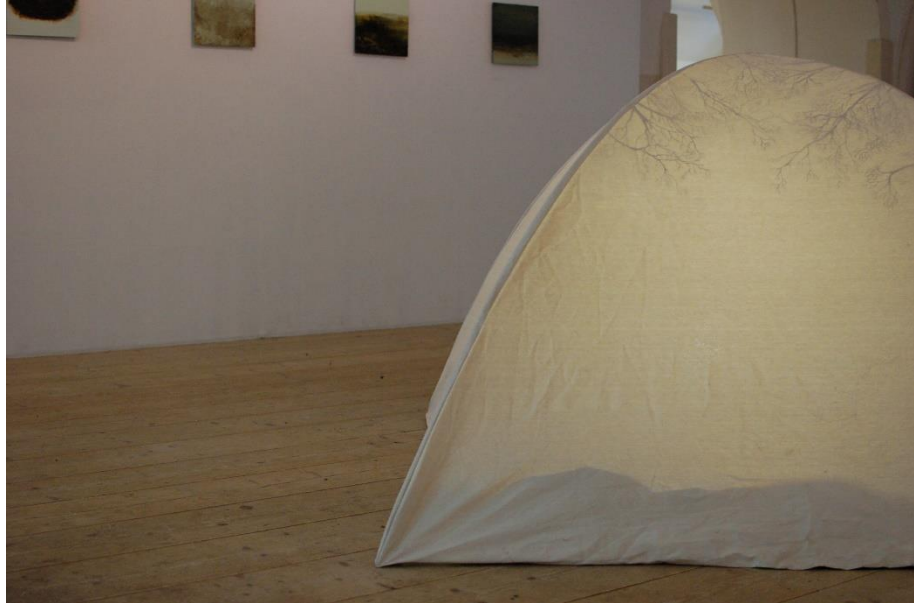
Kuva 3. Matkaelegia , Galleria Rantakasarmi, 2013

Installaatiota rakentaessani ajattelin myös installaation esityksellisiä mahdollisuuksia. Halusin käyttää esityksessä varjoja, sillä koin varjoteatterin olevan minulle luontainen jatko työskennelyäni pitkään maalausten parissa. Varjoteatterin kangas ja maalaus kangas ovat molemmat kaksiulotteisia ikkunoita omaan todellisuuteensa. Varjoteatterissa katsoja näkee esineiden varjot, ei varjoja muodostavia esineitä. Maalauksessa katsoja voi nähdä mitä tahansa, vaikka todellisuudessa näkee vain maalatun pinnan. Molemmille tärkeää on valojen ja varjojen vaihtelu, ilman sitä niiden maailma ei tulisi katsojalle näkyväksi.