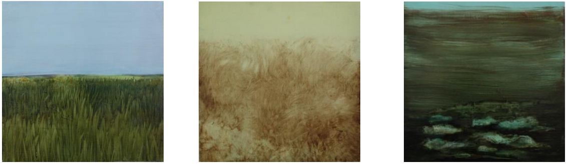
Kuva 1. Teoksia sarjasta Tuulen puolella , 2013

Tämän vuonna 2012 ylös kirjaamani maisemallisen kokemuksen siivittämänä aloitin Tuulen Puolella maalaussarjan työstämisen. Teossarja koostui kahdestatoista pienestä maalauksesta, joiden keskeisenä aineksena oli horisontti. Teossarja oli esillä Helsingissä Galleria Rantakasarmilla talvella 2013.