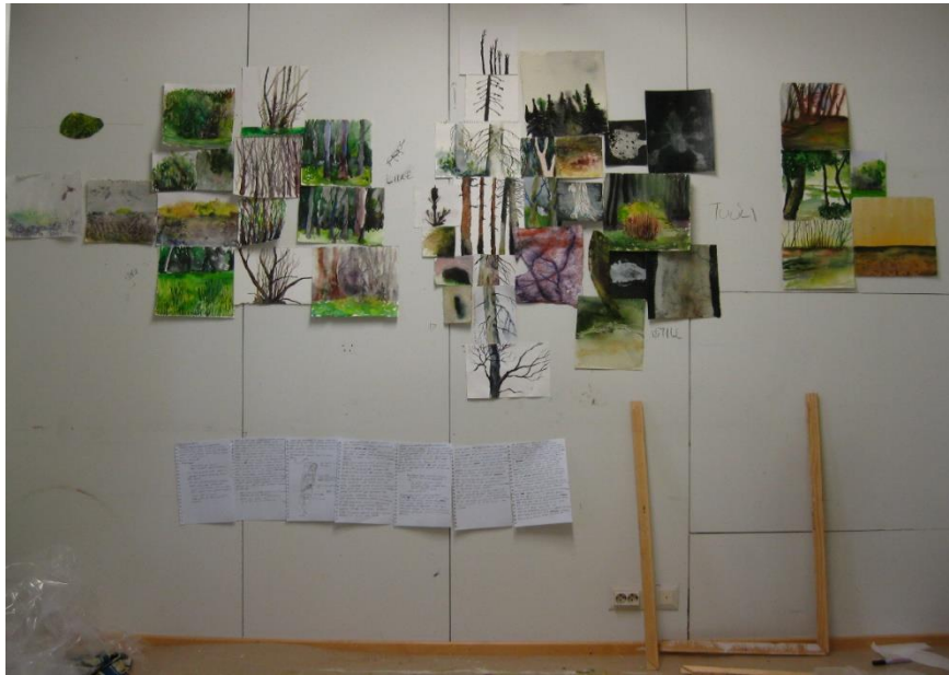
Kuva 5. Aidantakainen Atlas , dramaturgisia hahmotelmia, 2014

tekstissä dokumentoivan otteen, joten muokkasin tuotettua tekstiä vain vähän. Tekstin tyyli oli jotain luontopäiväkirjan ja runon väliltä.