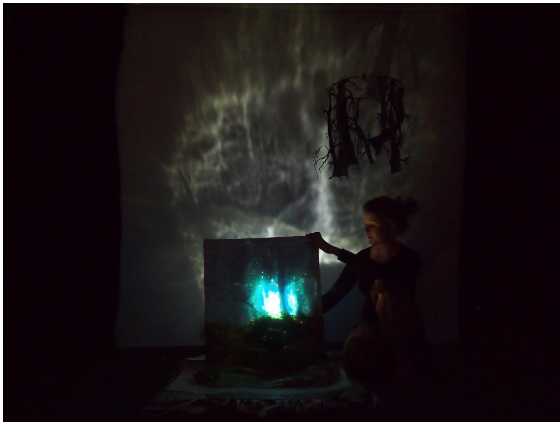
Kuva 6. Aidantakainen Atlas , Teatteri Kallio, 2014

katsojien ympärille. Varjojen kautta esitys levittyy tilaan kuin metsä kokijansa ympärille.