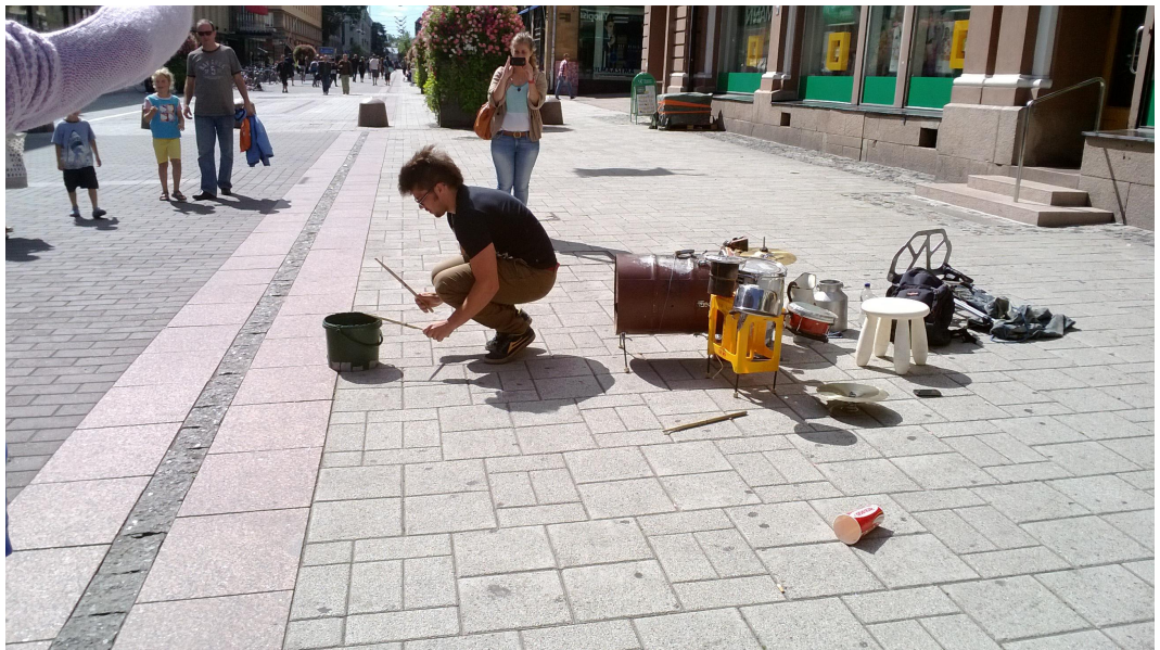
Kuva 6. Kävelykatu, Turku.

Improvisoidessa on mahdollisuus äärimmäiseen vuorovaikutukseen; on mahdollista ottaa impulsseja ympäristöstä ja muokata musiikkia sen mukaan, kuten esimerkissä, jossa olin Lahden torilla vappuna soittamassa ja ihmisiä yleisöstä osallistui mukaan. Uskon, että tällaista ei synny, jos ei ole avoin erilaisille mahdollisuuksille ja uskalla ottaa riskejä. Vaikuttiko se, että esitykseni oli hyvin vapaata ja vahvasti improvisoitua, joten siihen oli helppoa tulla mukaan? Onko siis improvisoitu musiikki jollain tavalla enemmän mukaansa tempaavaa kuin valmiiksi harjoiteltu ohjelmisto? Ainakin luulisi, että katsojan kynnyks osallistua voi olla pienempi, jos hän aistii, että kaikki eli ole täysin etukäteen sovittua ja viimeisen päälle harjoiteltua.