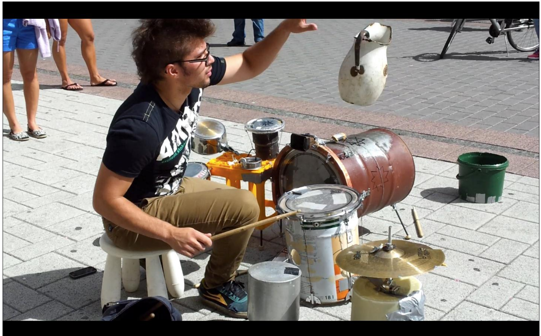
Kuva 4. Minä esittelemässä esineitä, joita on katurumpusetissäni.