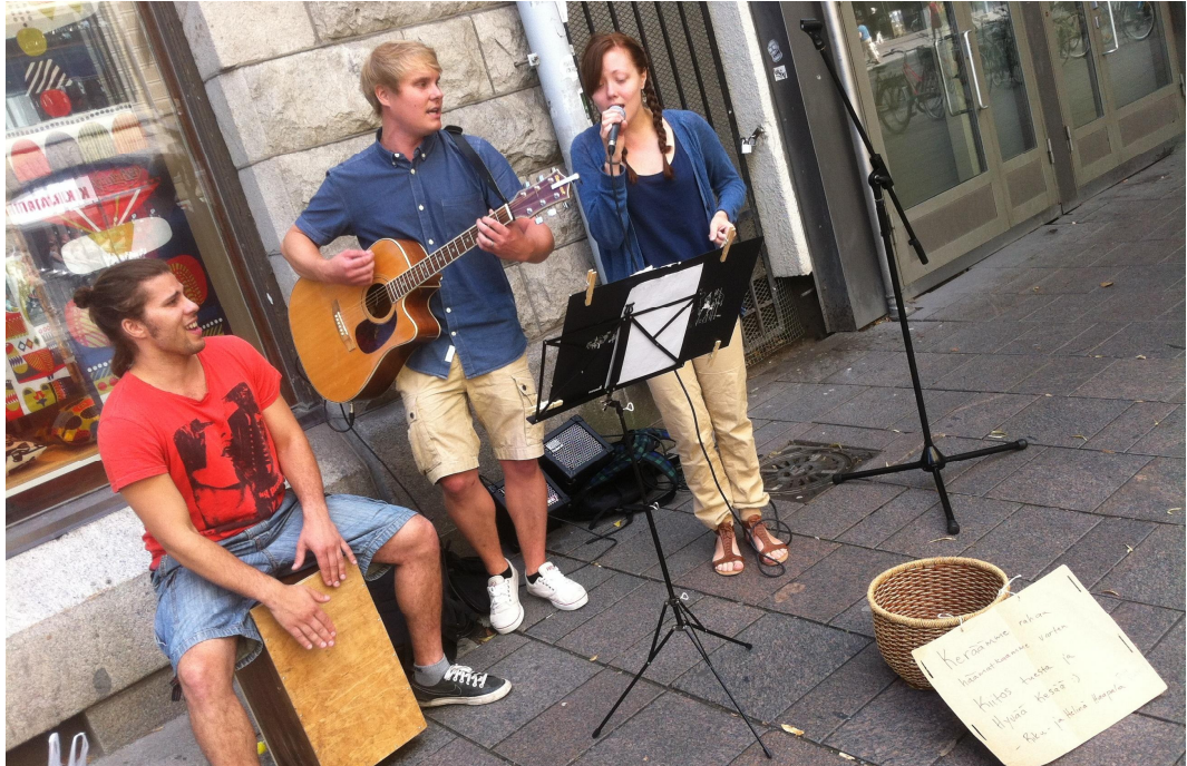
Kuva 5. Minä ja ystäväni soittamassa kadulla Tampereella.

Avainsana on esillepano. Ajatellaan, että on kaksi kauppiasta, joilla molemmilla on täysin samat tuotteet samaan hintaan ainoastaan sillä erotuksella, että toisella kauppialla on paljon enemmän tuotteita. Voitaisiin ajatella, että tietysti asiakkaat tulevat sen luo, jolla on enemmän tarjontaa. Jos toinen kauppiasta on kuitenkin laittanut tuotteensa hyvin kiinnostavasti esille ja on vielä sosiaalisesti taitava ja mukava ihminen, niin kumpi kiinnostaa asiakasta enemmän? Tähän saattaa liittyä myös liian suuren tarjonnan aiheuttama valinnan vaikeus, joka usein ahdistaa ihmisiä. Itse tunnustan kuuluvani tähän ryhmään, ja etenkin isoissa kaupoissa valikoiman laajuus saa minut ahdistuneeksi. Siksi ostan tuotteet mieluummin kaupasta, jossa esillepano on miellyttävä ja selkeä, vaikka tuotteita ei olisikaan paljon.