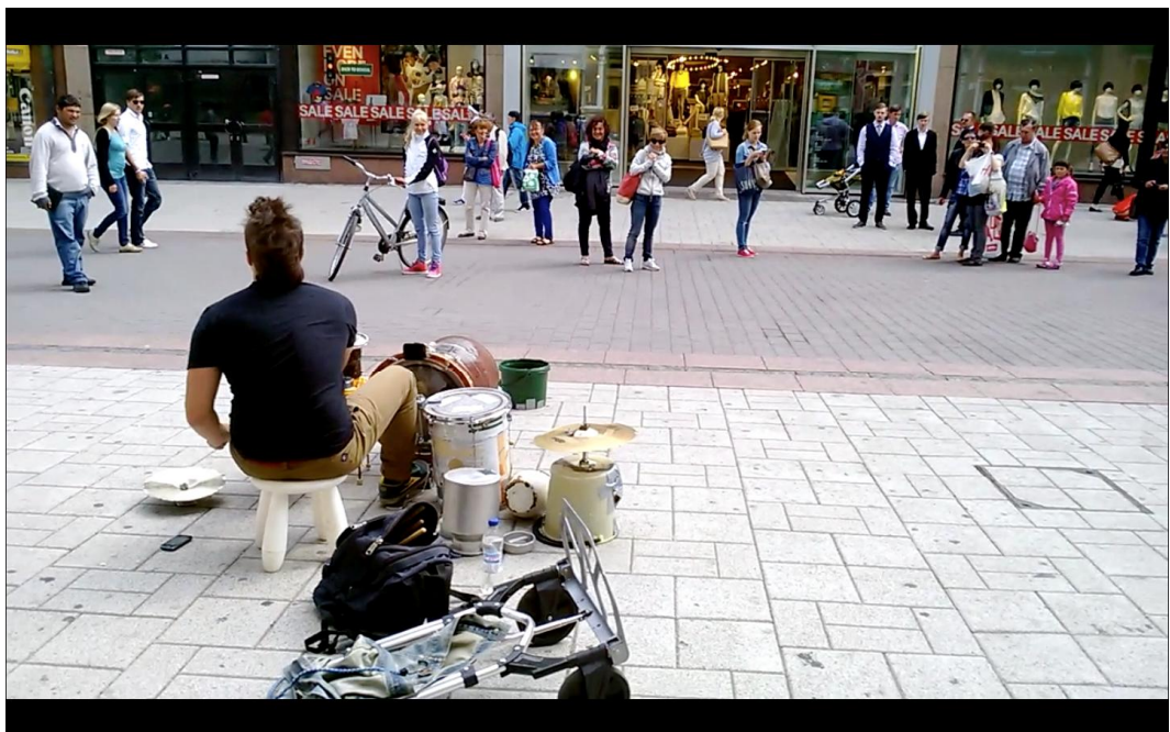
Kuva 1. Minä soittamassa katurumpujani kävelykadulla Turussa 2014.