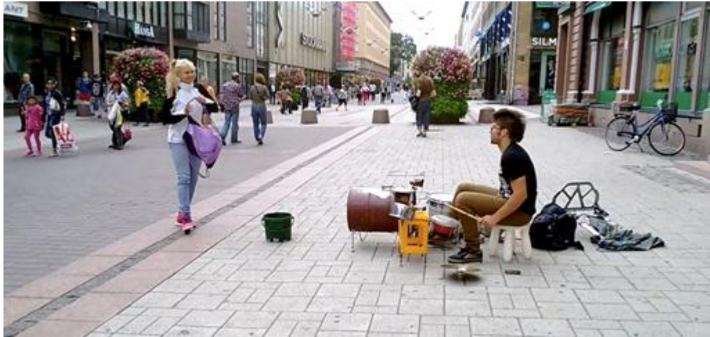
Kuva 2. Nainen joka oli kuunnellut pitkään, kiitti iloisesti soitostani Turussa.

Yksi syy siihen, että lähdin alun perin katusoitamaan, oli tutkia sitä, miten pystyn ottamaan haltuun tilanteen, jossa ihmisiä ei ole kutsuttu kuuntelemaan esitystä. Katusoitossa ihmisten huomio ja mielenkiinto on tavoitettava juuri kyseisessä hetkessä. Esiintyjälle yleisön suosio ei ole koskaan itsestäänselvää. Katusoitossa lähtökohta on kuitenkin vielä arvaamattomampi, sillä yleisöllä ei voi olla siitä mitään ennakko-odotuksia: kukaan ei yksinkertaisesti ole tiennyt ennakkoon mitään esiintymisestä tai esimerkiksi valinnut sitä tyyllilajin mukaan. Katusoiton ja konsertin yksi merkittävä ero on yleisön vapaaehtoisen rahallisen tuen mahdollisuus. Samalla se on soittajalle suora palaute hyvästä soitosta tai esiintymisestä.