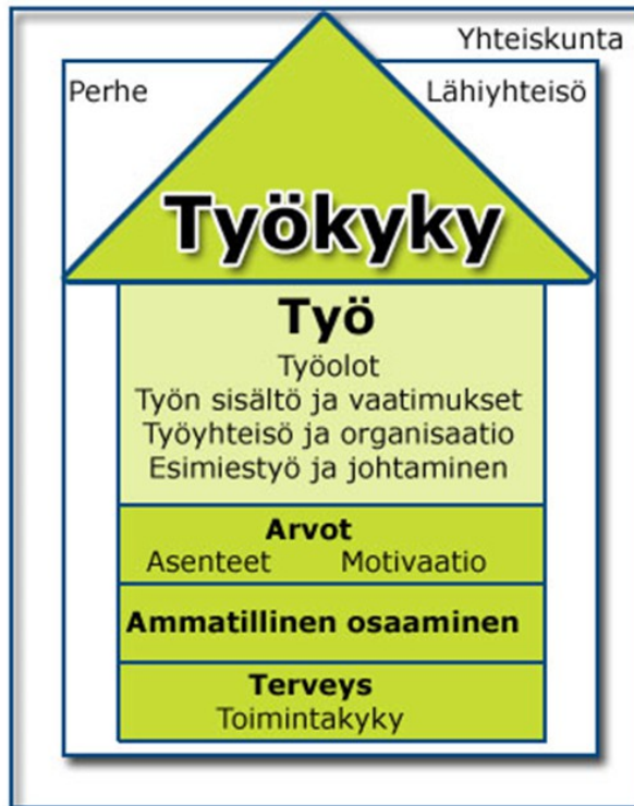
Kuvio 2. Yksilön työkykyyn vaikuttavat tekijät (Työterveyslaitos 2014)

Työkyky muodostuu neljästä eri tekijästä. Nämä tekijät ovat terveys ja toimintakyky, ammatillinen osaaminen, arvot sekä itse työn sisältämät tekijät.